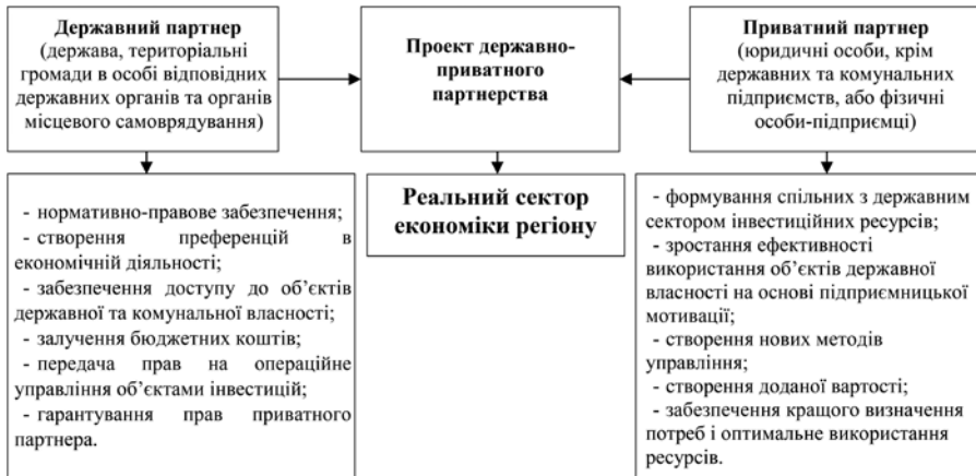
Рис. 2. Організаційний механізм державно-приватного партнерства (розробка авторів)

Механізм державно-приватного партнерства набирає все більшої популярності у всьому світі. В залежності від участі та ролі держави у цьому механізмі, на теоретичному рівні можна виділити такі типи державно-приватного партнерства: держава – замовник; держава – рівноправний партнер; держава – гарант. Запропоновані типи моделей державно-приватного партнерства ґрунтуються на визначенні як пріоритетної ролі держави.