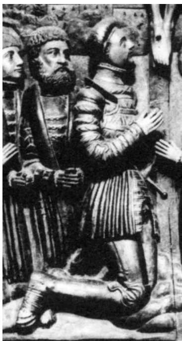
Ryc. 12. Detale epitafium Bogusława X z ok. 1550 r. Za: Łopuch 2017, ryc. 7

Fig. 12. Details of the epitath in memory of Bogislaw X of Pomerania from c. 1550. After: Łopuch 2017, ryc. 7