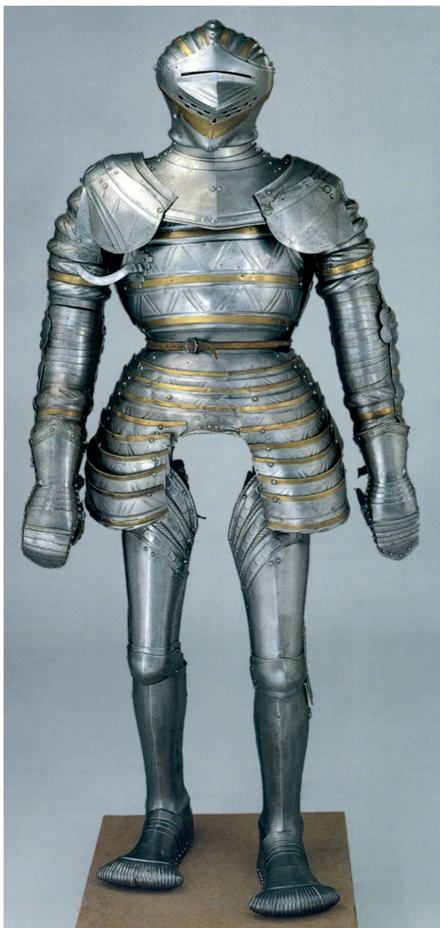
Ryc. 14. Zbroja kostiumowa z ok. 1515 r. Deutsches Historisches Museum w Berlinie (nr inw. W 2327). Za: Atzbach, Lüken, Ottomeyhem 2010, ryc. 6:12