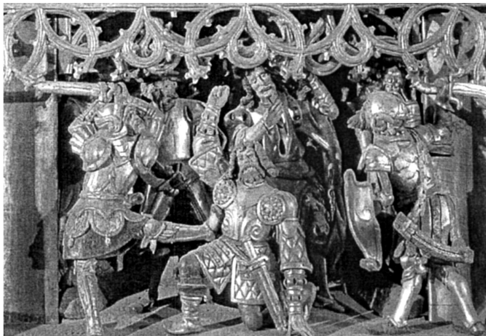
Ryc. 6. Fragment ołtarza w Waasen z ok. 1520 r. Za: Łopuch 2002, 144 Fig. 6. Altarpiece from Waasen, c. 1520. After: Łopuch 2002, 144