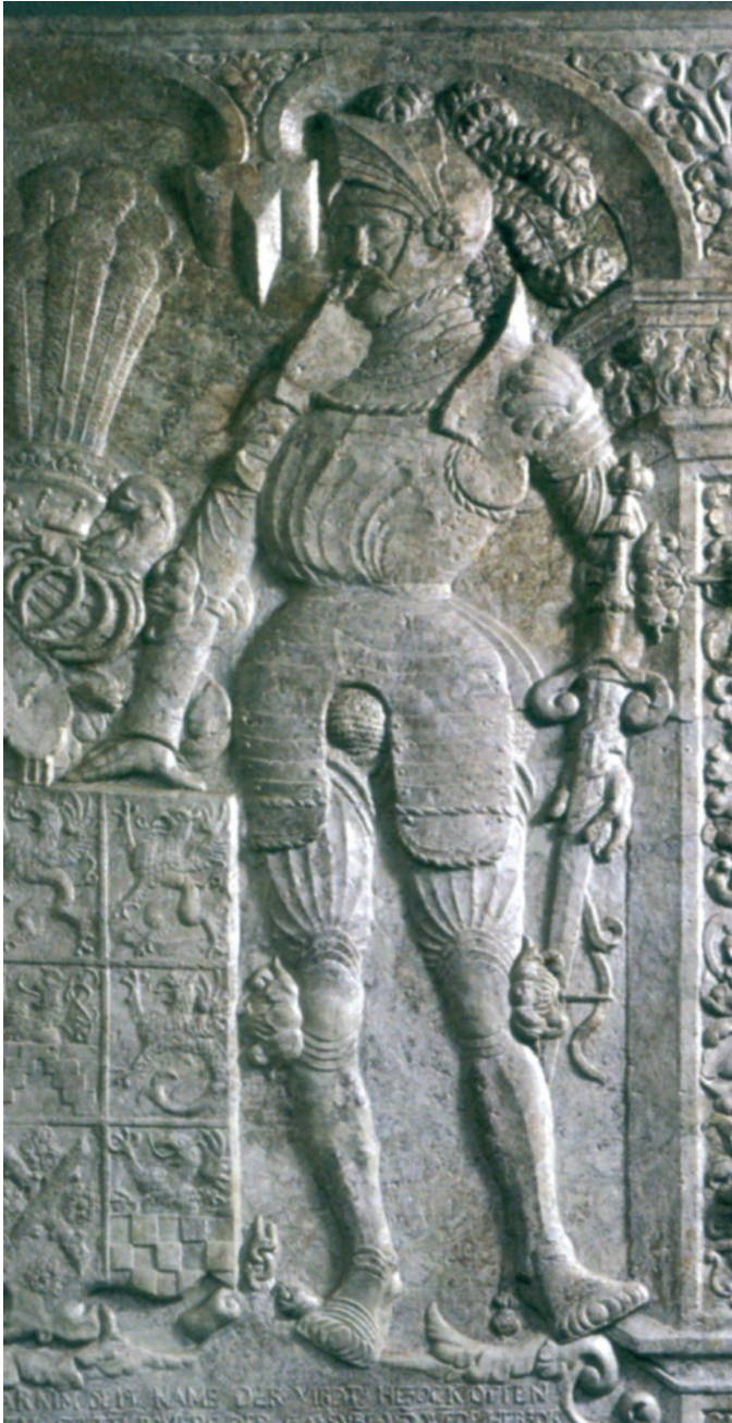
Ryc. 1. Barnim III. Płyta fundacyjna z 1543 r., Zamek Książąt Pomorskich w Szczecinie, pierwotnie na zamku Oderburg (Zamek Odrzański). Za: Krasnodębska 2013, ryc. 56