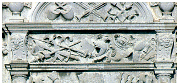
Ryc. 8. Fragment płyty fundacyjnej Ernesta Ludwika z 1574 r. Zamek w Pudagli. Za: Krasnodębska 2013, ryc. 62

Fig. 8. Fragment of Ernst Ludwig's foundation plaque from 1574. The castle in Pudagla. After: Krasnodębska 2013, ryc. 62