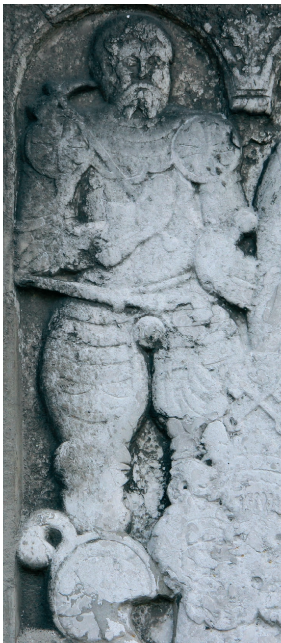
Ryc. 4. Wedigo von der Osten. Płyta nagrobna z ok. 1612 r., nowy zamek w Płotach, pierwotnie w rozebranym kościele.