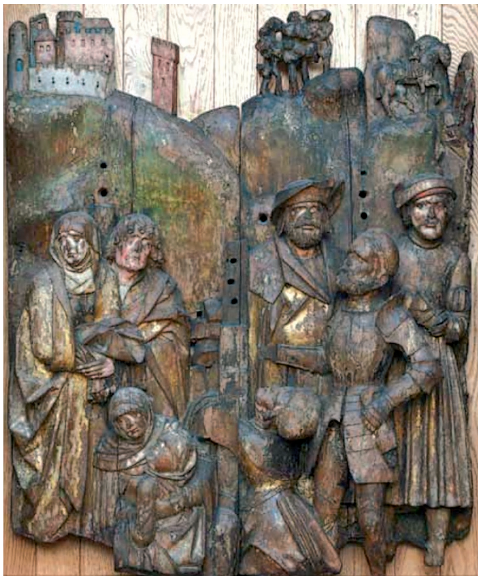
Ryc. 5. Ukrzyżowanie. Fragment ołtarza z Wkryujścia, ok. 1510–1520 r. Za: Krasnodębska 2012, 27 Fig. 5. Crucifixion. Altarpiece from Wkryujście, c. 1510–1520. After: Krasnodębska 2012, 27