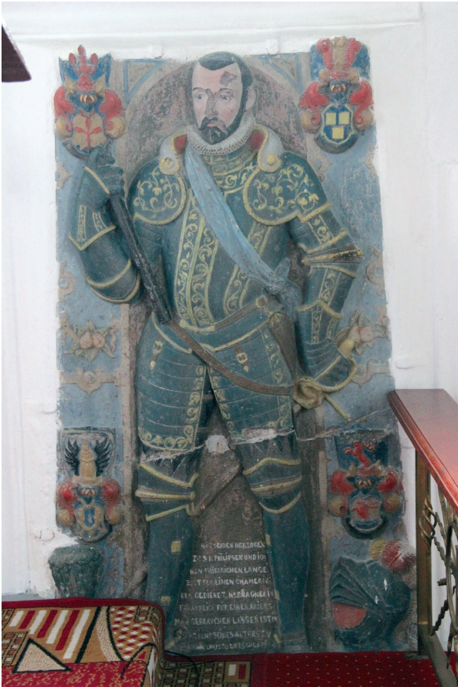
Ryc. 3. Peter von Küssow. Płyta nagrobna z ok. 1612 r., kościół w Mechowie. Fig. 3. Peter von Küssow. Tombstone from c. 1612, the church in Mechowo.