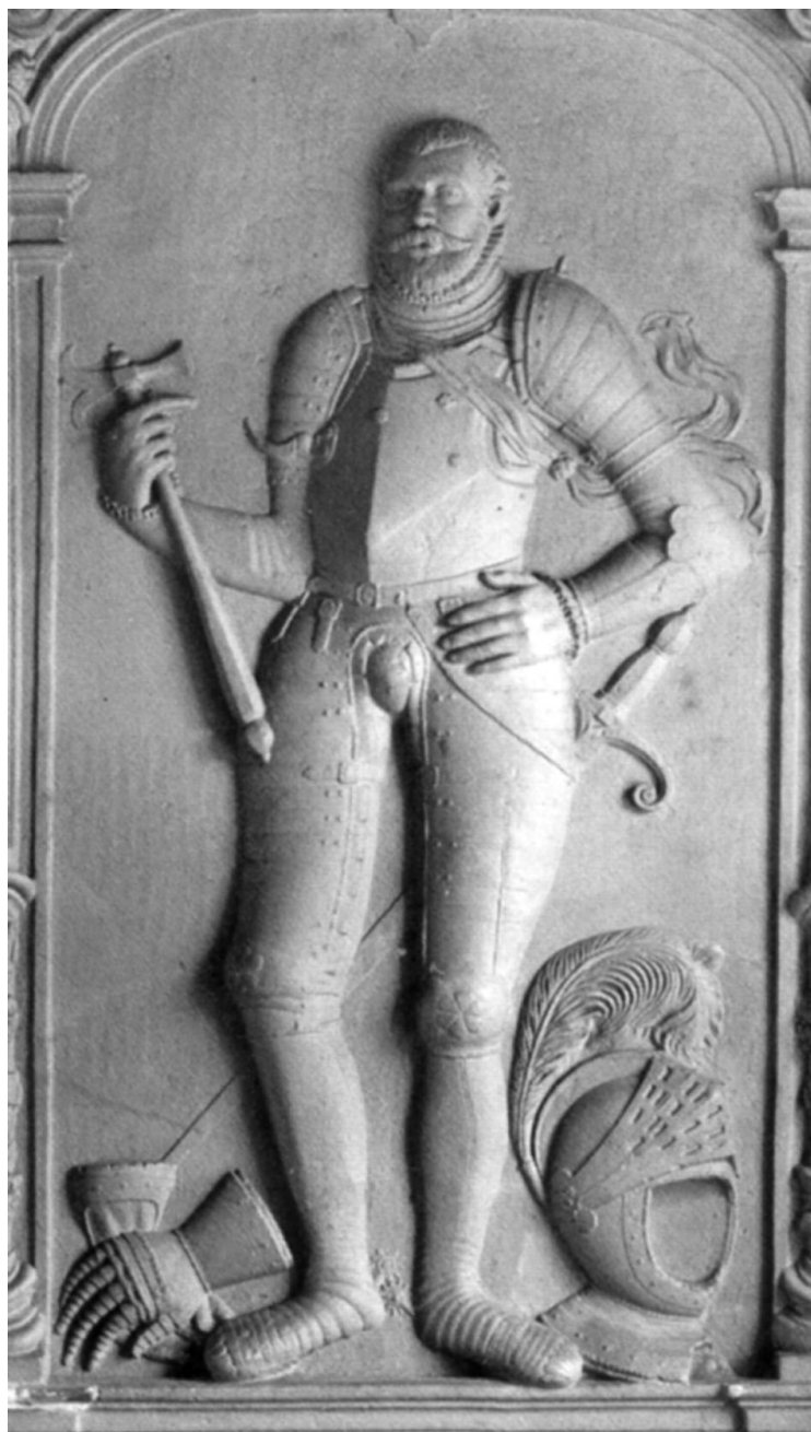
Ryc. 7. Ernest Ludwik. Płyta fundacyjna z ok. 1580 r., Ernst-Moritz-Arndt-Universität w Greifswaldzie, pierwotnie na zamku w Wołogoszcy. Za: Krasnodębska 2013, ryc. 63

Fig. 7. Ernst Ludwig. Foundation plaque from c. 1580, Ernst-Moritz-Arndt-Universität in Greifswald, originally the castle in Wołogoszcz. After: Krasnodębska 2013, ryc. 63