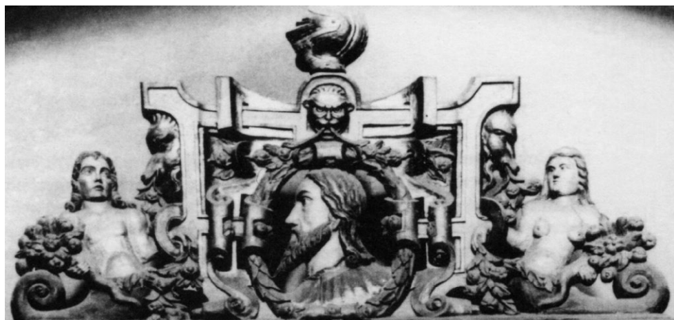
Ryc. 13. Detale górnej części epitafium Bogusława X z ok. 1550 r. Za: Łopuch 2017, ryc. 7

Fig. 12. Details of the epitath in memory of Bogislaw X of Pomerania from c. 1550. After: Łopuch 2017, ryc. 7