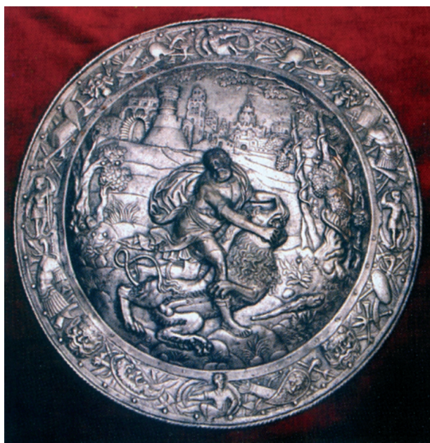
Ryc. 9. Tarcza ceremonialna z XVI wieku. Za: Kwaśniewicz 2005

Fig. 8. Fragment of Ernst Ludwig's foundation plaque from 1574. The castle in Pudagla. After: Krasnodębska 2013, ryc. 62