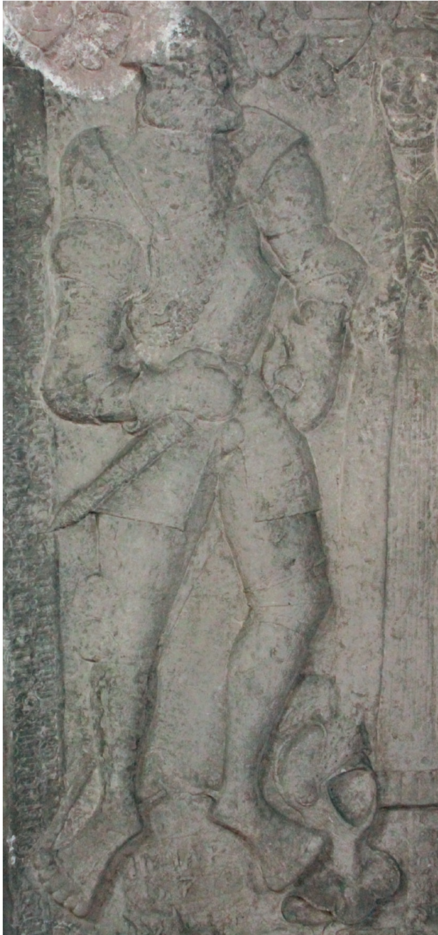
Ryc. 2. Jobst von Dewitz. Płyta nagrobna z 1577 r., kościół w Dobrej. Fig. 2. Jobst von Dewitz. Tombstone from 1577, the church in Dobra.