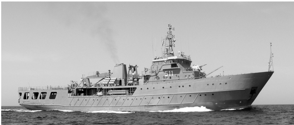
Fot. 1. ORP Konradmiral Xawery Czernicki na wodach Zatoki Perskiej, 2003 rok.