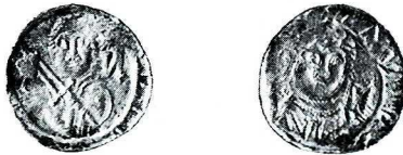
Ryc. 2. Wandynowo, grób 61. Denar Władysława II. Skala ok. 1.5:1.

1. Polska , Władysław II (1138–1146), denar; Such. 2, Kop. III.k; podwyższone krawędzie, czytelne ślady zużycia stempla (zwłaszcza Rv.), lekko wytarty, 0,428 g, 12,2 mm (ryc. 2). Ar VIII, grób 61 (mężczyzna, 30–40 lat), obok noża żelaznego z lewej strony kości miednicy. Inw. połowy W/204/99.