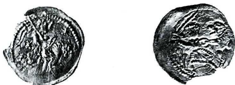
Ryc. 3. Wandynowo, grób 27. Denar anonimowy. Skala ok. 1.5:1.

3. Polska , Bolesław IV Kędzierzawy (1146–1173), denar; Av. władca trzyma w lewicy palmę, obok pierścienia; Str. 55, Such. 3; krążek b. cienki, w dwóch fragmentach, dość duże ubytki, wytarty nierównomiernie (zwłaszcza Rv. bity mocno zużyтым i splekanym stemplem), nieczytelne znaki mennicze; 0,187 g, 14,4 mm (ryc. 4). Ar IV, grób 18 (kobieta, 50–60 lat), razem z nożem żelaznym na prawej kości miednicy (pierwotnie zapewne na wysokości pasa, być może w organicznej pochewce?), w składzie wyposażenia ponadto 4 srebrne kabłączki skroniowe i 3 ułamki ceramiki naczyniowej. Inw. połowy W/70/98.