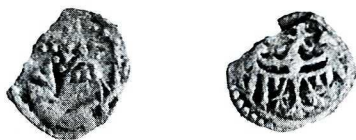
Ryc. 6. Bytom, inw. pol. B/263/98. Halerz legnicki. Skala ok. 1,5:1.

2. Śląsk, ks. legnickie , władca?, halers, men. Legnica, XV w., Fbg 177; brak ok. 1/4 monety, krążek nieregularny, 0,221 g, 11,3 mm (ryc. 6). Lokalizacja jw., 4,30 od N i 8,15 od W, poz. niw. 275,69. Znaleziony 19 X 1998 r. Inw. połowy B/263/98.