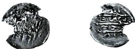
Ryc. 4. Wandynowo, grób 18. Denar Bolesława Kędzierzawego. Skala ok. 1.5:1.

3. Polska , Bolesław IV Kędzierzawy (1146–1173), denar; Av. władca trzyma w lewicy palmę, obok pierścienia; Str. 55, Such. 3; krążek b. cienki, w dwóch fragmentach, dość duże ubytki, wytarty nierównomiernie (zwłaszcza Rv. bity mocno zużyтым i splekanym stemplem), nieczytelne znaki mennicze; 0,187 g, 14,4 mm (ryc. 4). Ar IV, grób 18 (kobieta, 50–60 lat), razem z nożem żelaznym na prawej kości miednicy (pierwotnie zapewne na wysokości pasa, być może w organicznej pochewce?), w składzie wyposażenia ponadto 4 srebrne kabłączki skroniowe i 3 ułamki ceramiki naczyniowej. Inw. połowy W/70/98.