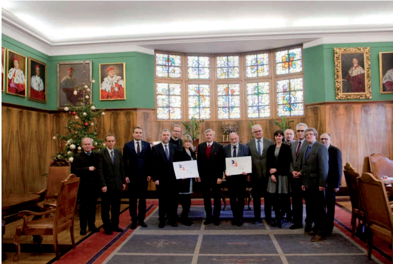
Inauguracyjne posiedzenie Komitetu Organizacyjnego w Collegium Minus UAM, Poznań 22.01.2016 roku.

w którym znajduje się zabytkowa Aula Uniwersytecka na 900 osób, Aula Lubrańskiego i Sala Senatu, gdzie planowane są sesje plenarne. Nieopodal wznoszą się budynki Collegium Maius, Biblioteki Uniwersyteckiej, Collegium Iuridicum Novum i Collegium Novum.