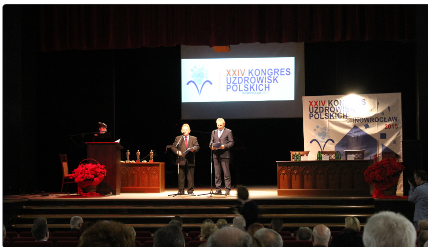
Inauguracja XXIV Kongresu Uzdrawisk Polskich w Inowrocławiu