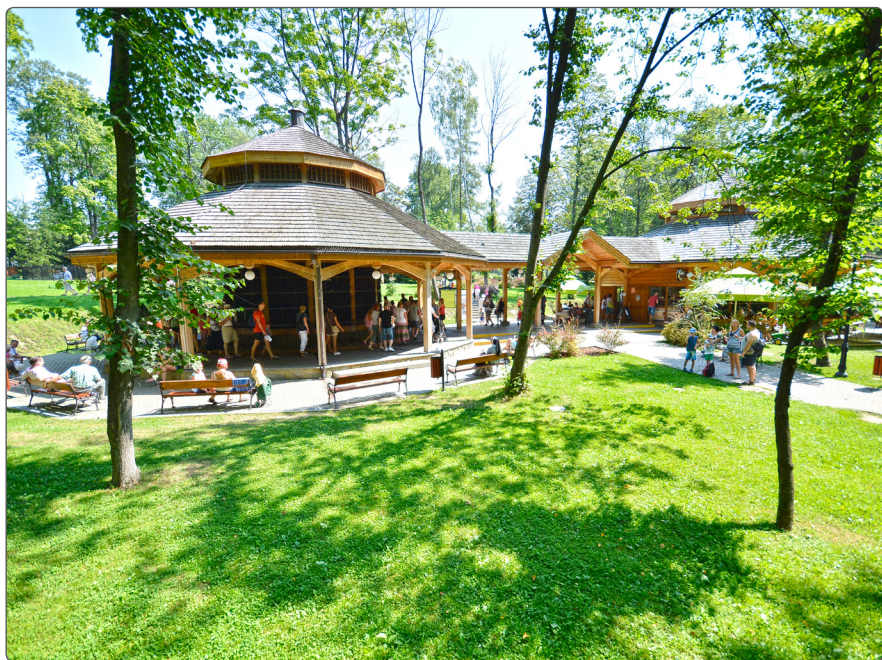
Tężnia Solankowa i Pijalnia Wód Mineralnych