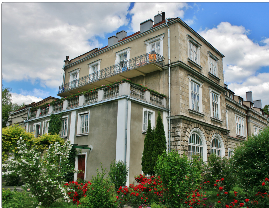
Sanatorium uzdrowskowe Bajka w Horyńcu-Zdroju.

Horyniec-Zdrój odwiedza tysiące turystów i kuracjuszy. Przyciągają ich doskonale warunki klimatyczne, rozległe tereny leśne, interesujące zabytki. Uzdrowisko oferuje wspaniałe warunki