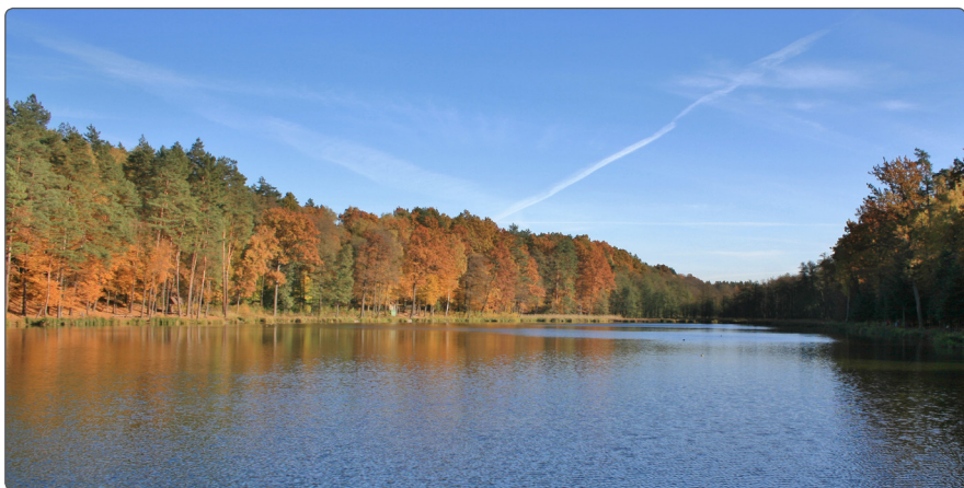
Łowisko rybne

50-tych postanowiono odbudować zrujnowany zakład zdrojowy. W 1976 roku Horyniec otrzymał status uzdrowiska, a od 1988 roku funkcjonuje nazwa Horyniec-Zdrój.