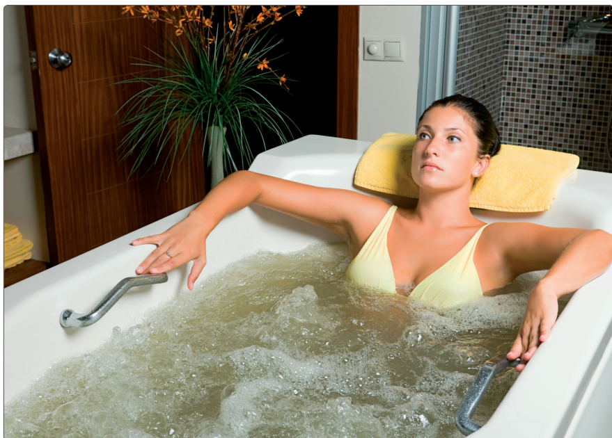
Zabiegi - kąpiel