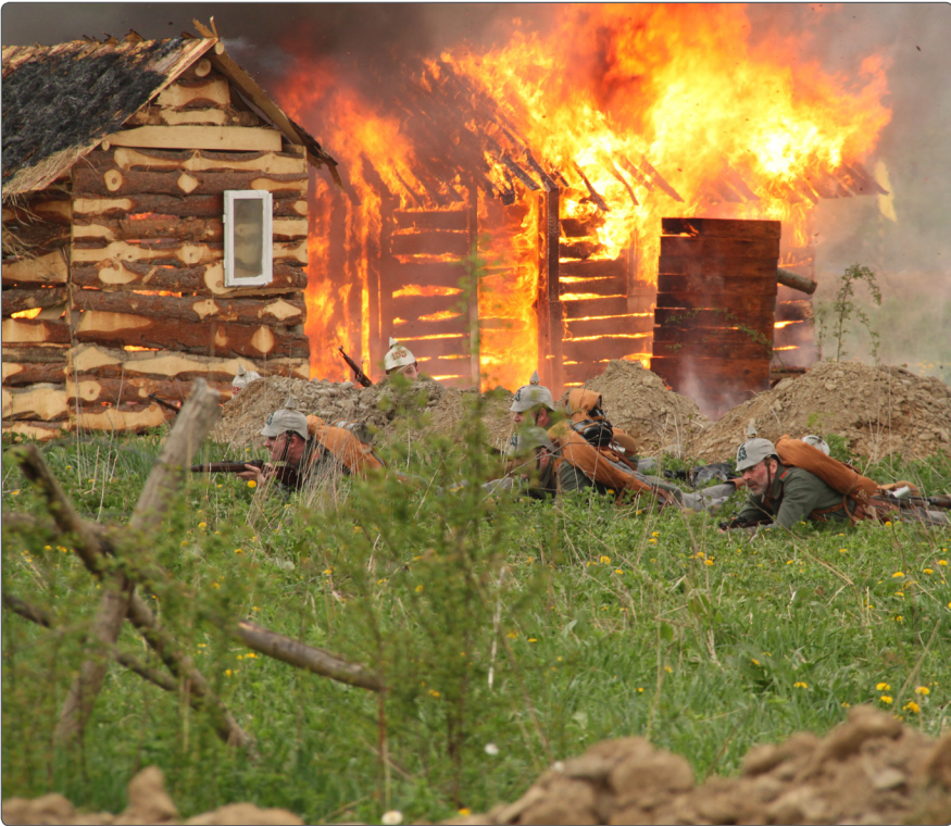
Bitwa pod Gorlicami aut. J. Pięta

wody siarczkowe. Głównym wskazaniem do stosowania kąpeli w wodach siarczkowych są: choroby układu ruchu o charakterze zwyrodnieniowym, przewlekłe choroby zapalne - zeszywniające zapalenie stawów kręgosłupa, reumatoidalne zapalenie stawów o mniejszej aktywności, niektóre choroby skóry, wybrane choroby układu nerwowego i zespoły bólowe oraz zaburzenia krążenia obwodowego o charakterze miażdżycowym. W Wapienem można poddać się zabiegom z wykorzystaniem eksploatowanej na miejscu borowiny, stosowanej w leczeniu chorób narządów ruchu i chorób kobiecych.