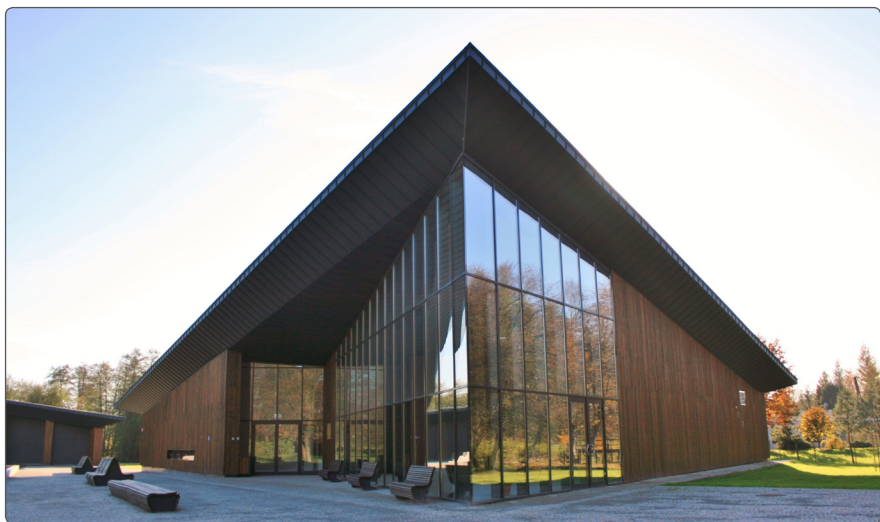
Pijalnia wód w Parku Zdrojowym.

rzą trzy sanatoria: Centrum Rehabilitacji Rolników KRUS, „Uzdrowisko Horyniec” oraz „Bajka”. Specjalizują się głównie w leczeniu chorób narządu ruchu i schorzeń reumatycznych oraz chorób skóry, przemiany materii, dróg oddechowych i chorób kobiecych. Uzdrowisko jako jedno z niewielu posiada dwa