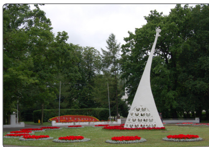
Zegar słoneczny w kształcie pawia w wejściu do Parku Solankowego

Inowrocław to jedno z najstarszych polskich miast, które poszczycić się może faktem, iż jest kolebką rodu Piastowiczów, a na jego przedmieściach położone było handlowe emporium Askaukalis, o którym w starożytności pisał Ptolemeusz. Tędy wiódł szlak bursztynowy prowadzący z południa i zachodu Europy nad Bałtyk. Inowrocław, ze względu na usytuowanie na podziemnych pokładach solnych, zwany był „miastem na soli”, a w II w. n.e. właśnie tu zbudowano pierwsze w Europie