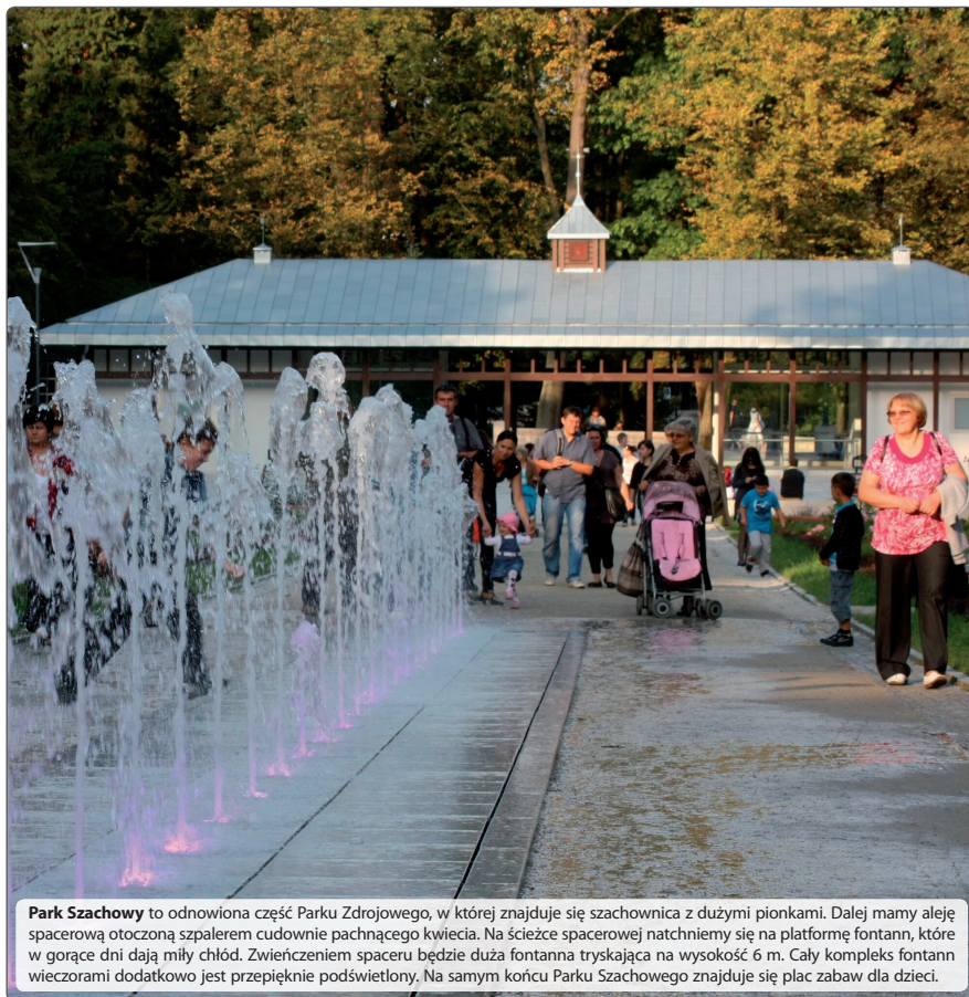
Park Szachowice to odnowiona część Parku Zdrojowego, w której znajduje się szachownica z dużymi pionkami. Dalej mamy aleję spacerową otoczoną szpalerem cudownie pachnącego kwiecia. Na ścieżce spacerowej natchniemy się na platformę fontann, które w gorące dni dają miły chłód. Zwieńczeniem spaceru będzie duża fontanna tryskająca na wysokość 6 m. Cały kompleks fontann wieczorami dodatkowo jest przepięknie podświetlony. Na samym końcu Parku Szachowice znajduje się plac zabaw dla dzieci.