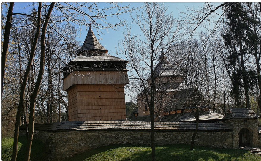
Zespół cerkiewno obronny w Radrużu

ki leczenia i wypoczynku, jak również szczególną atmosferę i gościnność mieszkańców. Specyficzny mikroklimat sprawia, że dobrze czują się tutaj osoby cierpiące na choroby układu krążenia, chorobę wieńcową i nadciśnienie. Rozległe lasy tworzą doskonale warunki do zdrowotnych i rekreacyjnych spacerów i wycieczek rowerowych.