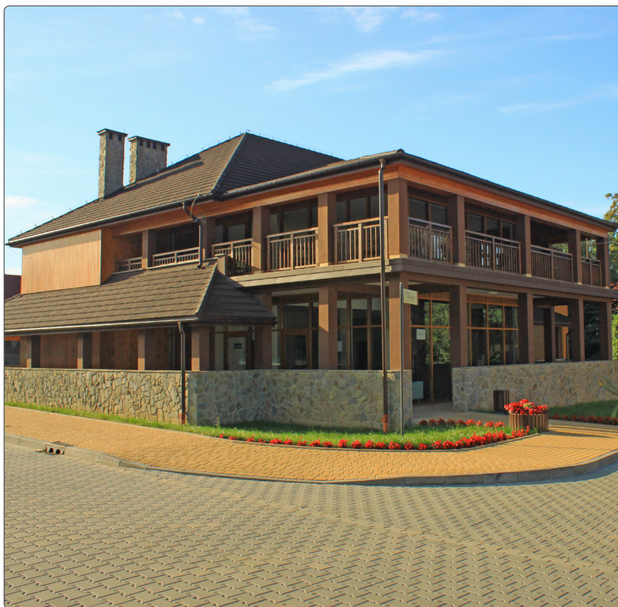
Dom zdrojowy aut. K. Matusik

eu) z trasą zjazdową o długości 1400 m oraz nartostrada o długości ok. 3 km. Na nartach można również zjeżdżać po łagodniejszych stokach w Małastowie i Sękowej.