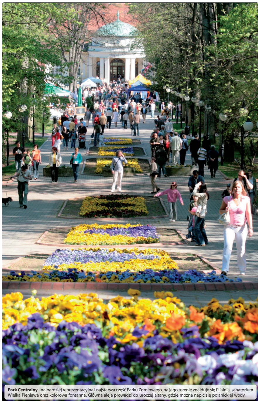
Park Centralny - najbardziej reprezentacyjna i najstarsza część Parku Zdrojowego, na jego terenie znajduje się Pijalnia, sanatorium Wielka Pieniawa oraz kolorowa fontanna. Główna aleja prowadzi do uroczej altany, gdzie można napić się polanickiej wody.