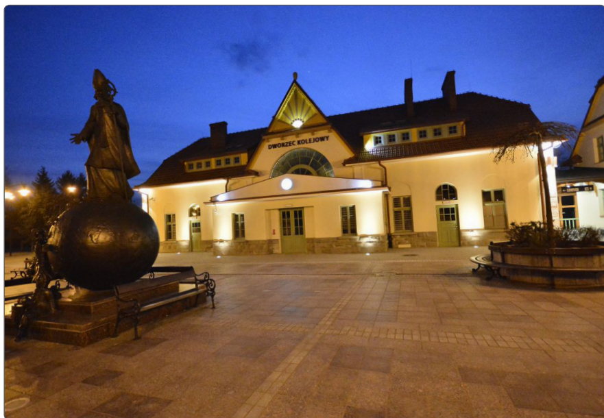
Zabytkowy budynek dworca PKP, siedziba Biblioteki Miejskiej

stwa na szkłe. Warto odwiedzić także przepiękny drewniany kościół, gdzie mieści się obecnie Muzeum im. Władysława Orkana, z bogatą ekspozycją etnograficzną.