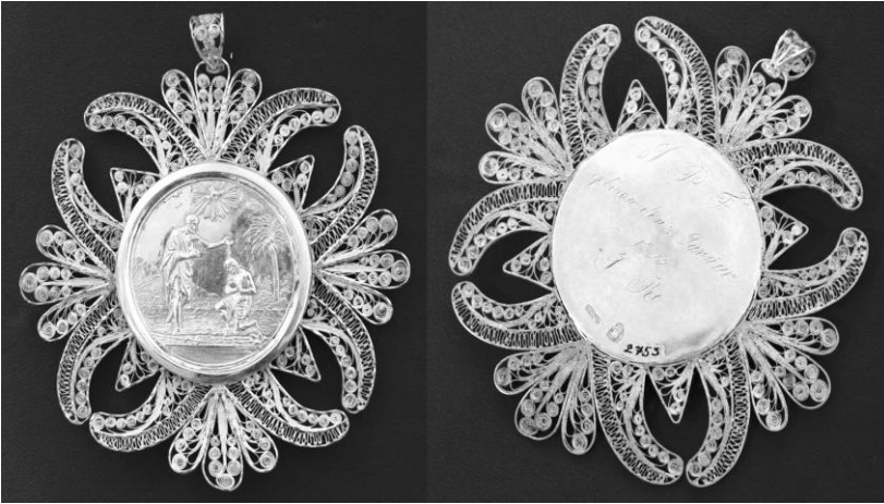
3. Strieborný krstný medailón (1833).