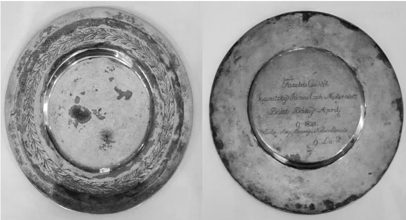
1. Strieborná paténa (1841).