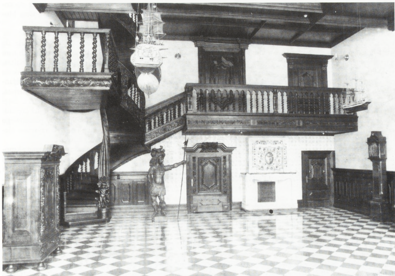
2. To samo wnętrze po adaptacji w 1996 r.