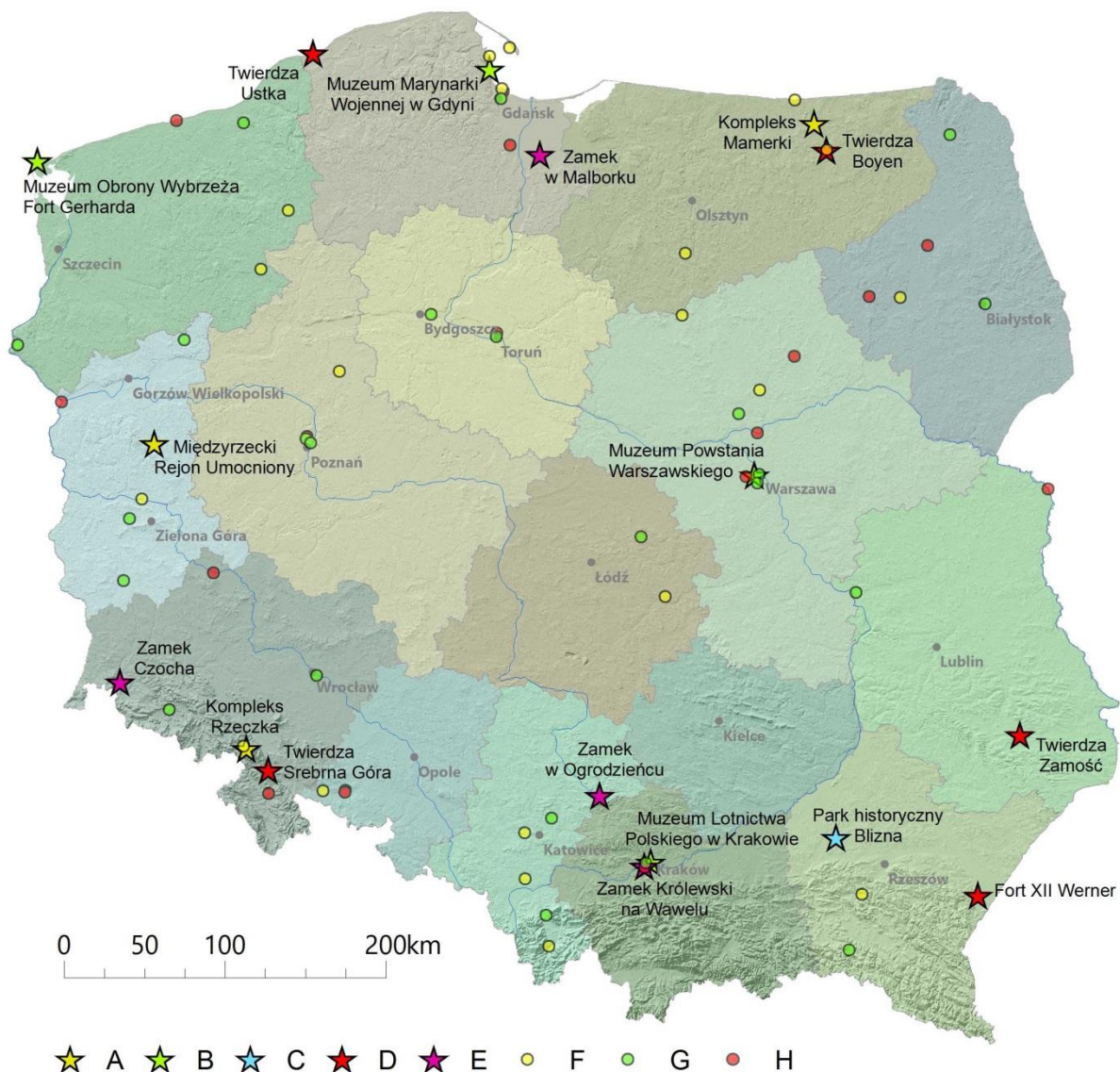
Ryc. 1. Położenie badanych obiektów na tle atrakcji turystyki militarnej.

Obiekty opisywane w pracy: A – nowożytnie fortyfikacje, B – muzea, C – parki historyczne, D – twierdze, E – zamki. Pozostałe atrakcje militarne: F – nowożytnie fortyfikacje, G – muzea, H – twierdze.