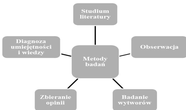
Rysunek 2. Klasyfikacja metod badawczych pedagogicznych według Tadeusza W. Nowackiego

Na gruncie pedagogiki pracy na uwagę zasługuje klasyfikacja Tadeusza W. Nowackiego, ponieważ zaproponowana typologia uwzględnia swoistość pedagogiki pracy.