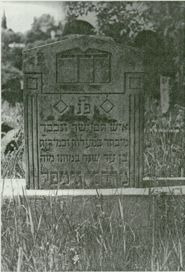
6. Macewa o zwieńczeniu trójkątnym posiada cechy secesji 6. A maiseva with a triangular crowning showing Sezession features

tutaj kilka lokalnych towarzystw samopomocy, organizacji i partii politycznych, najczęściej z Sosnowca i Będzina 20 .