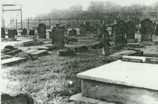
1. Jednolitą strukturę cmentarza narusza współczesny grobowiec płytowo-stelowy. W głębi widoczne żelazne ogrodzenie cmentarza. Stan z grudnia 1993 r.

Ostatnie lata dokonały głębokich przemian w życiu publicznym kraju. Umożliwiły one realizację inicjatyw lokalnych społeczności i odnowę zabytkowych obiektów minionych epok. Wiele z tych prac zbiegło się w czasie z okrągłymi rocznicami. Działania takie podjęto także w makroregionie górnośląskim. Latem 1993 r., w przededniu 50. rocznicy likwidacji getta w Sosnowcu, zrekonstruowany został cmentarz żydowski w Modrzejowie, południowej dzielnicy miasta. Jest to już druga z kolei rewaloryzacja nekropoli moza-