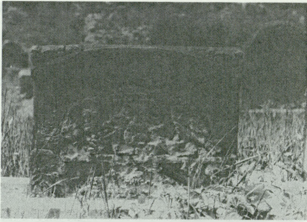
4. Nie zawsze udawało się uratować cały nagrobek z kruchego piaskowca. Widoczna zwiertzelina powstała pod wpływem czynników atmosferycznych.

4. Not always was it possible to save a whole monument made of fragile sandstone. The eroded fragment is the result of the impact of atmospheric factors.