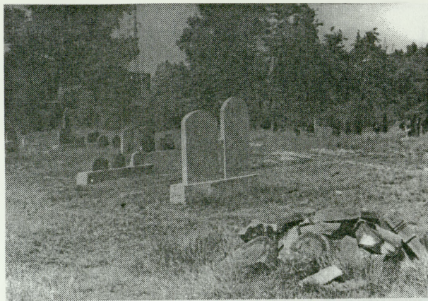
7. Wolne przestrzenie po ubytkach tkanki wewnętrznej w południowej części cmentarza wypełniły nowe elementy: na pierwszym planie — detale uszkodzonych nagrobków do przyszłego lapidarium, pośrodku — cenotaf jeszcze bez inskrypcji. Stan z czerwca 1993 r.

Niemal wszystkie pomniki posiadają elementy symboliczne. Symbolika ta mieści się w typowych kategoriach ogólnozydowskich przedstawień monoteistycznych i zespołowych. Obejmuje ona elementy kultu religijnego i liturgicznego, elementy o charakterze świeckim, zoomorficzne i roślinne oraz dekoracyjno-zdobnicze. Są to zatem świeczniki jedno- i trójramienne, dzbany z wylewającą się wodą, korony, księgi i szafy z księgami (biblioteki), lwy, jelenie i ptaki oraz drzewa i liście, nierzadko w otoczeniu bogatej ornamentyki geometryczno-dekoracyjnej. Na współczesnym grobowcu płytowo-stalowym pojawia się naturalnie malutka Gwiazda Dawida (zwana też Tarczą). Z rzadko stosowanych wyobrażeń występuje pojedynczo ryba 28 oraz... koń! Ostatnie przedstawienie praktycznie nie znajduje odpowiednika w scenach i wyobrażeniach judaistycznych i nie jest też wymieniane w Starym Testamencie. Należy je więc uznać za barbaryzację warstwy symbolicznej pod wpływem lokalnej sztuki ludowej diaspory. Wizerunki te są może przypomnieniem zajęć osób zmarłych: koń symbolizować może pasterstwo, wozactwo