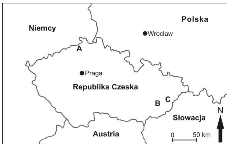
Ryc. 1. Położenie rezydencji analizowanych w pracy: A – zamek Děčín, B – pałac Holešov, C – pałac Lešna koło Valašského Meziříčí

zarówno w trzech analizowanych obiektach, jak i ogólnie w udostępnionych do zwiedzania zabytkach architektury w Republice Czeskiej, ze szczególnym uwzględnieniem zamków i pałaców.