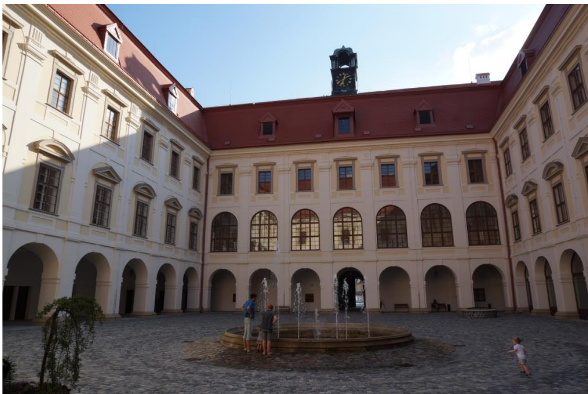
Ryc. 8. Dziedziniec pałacu w Holešovie po zakończonej rewitalizacji – z nową nawierzchnią, sprawną fontanną i odrestaurowanymi elewacjami

piętrze, w których planuje się pełne przywrócenie dawnego wyglądu (np. kaplica), oraz elewacje zewnętrzne.