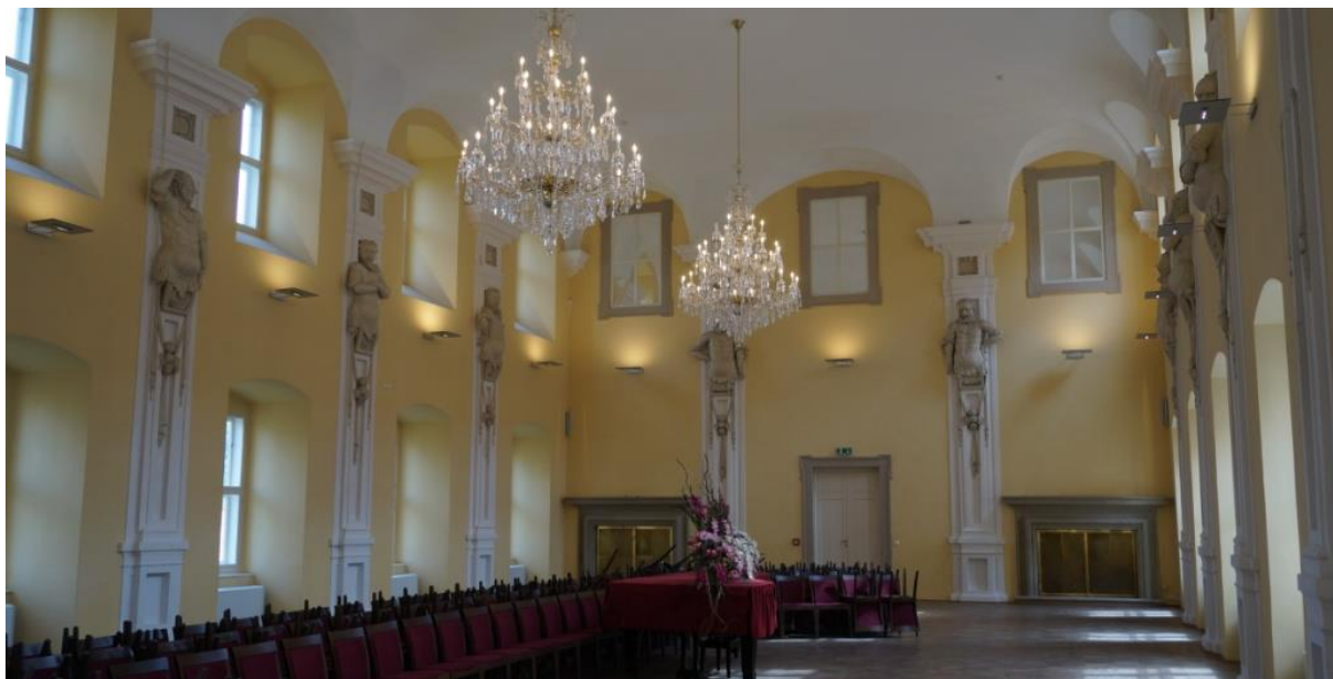
Ryc. 10. Wielka Sala zajmująca całą szerokość i dwie kondygnacje północno-zachodniego skrzydła pałacu w Holešovie

w skrzydle południowo-wschodnim zachowała się także kaplica z resztkami malowideł i stare kafelki w niektórych pomieszczeniach (np. przy dawnych toaletkach).