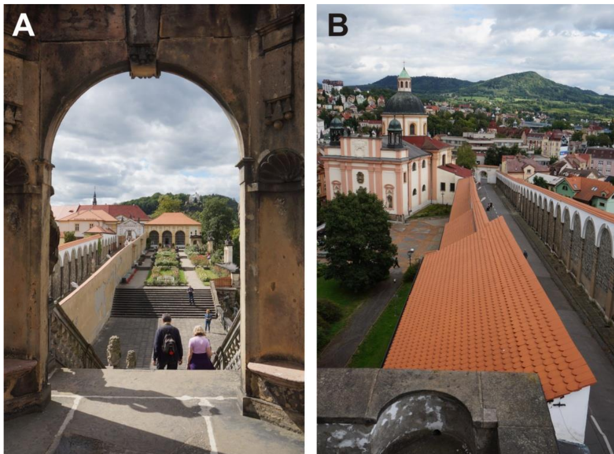
Ryc. 6. Widoki z gloriety w Ogrodzie Różanym: A. w kierunku zachodnim na kolejne poziomy Ogrodu Różanego, salę terrena , Bramę Górną kończącą reprezentacyjny podjazd do zamku, czyli tzw. Dlouhą jízdu , część zabudowań administracyjnych oraz wschodnie skrzydło zamku (w tle restauracja z wieżą widokową na Pasterskiej Ścianie), B. w kierunku wschodnim na Dlouhą jízdu z Bramą Dolną i kościół pw. Podwyższenia Krzyża Świętego, do którego wiedzie zadaszone przejście z gloriety