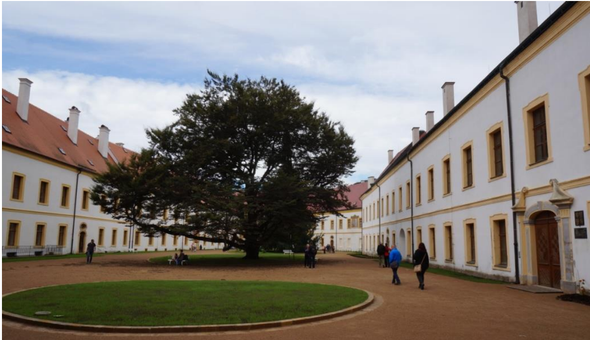
Ryc. 4. Wewnętrzny dziedziniec zamku w Děčínie w końcowej fazie rewitalizacji

[ www.zamekdecin.cz/web_cz/?p=clanky/novy-klenot-zamku&obr=1 , 6.11.2015]. Rewitalizowane jest także otoczenie niedawno odremontowanego spichlerza dworskiego (ryc. 5), przez które przechodzi się do południowej części parku ze stawem ( Zámecký rybník ). Wprowadzone zostanie tu dużo zieleni, a na tarasie powyżej spichlerza powstanie ozdobna winnica, co nawiązuje do historycznych zdjęć z początku XX w. (winnice istnieją już na wyższych tarasach, bliżej reprezentacyjnego podjazdu na wzgórze zamkowe).