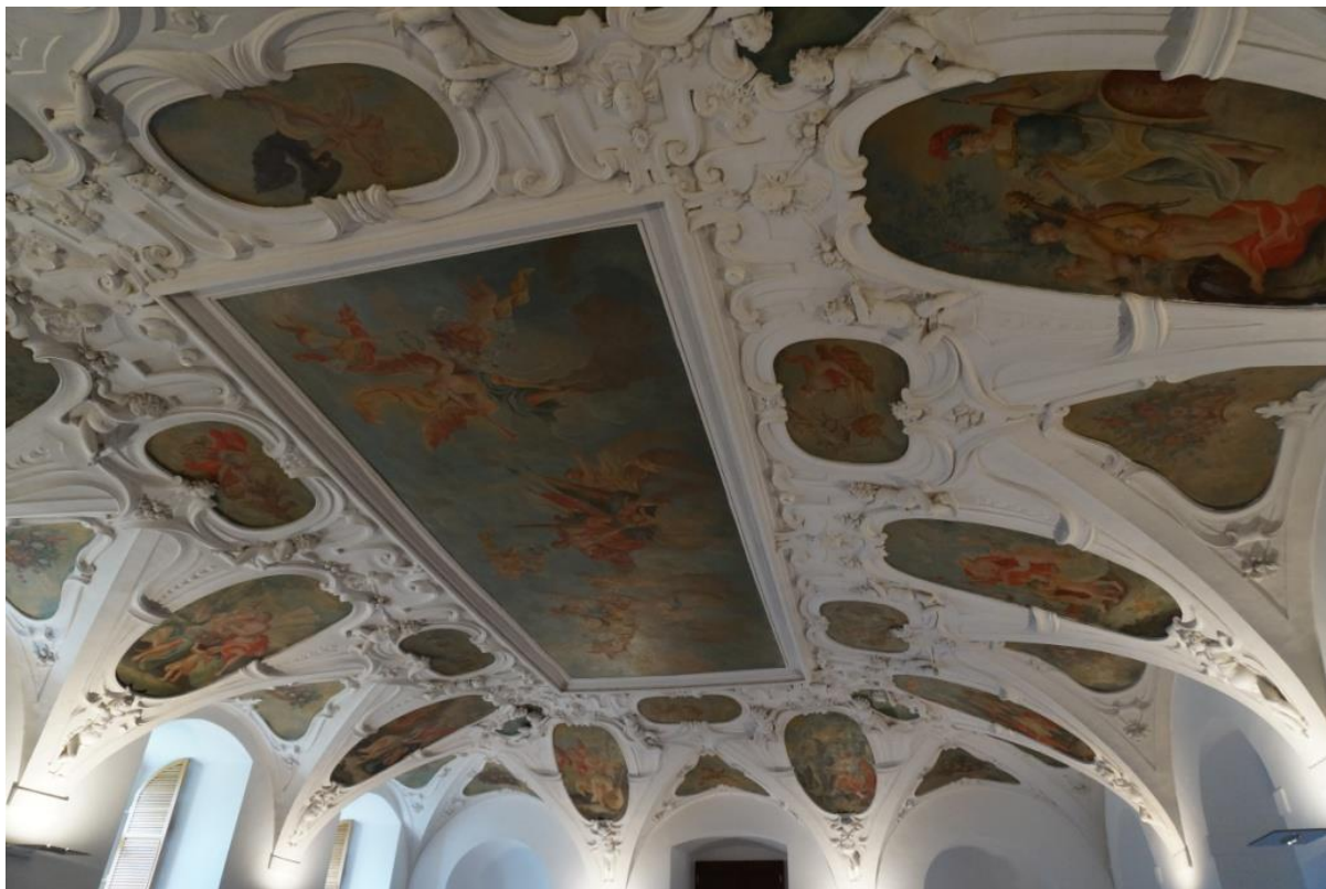
Ryc. 9. Sztukaterie i malowidła o tematyce mitologicznej na sklepieniu sali terrena w holešovskim pałacu

zachowanej formy architektonicznej, oryginalną dyspozycję oraz częściowo przetrwały wystrój wnętrz zaliczany jest do najważniejszych reprezentantów wczesnobarokowej architektury rezydencjonalnej w Republice Czeskiej. Otaczający go park uznawany jest z kolei za jeden z najlepszych na Morawach przykładów zapożyczenia zasad tworzenia formalnych ogrodów w stylu francuskim [ www.zamekholesov.cz/o-zamku/historie , 6.11.2015], co powoduje, że całe założenie określane jest czasem mianem hanáckiego Wersalu (czes. Hanácké Versailles ) [Otruba, Ptáček, Švorc 2007, s. 45].