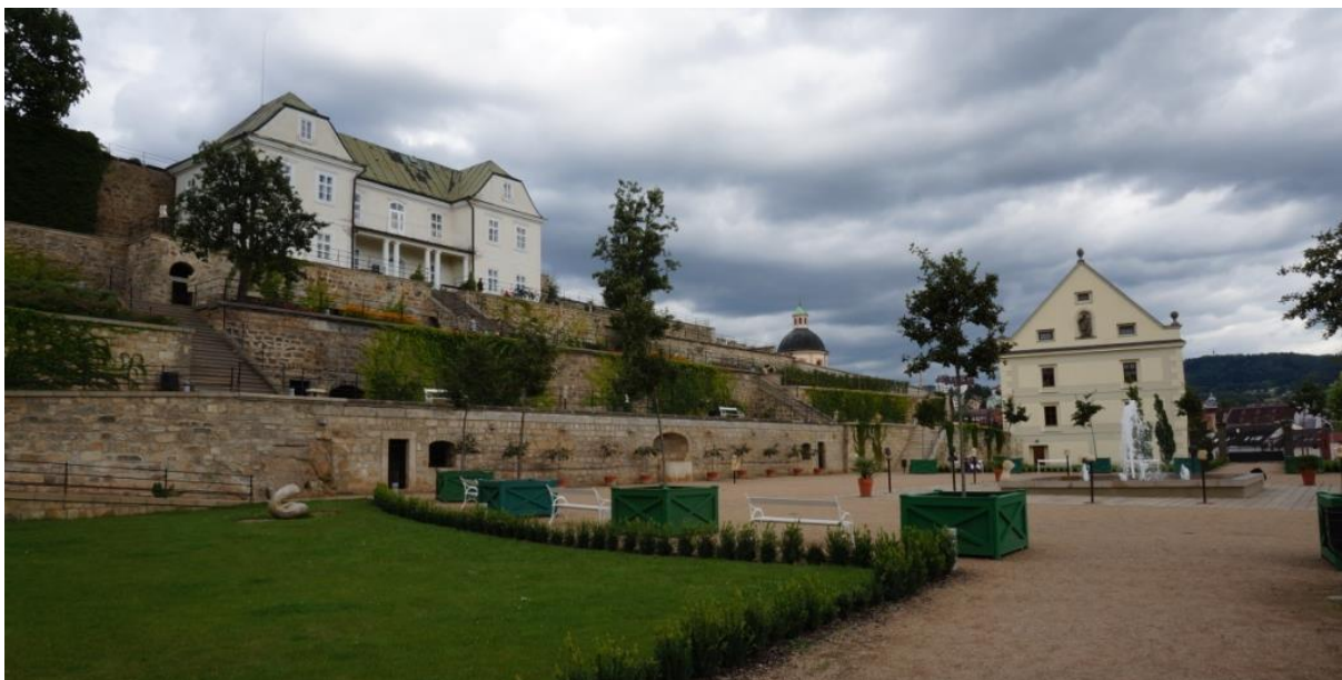
Ryc. 5. Ogólny widok tarasowych ogrodów po południowej stronie wzgórza zamkowego w Děčínie. Po lewej znajduje się dom ogrodnika, pośrodku – kopuła kościoła pw. Podwyższenia Krzyża Świętego, zaś po prawej – niedawno odremontowany spichlerz dworski