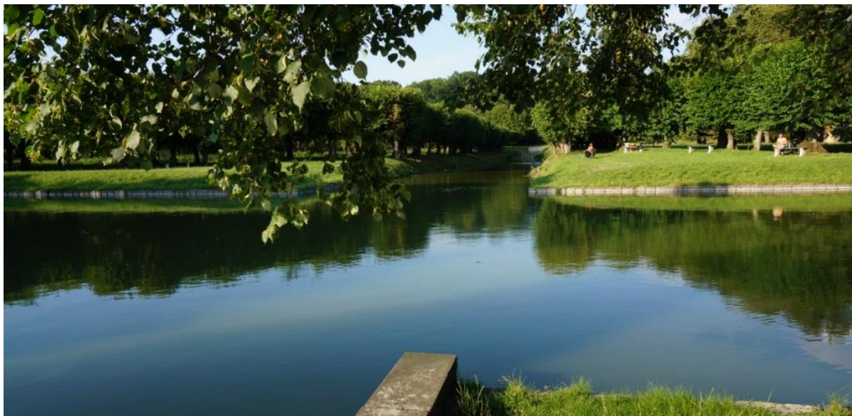
Ryc. 12. Skrzyżowanie głównego kanału z jego ramionami w środkowej części ogrodu pałacowego w Holešovie