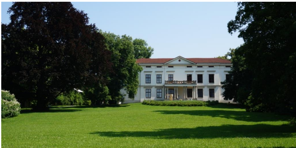
Ryc. 13. Widok pałacu w Lešnej z południowego zachodu, z terenu parku w stylu angielskim

z wykorzystaniem oryginalnego wyposażenia, resztę zaś zrekonstruowano (ryc. 14) [Turistický průvodce... 2013, s. 32]. Stanowią ilustrację życia w wiejskiej siedzibie szlacheckiej tamtych czasów. Z oryginalnych elementów zachowały się fragmenty malowideł na stropach i unikalne barokowe podłogi, szczególnie w Białej Sali, zajmującej południowy narożnik pierwszego piętra. Pomieszczenie to zdobią też renesansowe freski na ścianach, które zostały odsłonięte spod późniejszych warstw tynku i zakonserwowane, ale jeszcze nie odrestaurowane. Zwraca uwagę biblioteka na zachodnim rogu pałacu, wyposażona w dębowe regały odtworzone na podstawie fotografii, biurko i sekretarzyk, z kilkoma pamiątkami po przedwojennych właścicielach rezydencji. O atmosferze pałacu decydują właśnie drobne eksponaty muzealne powodujące, że odwiedzający ma wrażenie, jakoby budynek był cały czas zamieszkały.