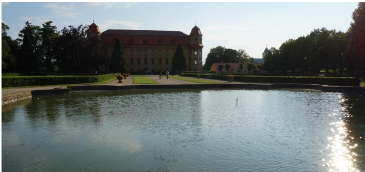
Ryc. 11. Basen stanowiący zakończenie głównego kanału w holešovskim ogrodzie francuskim przed północno-wschodnią fasadą pałacu

kontrastującą z zielenią. Po przeciwnej stronie główną oś założenia – odpowiadającą środkowemu kanałowi – zamyka dominanta góry Hostýn (734 m n.p.m.) z potężnym, barokowym kościołem pielgrzymkowym pw. Wniebowzięcia NMP na szczycie.