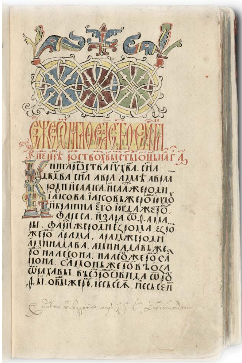
Il. 6. Początek Ewangelii wg św. Mateusza, BK 896, k. 16