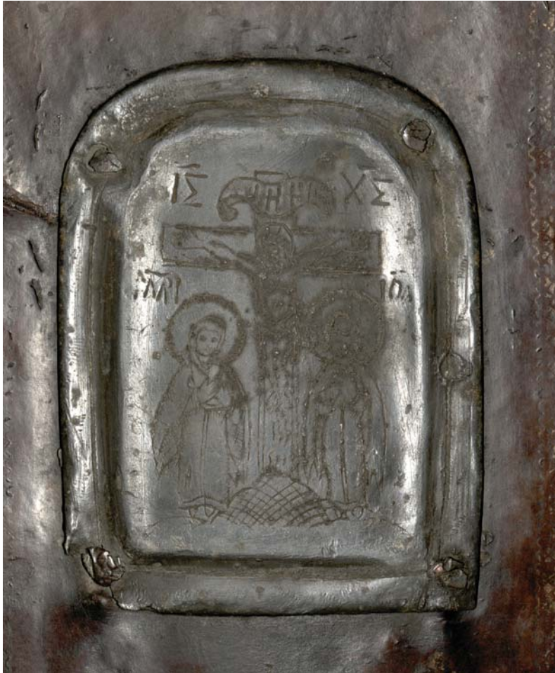
Il. 1. Fragment oprawy ewangeliarza, BK 11985