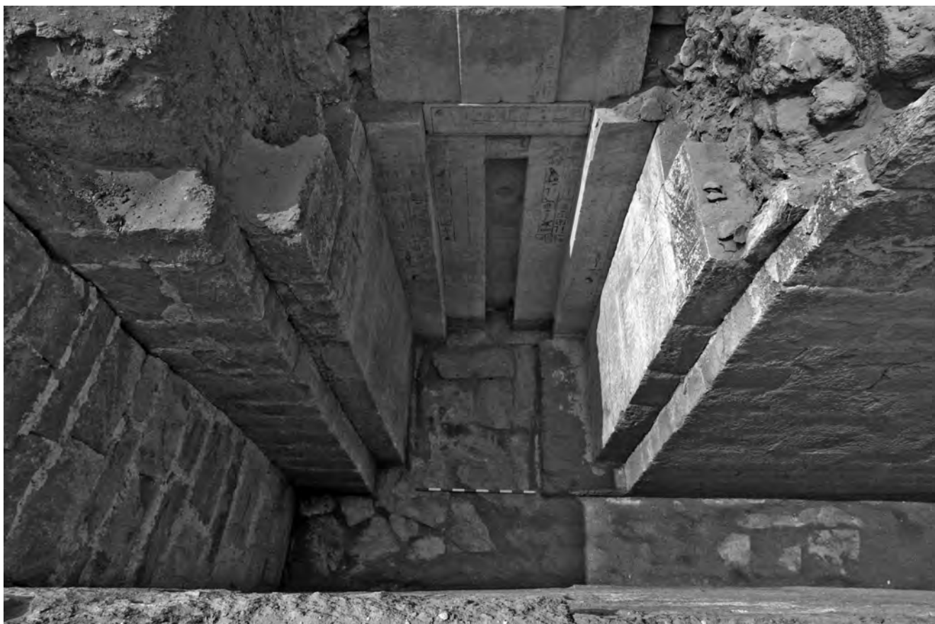
Obr. 6 Šepeskafanchova kaple, pohled shora

místností bylo uchovat sochy zesnulého majitele či majitelů hrobky a tím i jejich – byť idealizovanou – podobu i po smrti. To byl jeden z několika základních předpokladů nerušené a zajištěné posmrtné existence starých Egypťanů.