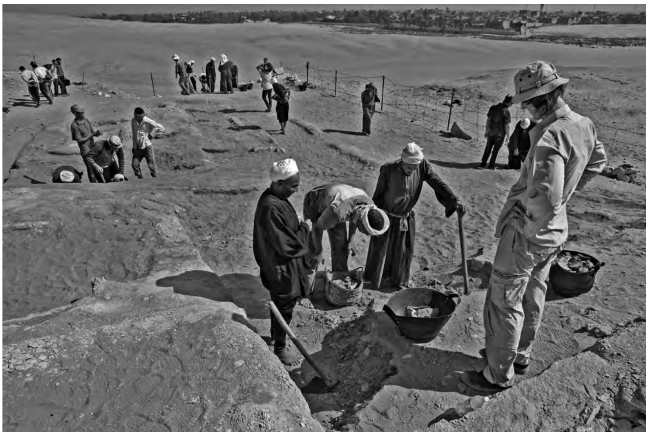
Obr. 2 Začátek výzkumu, kdy jsme ještě netušili, že nás čeká jeden z nejvýznamnějších světových archeologických objevů roku 2013

severní stěně hrobky jsme mohli zdokumentovat několik červeně vyvedených, malovaných hieratických nápisů z doby vzniku stavby, uvádějících jméno majitele, které znělo Šepseskafanch.