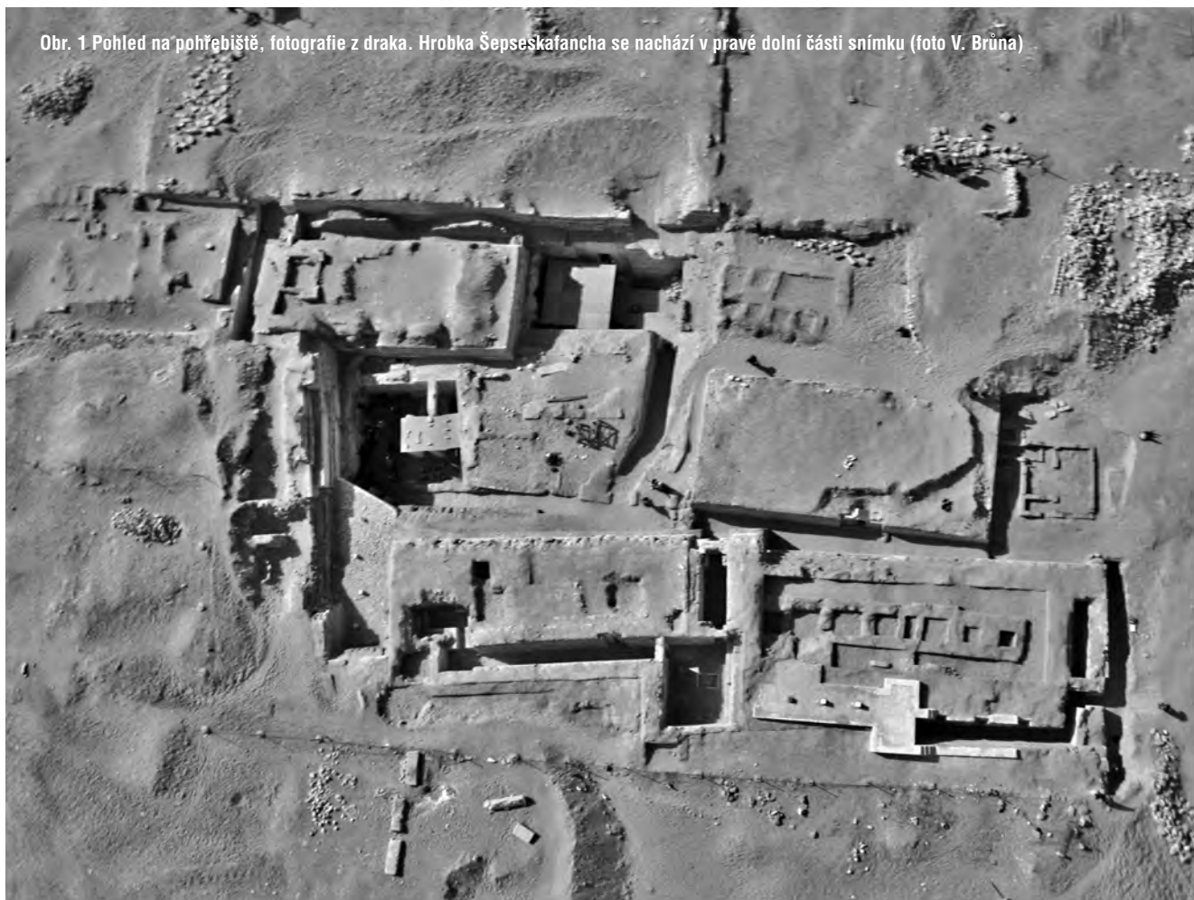
Obr. 1 Pohled na pohřebiště, fotografie z draka. Hrobka Šepeskafancha se nachází v pravé dolní části snímku