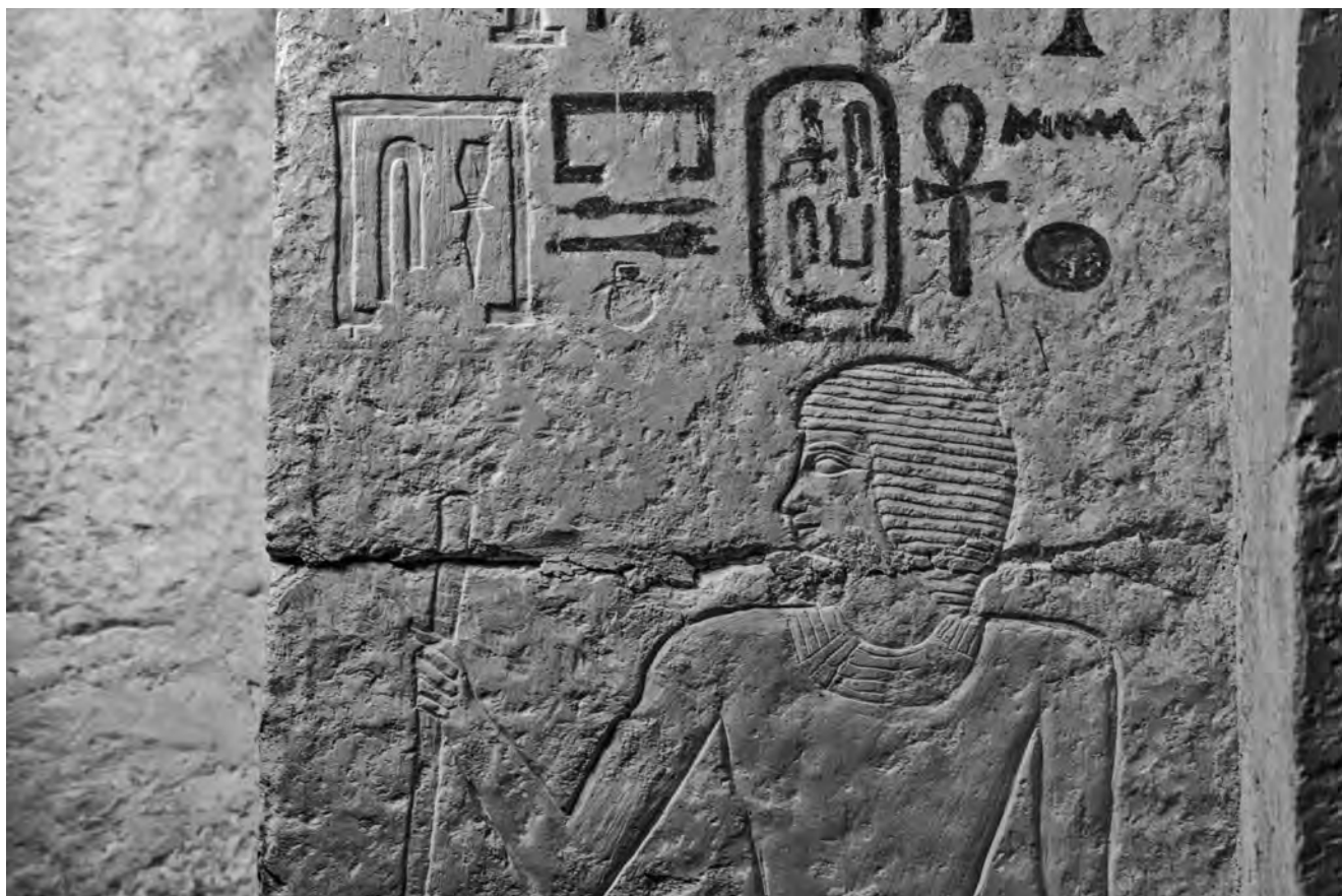
Obr. 9 Detail nepravých dveří zachycující rozdílné fáze výroby této kamenné stély

Zatímco nadzemní část hrobky již nyní (zpracování a vyhodnocování získaných pramenů stále není dokončeno)