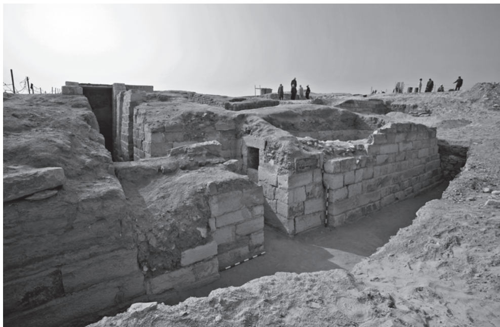
Obr. 3 Průčelí Šepseskafanchovy hrobky, pohled od severovýchodu

Nadzemní část hrobky byla postavena – s ohledem na rozšířenou praxi v této době – poměrně zajímavým a ne-