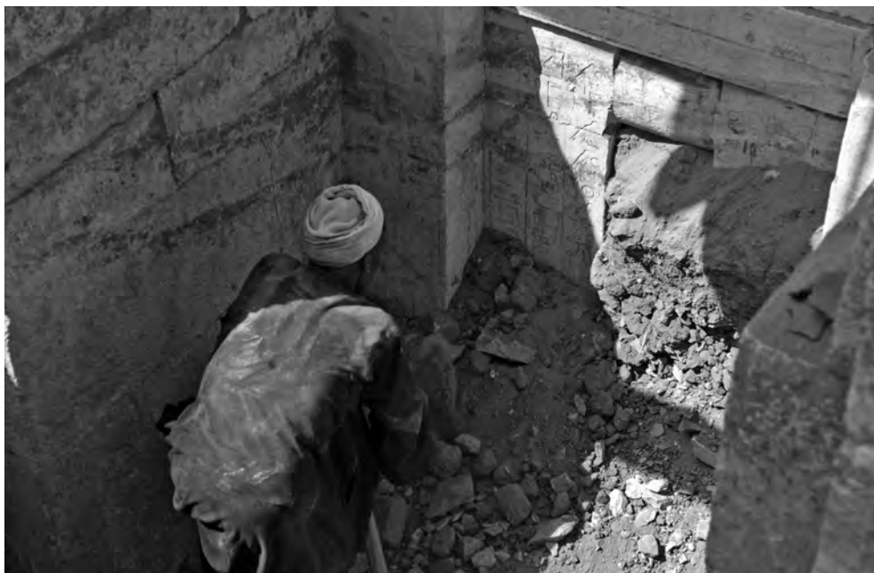
Obr. 5 Sajjid, jeden z našich nejlepších dělníků, během pečlivého odkrývání Šepesekafančovy kaple

Hned za vchodem byl po pravé straně umístěn vysoko nad hliněnou podlahou chodby malý průzor ve zdi, který spojuje vstupní část s velkou protáhlou místností zvanou serdáb. Ta byla bezmála 5 m dlouhá a 1 m široká a dochovala se do výšky 2 m. Právě v této výšce zřejmě začínala hliněná klenba, což dokazuje její náběh objevený na jižní stěně. Klenba jako taková však do dnešních dnů nepřežila. Hlavním a jediným smyslem těchto specifických zazděných