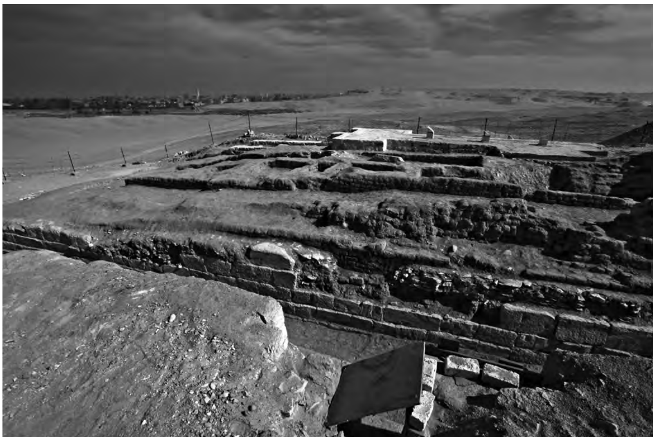
Obr. 4 Pohled na Šepesekafančovu hrobku od západu. Zcela jasně je vidět kamenný plášť hrobky i cihlový věnec chránící ústí jednotlivých šachet

obvyklým způsobem (obr. 4). Její vnější část tvořilo zdivo z vápencových bloků, zatímco jádro bylo postaveno z nepálených černých cihel. V něm byla umístěna ústí šachet vedoucích do pohřebních komor jednotlivých členů Šepesekafančovovy rodiny. Prostor mezi jádrem a vnějšími zdmi stavby byl vyplněn odpadním stavebním materiálem. Tímto způsobem stavitel výrazně urychlil postup prací a zároveň uspořil ne nevýznamné prostředky.