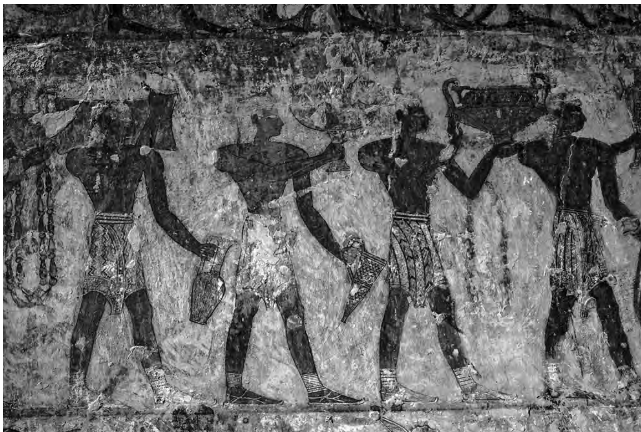
Obr. 4 Zobrazení nosičů tributu, Rehmireova hrobka

vztazích mezi egejskou oblastí a Egyptem se setkáváme i v ikonografických pramenech. Jedním z nich je fenomén egejských stropů, tedy skutečnost, že se v hrobkách datovaných do období vlády Thutmose III. objevují stropy, o nichž se soudí, že byly inspirovány egejským textilem. Význam má také zobrazení nosičů darů či tributu z egejské oblasti (viz tab. 2). Zde je patrné, že i když se objevují v delším časovém úseku, pouze v období vlády Thutmose III. se jedná o ikonografické zpodobnění podle skutečnosti (obr. 4). Později mluvíme o takzvané hybridizaci.