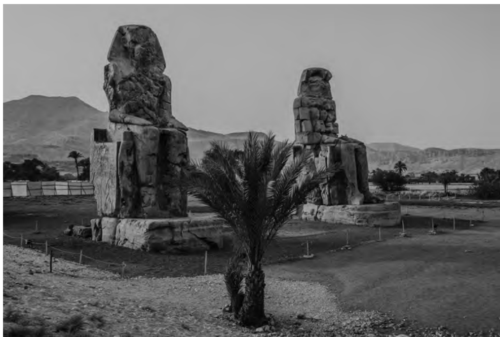
Obr. 2 Memnonovy kolosy (foto M. Frouz)

staršího seznamu, který se nedochoval. Nakonec ji však ponechal otevřenou.