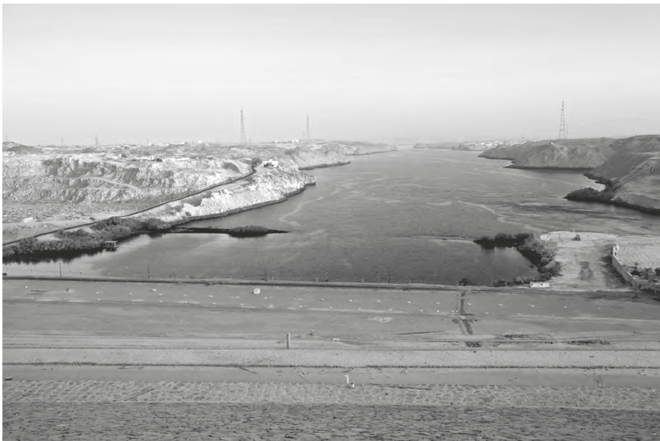
Obr. 1 Pohled na nilský tok z Vysoké přehrady u Asuánu