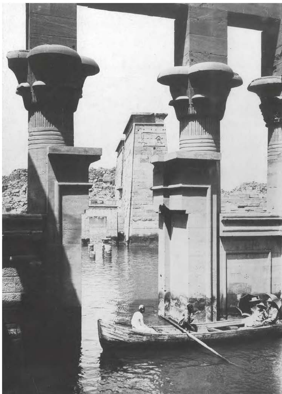
Obr. 6 Chrám z ostrova Filé v době stavby přehrady a plnění Násirova jezera

Kromě těchto důsledků musely egyptská a súdánská vláda čelit také velké odpovědnosti vůči světovému historickému dědictví, neboť zaplavením tak velkého území plánovanou přehradní nádrží byly ohroženy všechny tamější historicky cenné doklady. Jejich záchrana vyžadovala