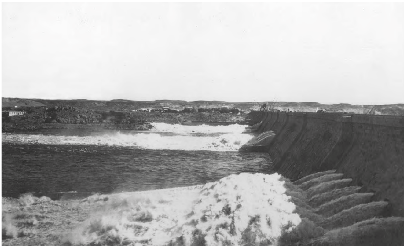
Obr. 4 Asuánská přehrada nabízela jen dočasné řešení