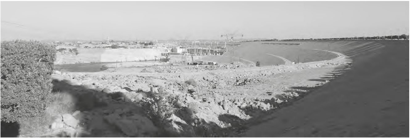
Obr. 5 Vysoká přehrada v Asuánu