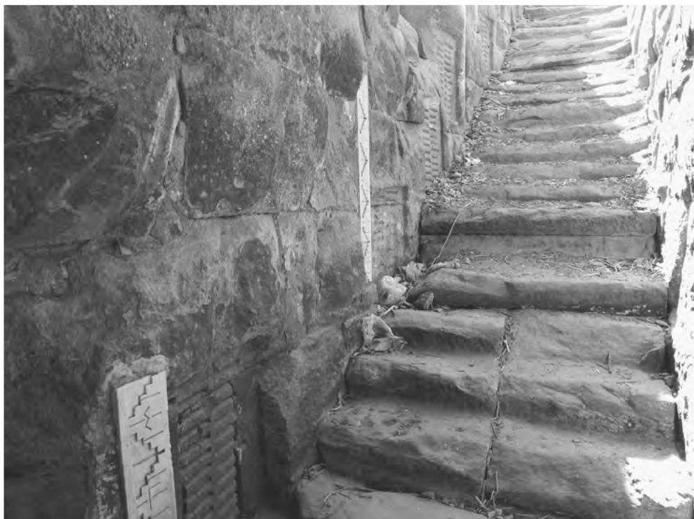
Obr. 2 Nilometr sloužící k měření výše každoroční nilské záplavy na ostrově Elefantína v Asuánu

státní správě na základě naměřené výše záplavy včas reagovat a neštěstí do určité míry předcházet.