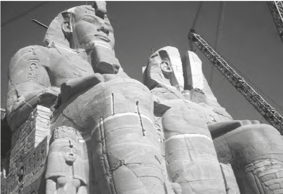
Obr. 7 Přesouvání chrámu Ramesse II. v Abú Simbelu

ohromné vědecké, technické i finanční nasazení, které bylo za hranicemi možností obou zemí. Proto oslovily organizaci UNESCO, jež jejich výzvu roku 1959 vyslyšela.