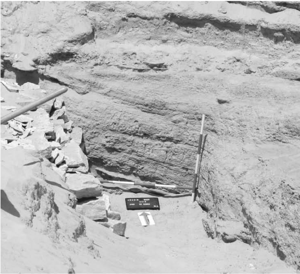
Obr. 3 Severovýchodní roh hlavní šachty AW 6, pohled od jihu / Fig. 3 The northeastern corner of the main shaft of structure AW 6, seen from the south