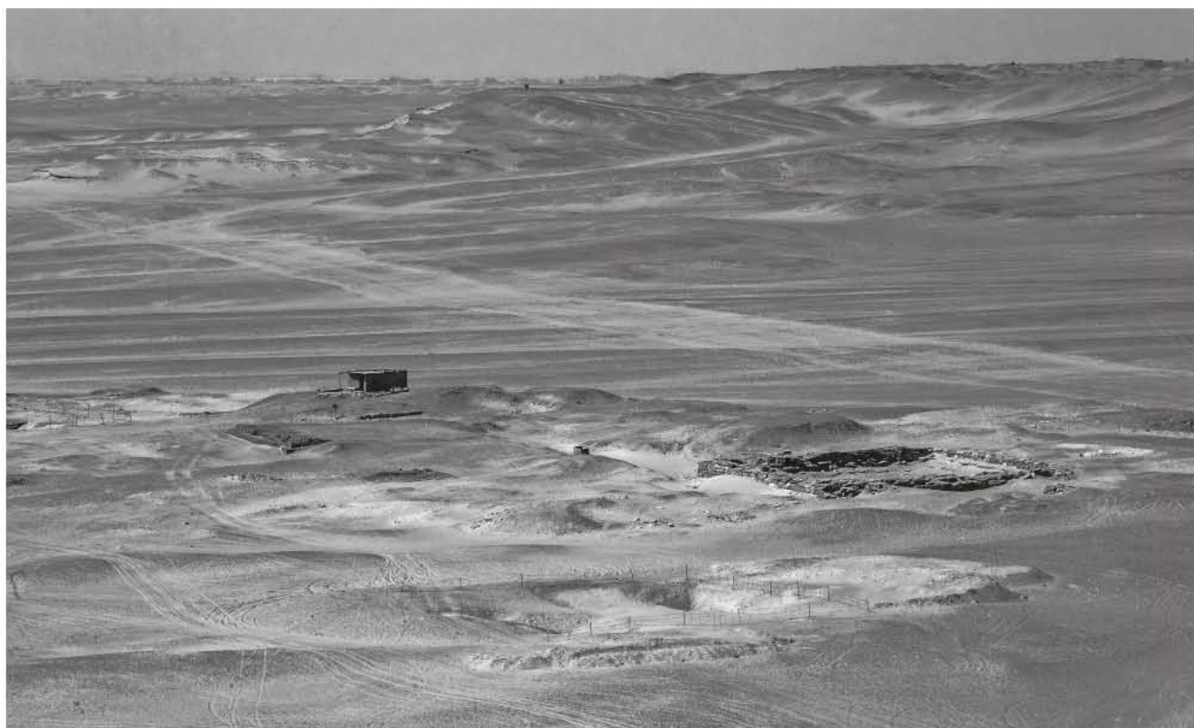
Obr. 2 Skupina velkých šachtových hrobek v Abúsíru – zcela vpředu stavba AW 6, za ní vpravo Vedžahorresnetova a vlevo lufaova hrobka, pohled od severovýchodu / Fig. 2 A group of large Late Period shaft tombs at Abusir – structure AW 6 in the foreground, with the tombs of Udjahorresnet (right) and lufaa (further back), seen from the northeast

nadzemní část této hrobky nebyla nikdy dokončena. Ne zcela příjemné (zejména z hlediska rozsahu dalších prací) bylo i zjištění, že základy obvodového zdiva jsou zakryty silnou vrstvou písku a sutě, přesahující na některých místech svou výškou i 2 m.