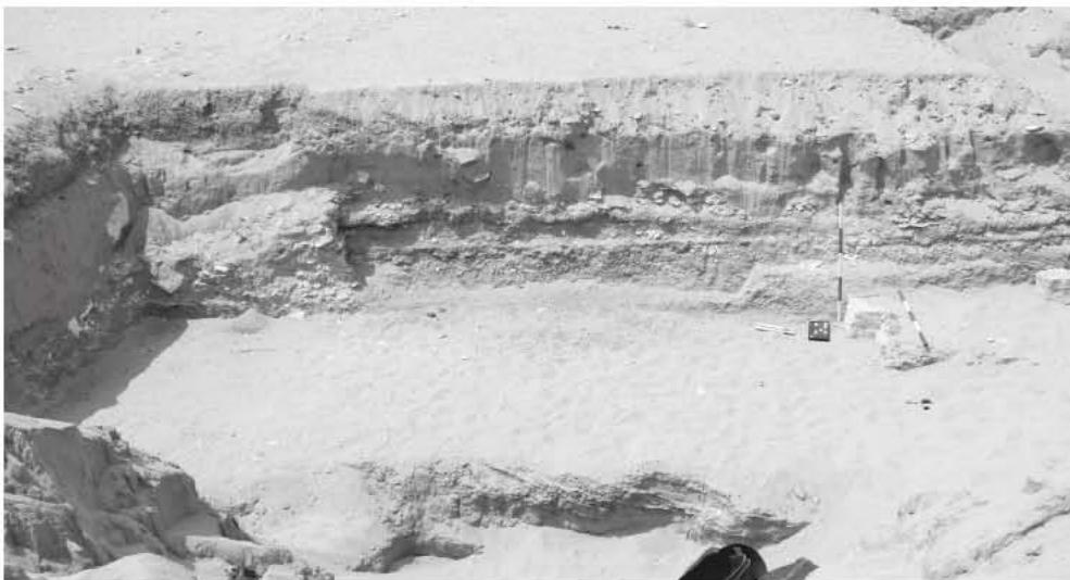
Obr. 4 Jihozápadní roh hrobky AW 6 s prostorem po vylámané ohradní zdi, pohled od východu / Fig. 4 The southwestern corner of structure AW 6, seen from the east

na tomto podstavci stála, měla podstavu o rozměrech 33 \times 20 cm a byla do něj zapuštěna 3 cm.