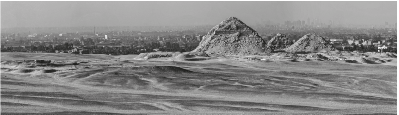
Obr. 1 Celkový pohled na abúsírskou nekropoli s pyramidami panovníků 5. dynastie, vlevo ústí velkých šachtových hrobek z Pozdní doby, pohled od jihozápadu / Fig. 1 General view of the Abusir necropolis with pyramids of kings of the Fifth Dynasty and with openings of large Late Period shaft tombs, seen from the southwest