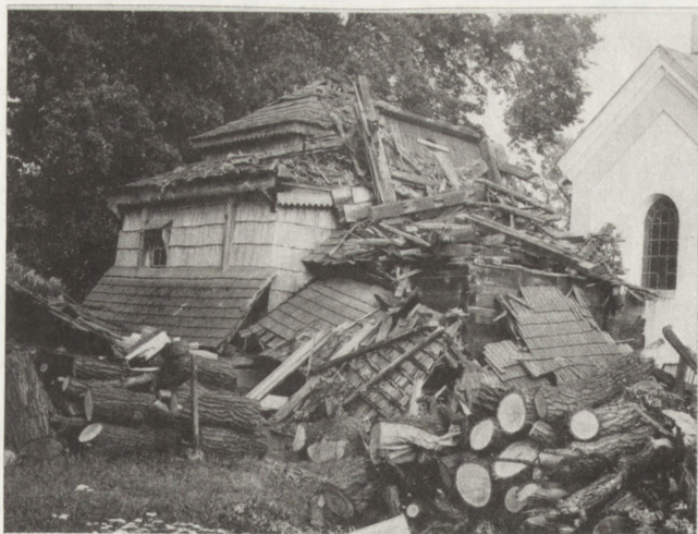
5. Rudka (woj. przemyskie). Dawna cerkiew fil. gr.-kat. 1693, Widok od pn.-zach., stan po uszkodzeniu

5. Rudka (voivodeship of Przemysł). Former Uniate Church, 1693. View from north-west, state following damage