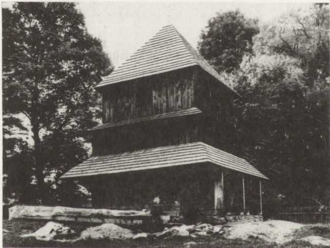
1. Michniowiec (woj. krośnieńskie). Dawna dzwonnica cerkiewna, 1904, majster Jakub Grzyb. Widok od pn.-zach., w trakcie prac konserwatorskich

Zbierany w ciągu lat materiał informacyjno-dokumentacyjny oraz różnorodne działania Komisji, w tym podejmowane stopniowo prace konserwatorskie, stały się tematem obrad Głównej Komisji Konserwatorskiej przy Generalnym Kon-