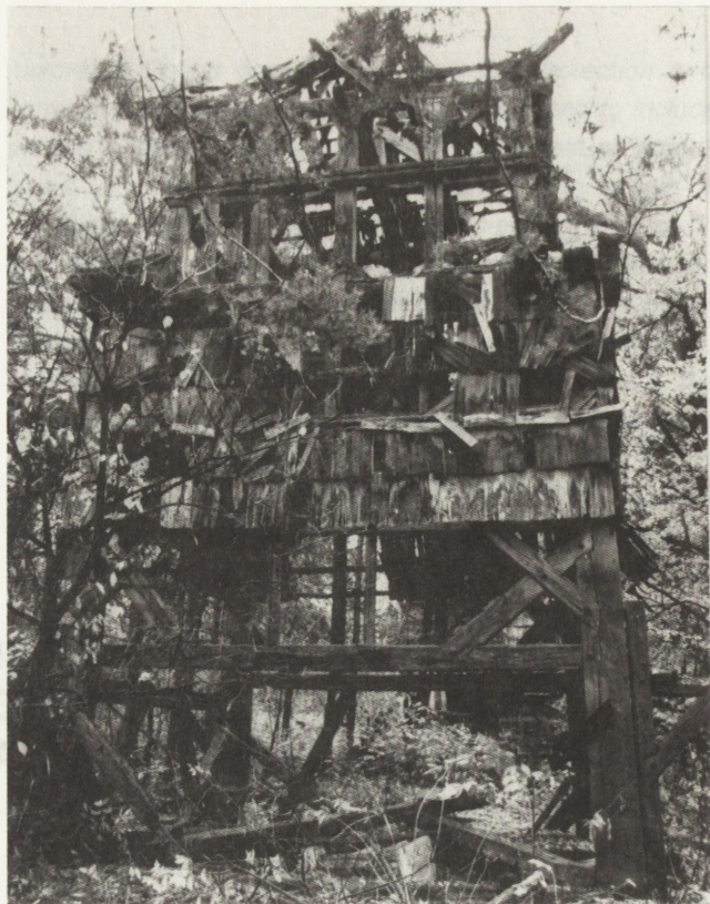
2. Teniatyska (woj. zamojskie). Dzwonnica cerkiewna, 1759. Widok od zach., stan przed przystąpieniem do prac demontażowych

2. Teniatyska (voivodeship of Zamość). Bell tower, 1759. View from west, state prior to dismantling