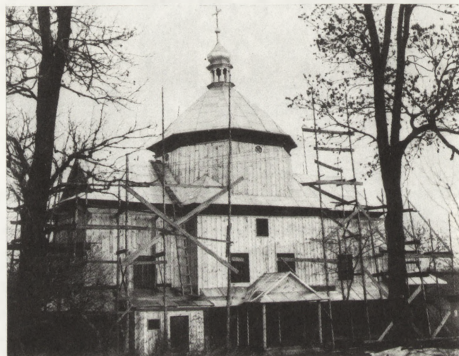
12. Myców (woj. zamojskie). Dawna cerkiew fil. gr.-kat., 1859 (?), może wcześniejsza. Widok od pd., w trakcie prac konserwatorskich (fot. B. Martyniuk, 1991)

Prace porządkowe i konserwatorskie na starych cmentarzach pozwoliły na „odkrycie” szeregu cennych zabytków ludowej kamieniarki, w tym datowanych krzyży nagrobnych pochodzących z I połowy XVIII w. (1709., 1739., 1742 r.) z Lubyczy Królewskiej oraz zwróciły uwagę na wspaniałe