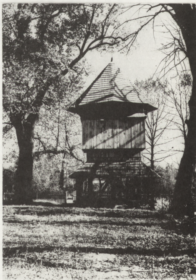
8. Kornie (woj. zamojskie). Dawna dzwonnica cerkiewna, zapewne XVIII w. Stan po pracach konserwatorskich

7. Kornie (voivodeship of Zamość). Former bell tower, probably eighteenth century. State prior to conservation