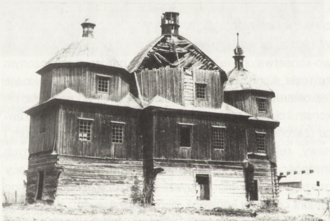
22. Wierzbica (woj. zamojskie). Dawna cerkiew par. gr.-kat., 1882. Widok od pd.