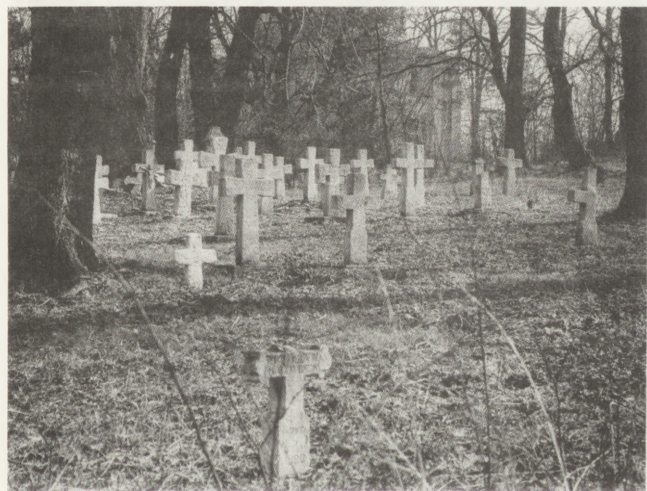
20. Kniazie (woj. zamojskie). Fragment cmentarza gr.-kat. z kamiennymi krzyżami z XIX-XX w. Stan po pracach konserwatorskich w 1988 (fot. B. Martyniuk, 1989)