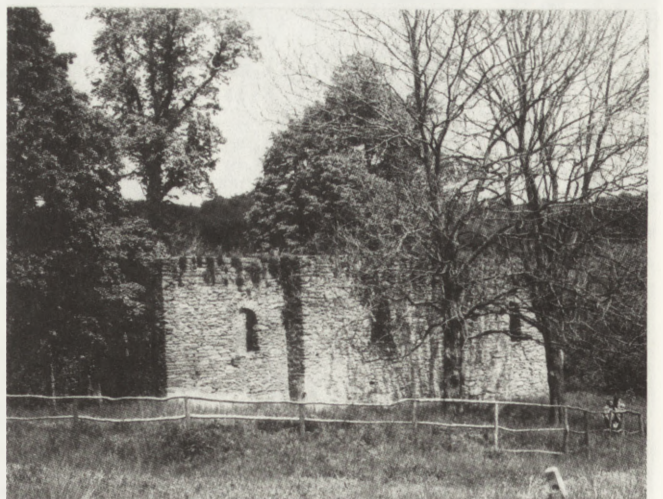
18. Łopienka (woj. krośnieńskie). Dawna cerkiew par. gr.-kat., 1757. Widok od pd.-zach.