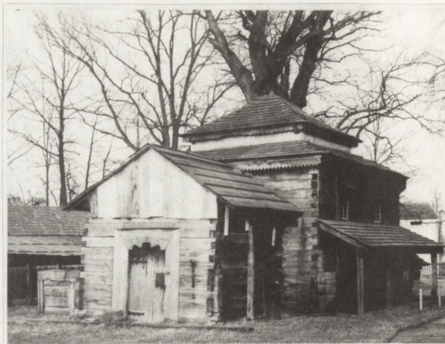
6. Rudka (woj. przemyskie). Dawna cerkiew fil. gr.-kat., 1693. Widok od pd.-zach., stan po zabezpieczeniu 1988 (fot. B. Martyniuk, 1992)

5. Rudka (voivodeship of Przemysł). Former Uniate Church, 1693. View from north-west, state following damage (photo: B. Martyniuk, 1988)