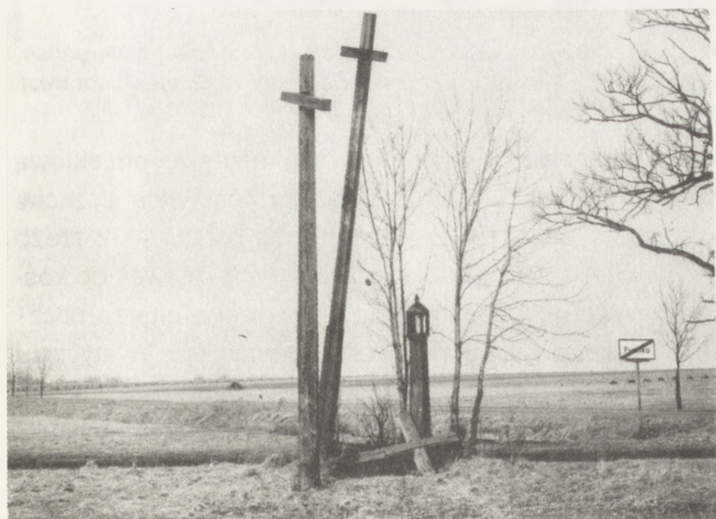
21. Puciska (woj. białostockie). Krzyże przydrożne wraz z kapliczką, 1860. Stan przed pracami konserwatorskimi