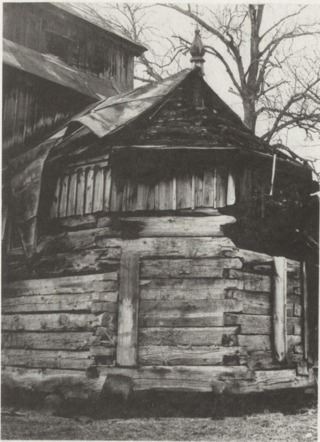
15. Łukawiec (woj. przemyskie). Dawna cerkiew fil. gr.-kat., 1701, z babińcem 1923. Fragment prezbiterium, widok od pd.-wsch., stan po pożarze w lutym 1987