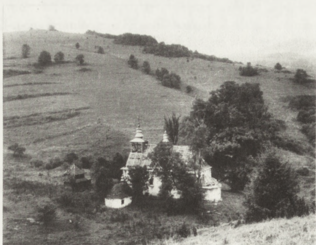
17. Łopienka (woj. krośnieńskie). Dawna cerkiew par. gr.-kat., 1757. Widok ogólny (fot. R. Brykowski, 1955)