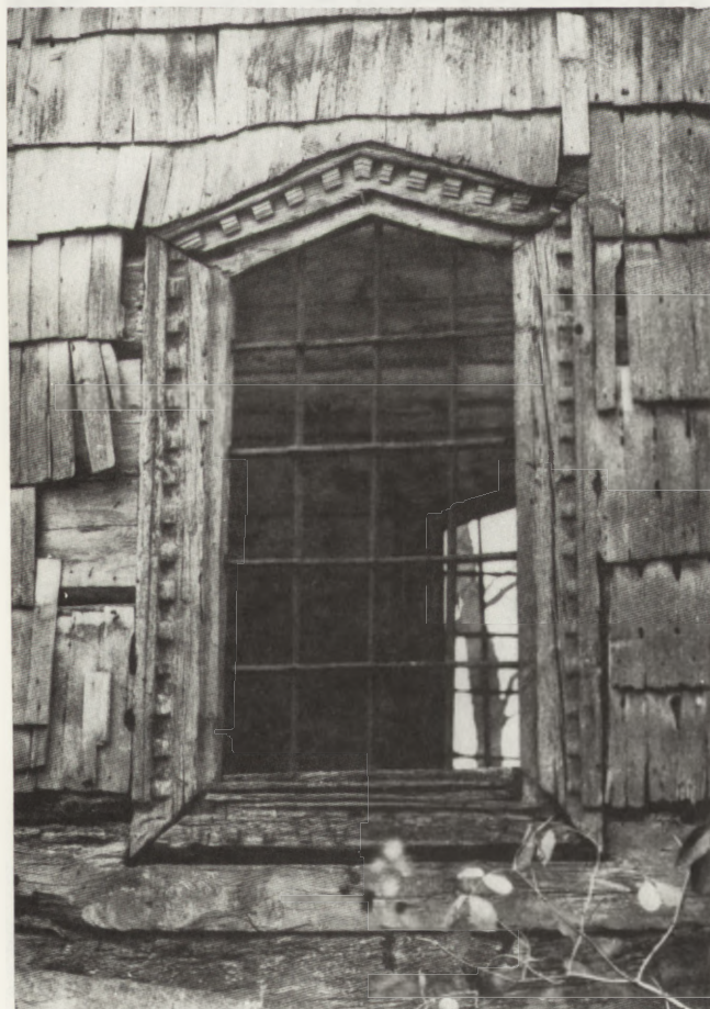
14 Korczmin (woj. zamojskie). Dawna cerkiew par. gr.-kat., 157.../?. Obramienie otworu okiennego w nawie od pn. (fot. B. Martyniuk, 1987)