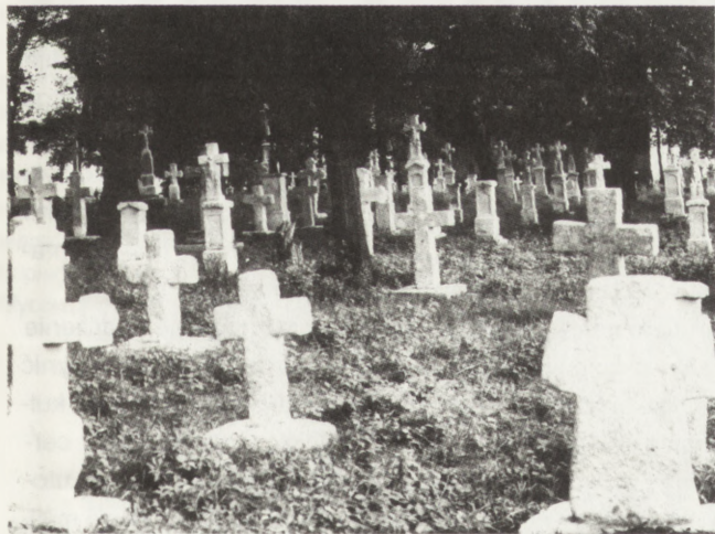
24. Żurawce (woj. zamojskie). Fragment cmentarza gr.-kat., z kamiennymi krzyżami XVIII-XX w. Stan po pracach konserwatorskich w 1990 (fot. B. Martyniuk, sierpień 1990)

Od 1985 r. Komisja gromadzi drewniany detal architektoniczny ze zniszczonych i remontowanych zabytków. Zabezpieczono m.in. odrzwia i drzwi z cerkwi w Teniatskach, konstrukcję kopułki z cerkwi w Lubyczy Królewskiej, bardzo ciekawe zwieńczenie kopuły nawy cerkwi w Wierzbicy