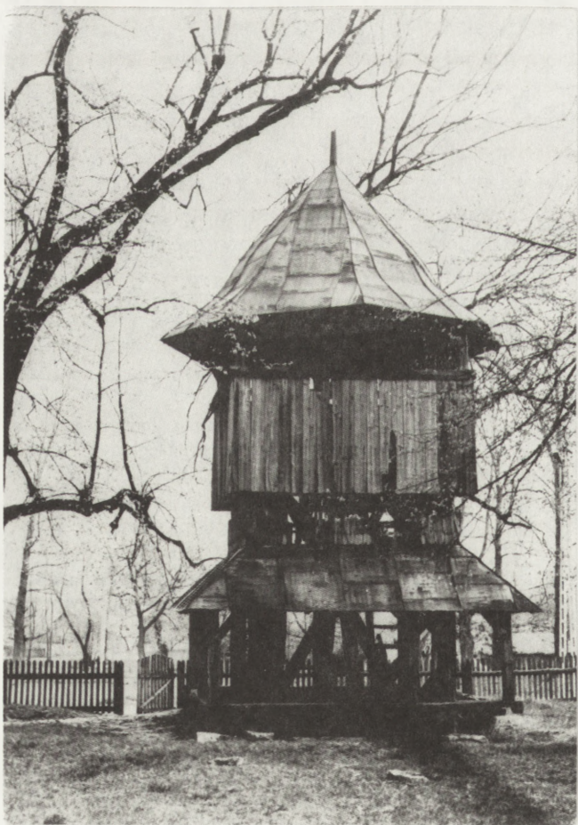
7. Kornie (woj. zamojskie). Dawna dzwonnica cerkiewna, zapewne XVIII w. Stan przed przystąpieniem do prac konserwatorskich (fot. B. Martyniuk, 1987)

6. Rudka (voivodeship of Przemysł). Former Uniate church, 1693. View from south-west, state after securing in 1988 (photo: B. Martyniuk, 1992).