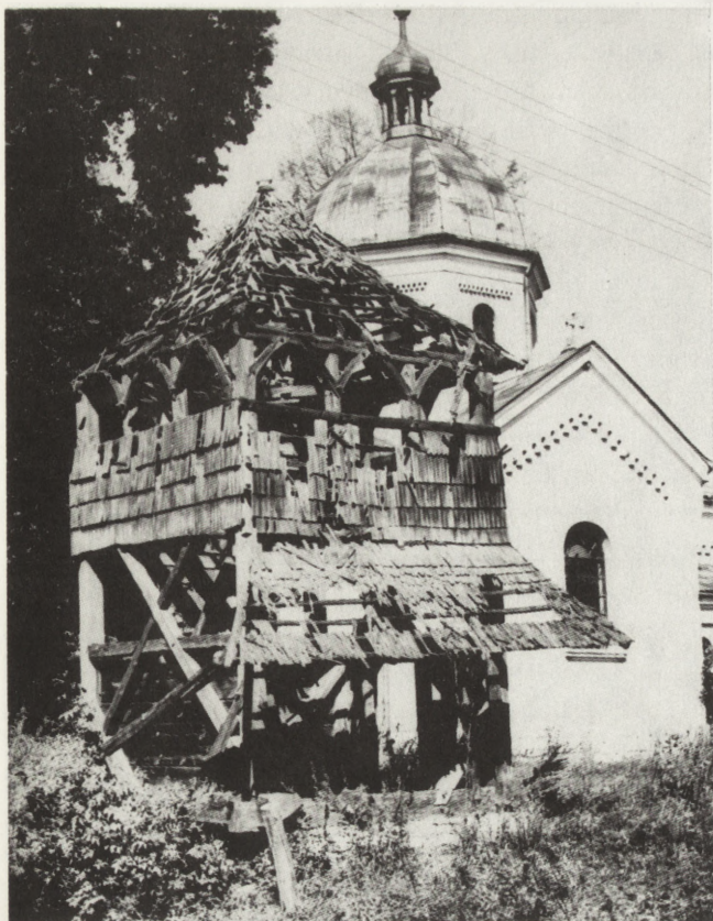
9. Siedliska (woj. zamojskie). Dawna dzwonnica cerkiewna, zapewne XVIII w. Stan przed przystąpieniem do prac konserwatorskich (fot. B.Martyniuk, wrzesień 1989)

9. Siedliska (voivodeship of Zamość). Former bell tower, probably eighteenth century. State prior to conservation (photo: B.Martyniuk, September 1989).