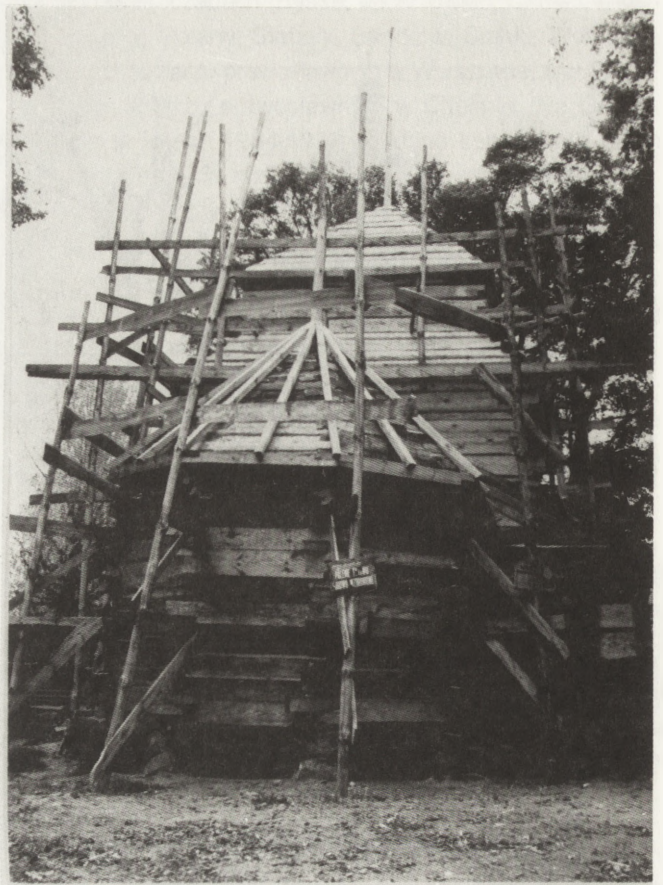
16. Łukawiec (woj. przemyskie). Dawna cerkiew fil. gr.-kat., 1701, widok od wsch., stan w trakcie prac konserwatorskich