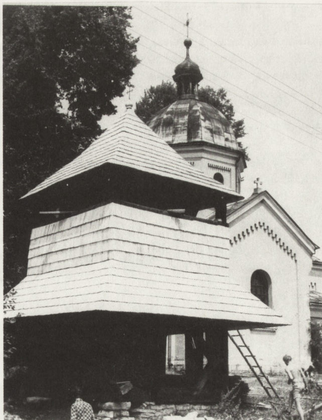
10. Siedliska (woj. zamojskie). Dawna dzwonnica cerkiewna, zapewne XVIII w. Stan po pracach konserwatorskich

Prace nagrodzone i wyróżnione w konkursach oraz powstające na plenerach wielokrotnie były prezentowane na wystawach. Pierwsza taka wystawa (poplenerowa)