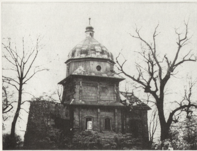
13 Korczmin (woj. zamojskie). Dawna cerkiew par. gr.-kat. 157.../?, widok od pn. Stan przed przystąpieniem do prac konserwatorskich (fot. B. Martyniuk, maj 1983)