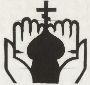
Znak Komisji. (Proj. Leon Tarasewicz, 1982 r.) Insignia of the Commission (design by Leon Tarasewicz, 1982)