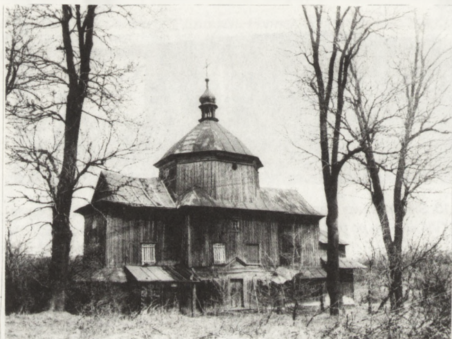
11. Myców (woj. zamojskie). Dawna cerkiew fil. gr.-kat., 1859 (?), może wcześniejsza. Widok od pd., stan po zabezpieczeniu, przed pracami konserwatorskimi

W 1984 r. Komisja rozpoczęła prace porządkowe i konserwatorskie na zabytkowych cmentarzach łemkowskich. Prace te były poprzedzone podstawowymi badaniami naukowymi (mikrobiologiczne, fizykochemiczne, petrograficzne). Prowadził je zespół kierowany przez mgr. Janusza Smazę na cmentarzu w Czarnem (woj. nowosądeckie). Poddano konserwacji 13 kamiennych krzyży nagrobnych.