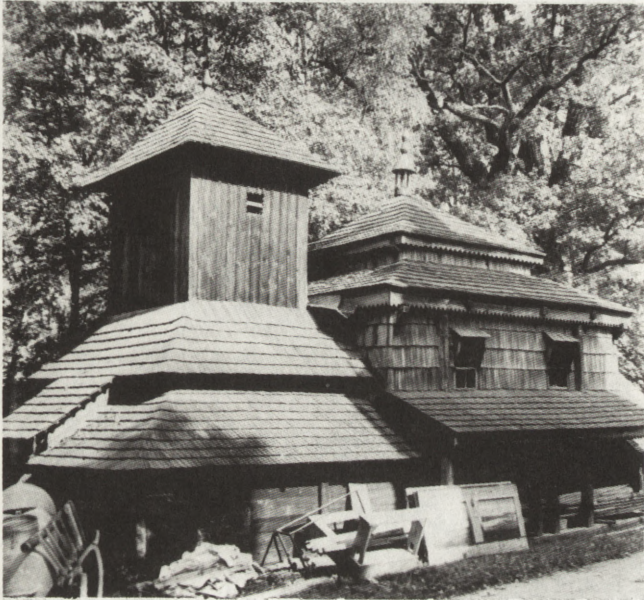
4. Rudka (woj. przemyskie). Dawna cerkiew fil. gr.-kat., 1693, z wieżą XVIII w. (lub wówczas przebudowana), gruntownie konserwowana 1958. Widok od pd.-zach., stan przed uszkodzeniem

Już w 1982 r. podjęto zbieranie różnych materiałów dotyczących architektury i sztuki cerkiewnej. Były to przede wszystkim fotografie, rysunki, pomiary i bibliografia. Od 1983 r. przystąpiono do wykonywania pomiarów budowli zagrożonych bądź na zlecenie, bądź w ramach praktyk wakacyjnych, we współpracy z Politechnikami Białostocką i Warszawską. Wykonano 7 pomiarów budowli cerkiewnych