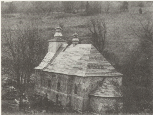
19. Łopienka (woj. krośnieńskie). Dawna cerkiew par. gr.-kat., 1757. Widok ogólny