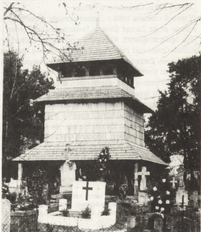
3. Lubicza Królewska (woj. zamojskie). Dzwonnica cerkiewna przeniesiona z Teniatyski w 1990 r. Stan po pracach konserwatorsko-rekonstrukcyjnych

2. Teniatyska (voivodeship of Zamość). Bell tower, 1759. View from west, state prior to dismantling