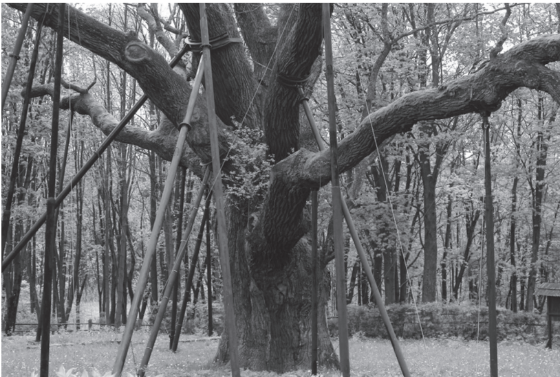
Fot. 3. Dąb Bartek