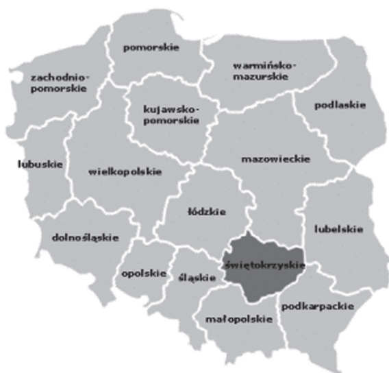
Rys. 1. Położenie województwa świętokrzyskiego