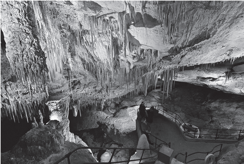
Fot. 2. Jaskinia Raj