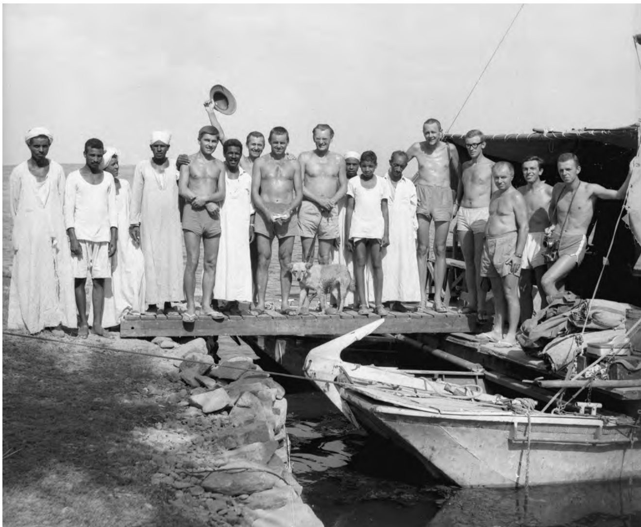
Obr. 1 Skupinové foto členů expedice Československého egyptologického ústavu do Nubie v roce 1964 pod vedením profesora Zbyňka Žáby (uprostřed s „expedičním“ psem) / Fig. 1 Group photo of the members of the expedition of the Czechoslovak Institute of Egyptology in Nubia in 1964, under the direction of professor Zbyněk Žába (in the middle, with the “expedition” dog)