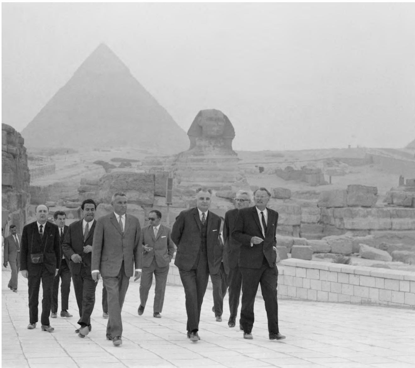
Obr. 6 Zbyněk Žába doprovázející Jána Marka (tehdejšího československého ministra zahraničních věcí) během jeho návštěvy Gízy (foto M. Zemina) / Fig. 6 Zbyněk Žába accompanying Ján Marko (the Czechoslovak Minister of Foreign Affairs) during his visit to Giza (photo M. Zemina)

Nešlo však vždy právě o aktivní podporu vědců (logistika nubijské archeologické operace nesvědčí o automatických