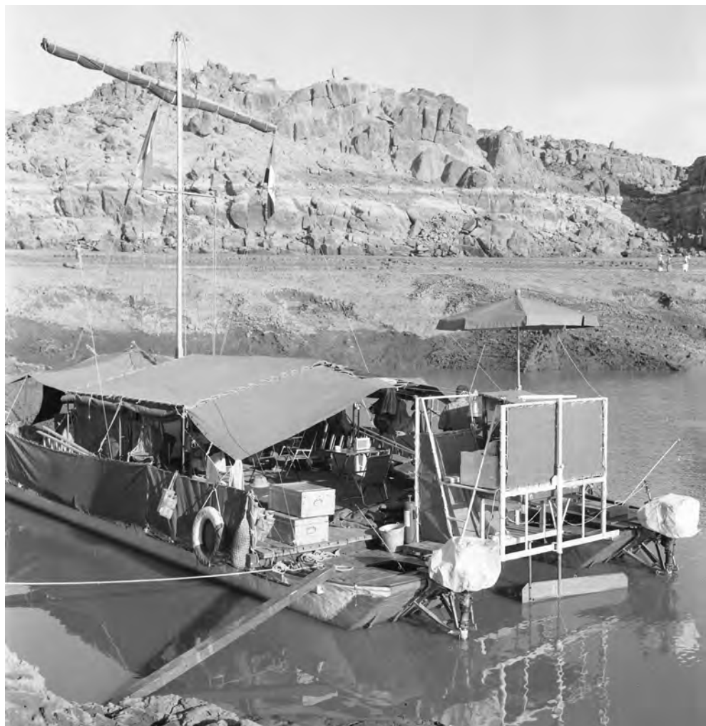
Obr. 4 Katamarán Sadiq en-Núba, „Přítel Núbie“, na expedici v roce 1961 / Fig. 4 Catamaran Sadiq en-Nuba, „Friend of Nubia“, during the 1961 expedition