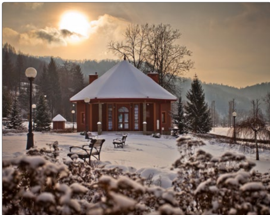
Pijalnia wód mineralnych Antoni

Głównym bogactwem zarówno Muszyny jak i okolic są zasoby leczniczych wód mineralnych,