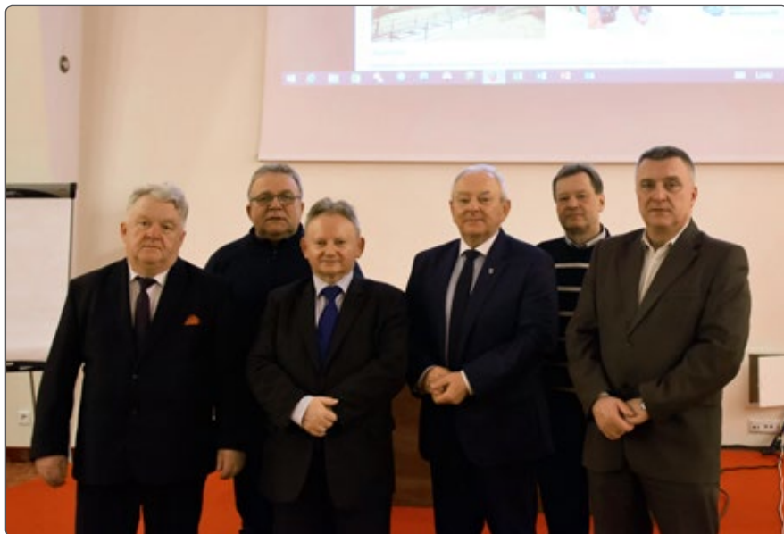
Uczestnicy posiedzenia Zarządu SGU RP

surowców leczniczych i właściwości leczniczych klimatu, kryteriów ich oceny oraz wzoru świadectwa potwierdzającego te właściwości.