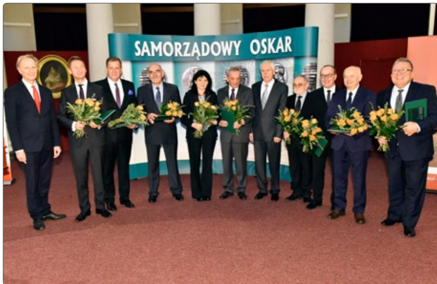
Laureaci Nagrody im. Grzegorza Palki w roku 2016

III. W kategorii działań w samorządzie lokalnym o znaczeniu ponadlokalnym.