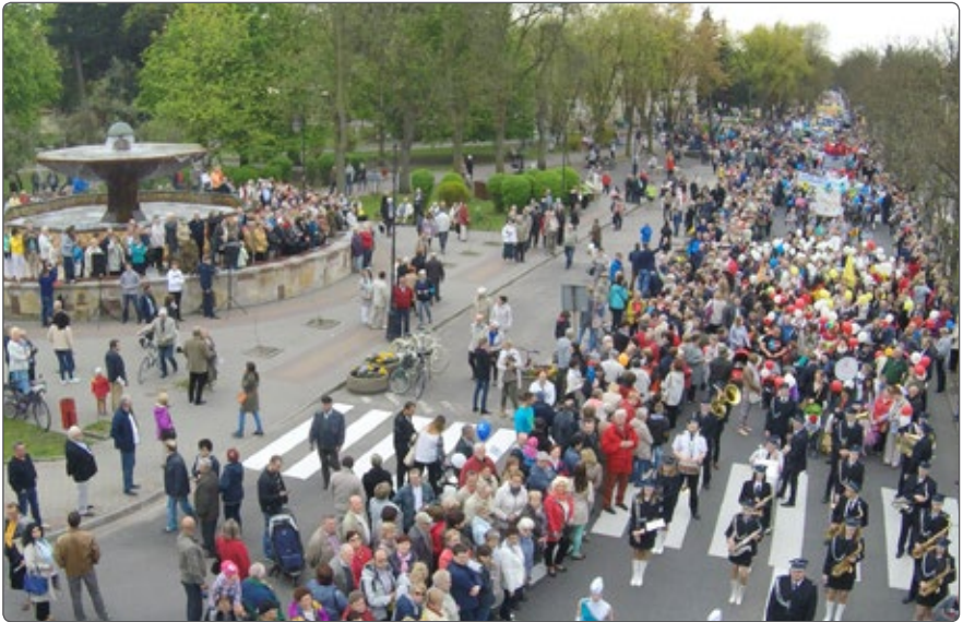
1.05.2017. Jubileuszowa Parada Ciechocinian ulicami miasta

Wówczas z wielką pompą otwierano bramę wiodącą do jednego z głównych budynków uzdrowskich, dziś sezon otwiera kawalkada kolorowych pojazdów, przebierańców i mnóstwo gości. W pierwszej edycji ciechocińskiej imprezy pojawiły się konie, bryczki, orkiestry, dzieci i młodzież, pracownicy miejskich urzędów i instytucji, kuracjusze i mieszkańcy. Furorę zrobili szcudlarze, wielka łódź piracka i zabytkowe, amerykańskie auta. W marszu wzięło udział ponad tysiąc osób, a wszystko zwieńczył piknik na miejskim stadionie i występ zespołu Zakopower. Sukces pierwszej parady sprawił, że najpewniej na stałe zagości ona w ciechocińskim kalendarzu.