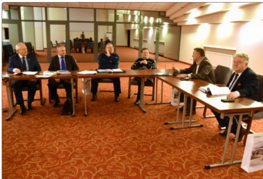
Obrady Zarządu SGU RP

Jednym z ostatnich punktów spotkania było podsumowanie I edycji konkursu EKO HESTIA SPA i przedstawienie założeń do kolejnej edycji. W I edycji konkursu uczestniczyło 11 polskich gmin uzdrowskich: Inowrocław, Nałęczów, Sękowa, Krynica-Zdrój, Rabka-Zdrój, Szczawnica, Konstancin-Jeziorna, Sopot, Busko-Zdrój, Solec-Zdrój i Uniejów. Do ścisłego finału zakwalifikowano cztery gminy: Busko Zdrój, Nałęczów, Sopot i Uniejów. Laureatem I edycji konkursu została gmina Uniejów. Projekt UZDROWISKO TERMALNE UNIEJÓW – w przyjaź-