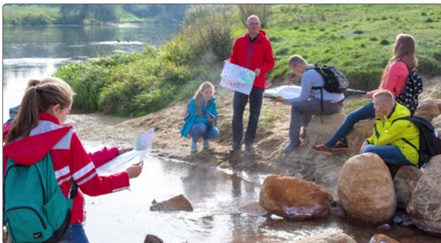
Zajęcia ekologiczne.

HESTIA SPA. I edycja pokazała jak wiele działań w zakresie ekologii, ochrony środowiska i edukacji ekologicznej jest realizowanych na terenach gmin uzdrowiskowych.