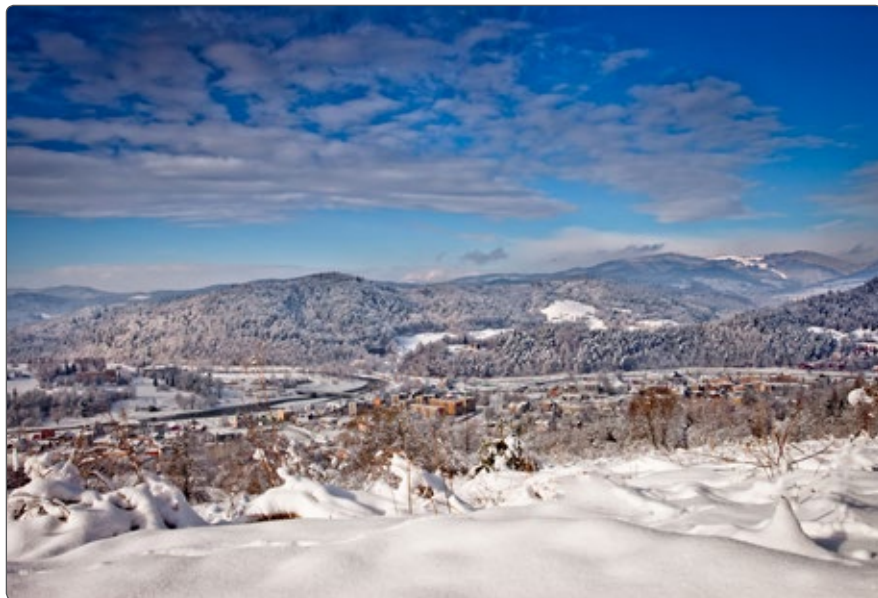
Widok na Muszynę

wykorzystywanych do kuracji pitnej, kąpeli i aeroterapii w ośrodkach sanatoryjnych i do butelkowania przez miejscowe rozlewnie wód mineralnych.