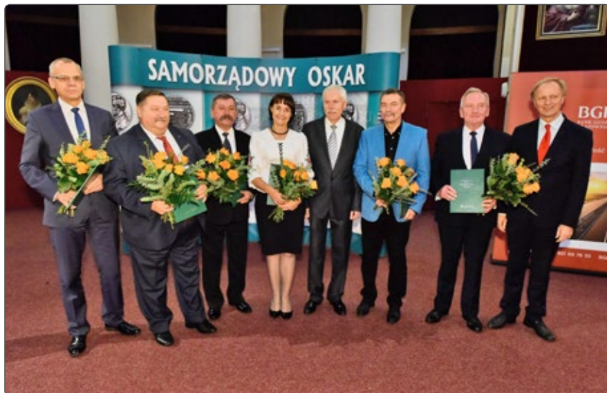
Osoby wyróżnione Samorządowym Oskarem w roku 2016

kraju ". Prezydent RP wyraził uznanie za wykonaną pracę na rzecz samorządu i złożył gratulacje Laureatom.