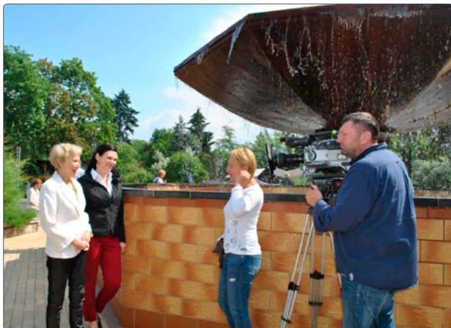
Na planie filmu "Moje leczenie wodą"

żenia nowego eventu: I Parady Ciechocinian. Było to przedsięwzięcie ryzykowne, bo datowane na 1 maja, czyli... w pierwszych skojarzeniach – pochód pierwszomajowy. Udało się nam wyśmienicie zintegrować społeczność mieszkańców, kuracjuszy, przedsiębiorców. Parada będzie powtórzona. Zatem, „melduję wykonanie zadania” i wracam do mojego świata: filmów dokumentalnych o wielkich ludziach, którzy żyją skromnie wśród nas. Współpracuję ściśle ze Stowarzyszeniem Komisja Zdrojowa w Ciechocinku, która w tym roku wzmacnia swój potencjał dzięki nowym członkom z pobliskiego Wieńca i Inowrocławia. Razem stanowimy świetny, partner-