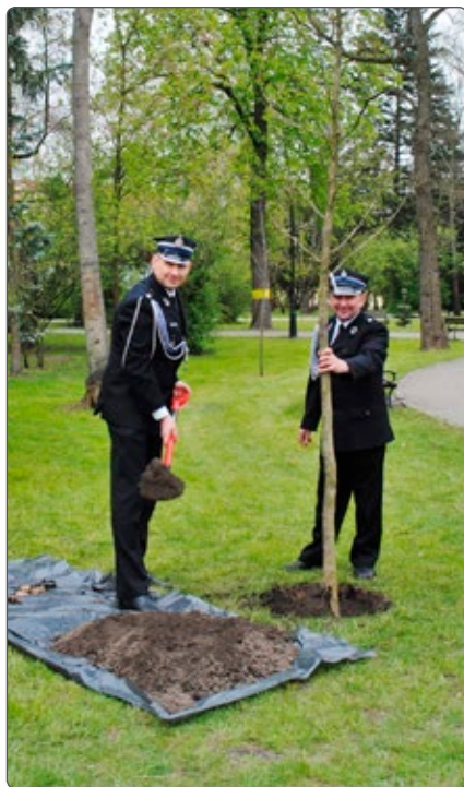
Posadzenie drzewka jubileuszowego przez przedstawicieli Ochotniczej Straży Pożarnej, która obchodziła jubileusz 130-lecia