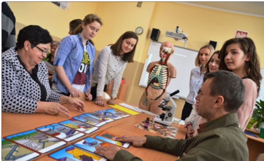
Ekopracownia w uniejowskiej szkole

rozwoju, by prowadzone obecne działania proekologiczne służyły w przyszłości młodemu pokoleniu.