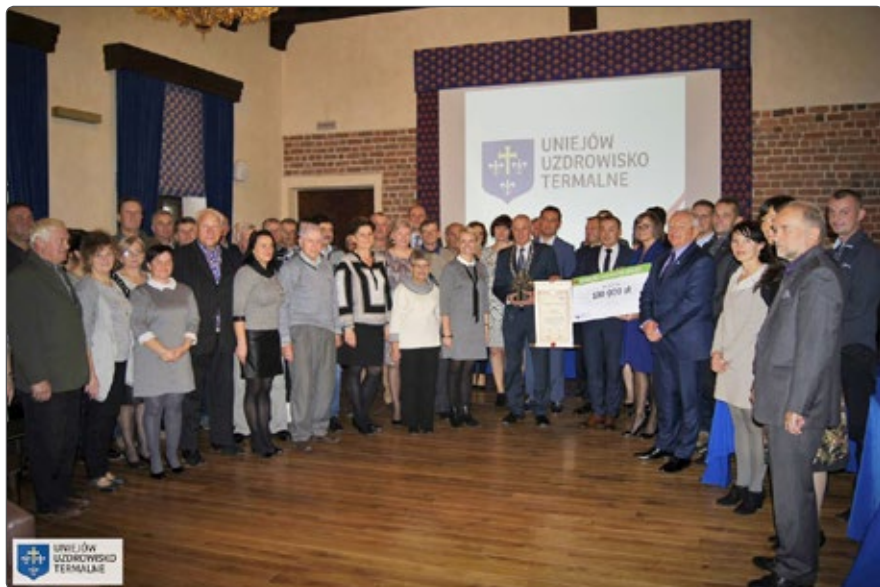
EKO Hestia SPA Uniejów

leczenia wykorzystywana jest woda geotermalna.