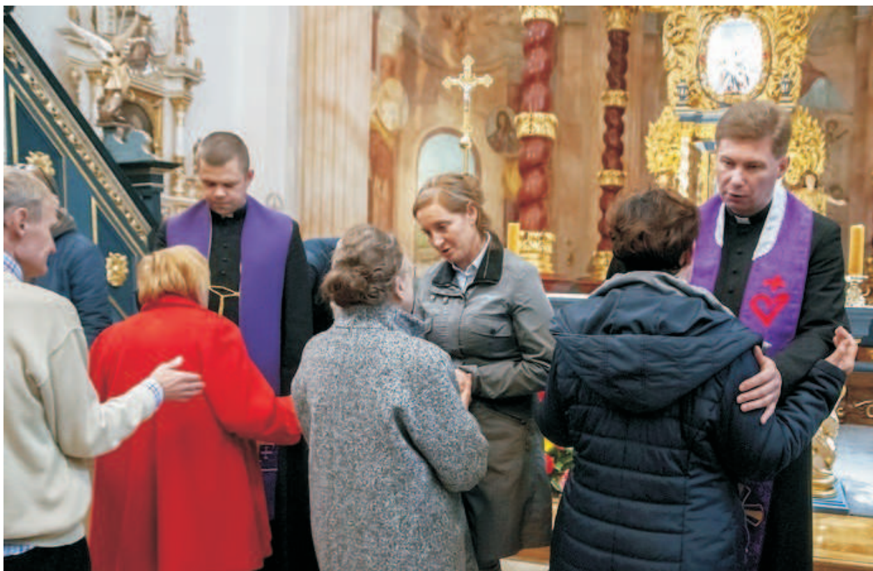
Fot. 32. Dzień uwielbienia Boga w jedności grup i wspólnot charyzmatycznych diecezji koszalińsko-kołobrzeskiej „Nigdy nie będziesz sam” 19.10.2019 r.