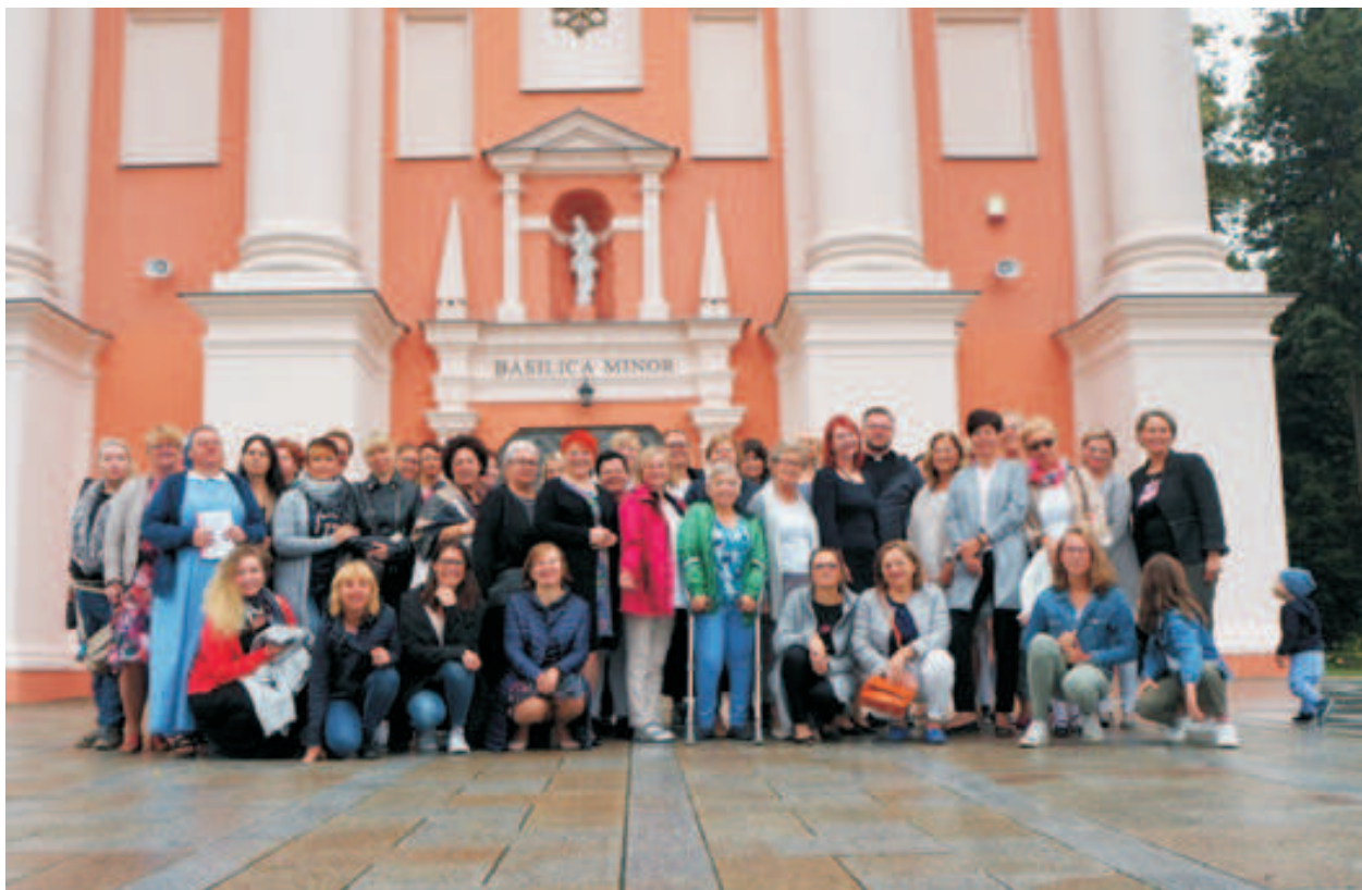
Fot. 27. Warsztaty dla kobiet „Jak być piękną i kochaną czyli Miriam z Nazaretu” 6–8.09.2019 r.