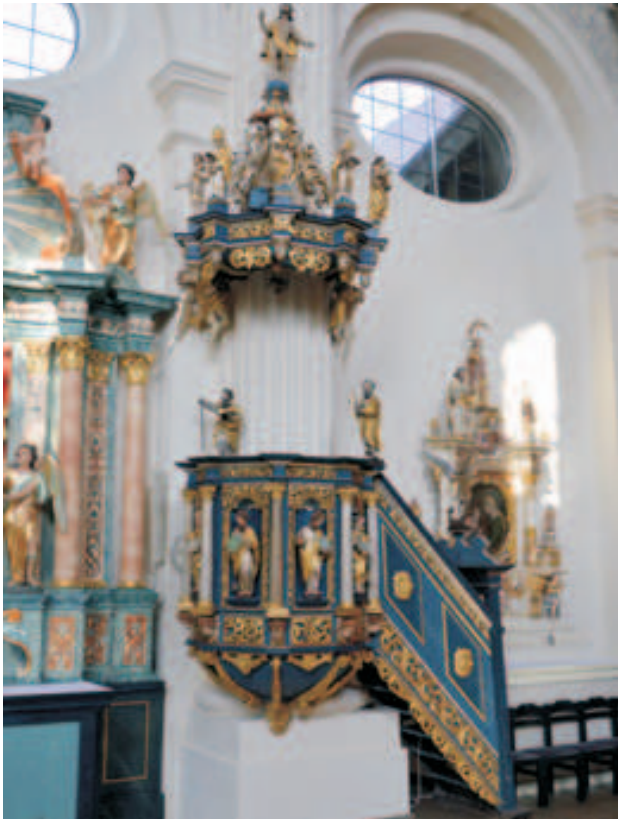
Fot. 3. Ambona (kaszalnica) w bazylice – sanktuarium Matki Bożej Bolesnej w Skrzatuszu 2020 r.