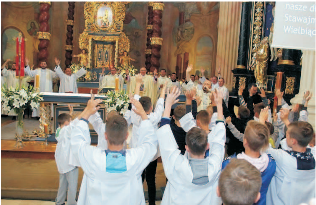
Fot. 20. Diecezjalny Dzień Ministranta 1.05.2019 r.