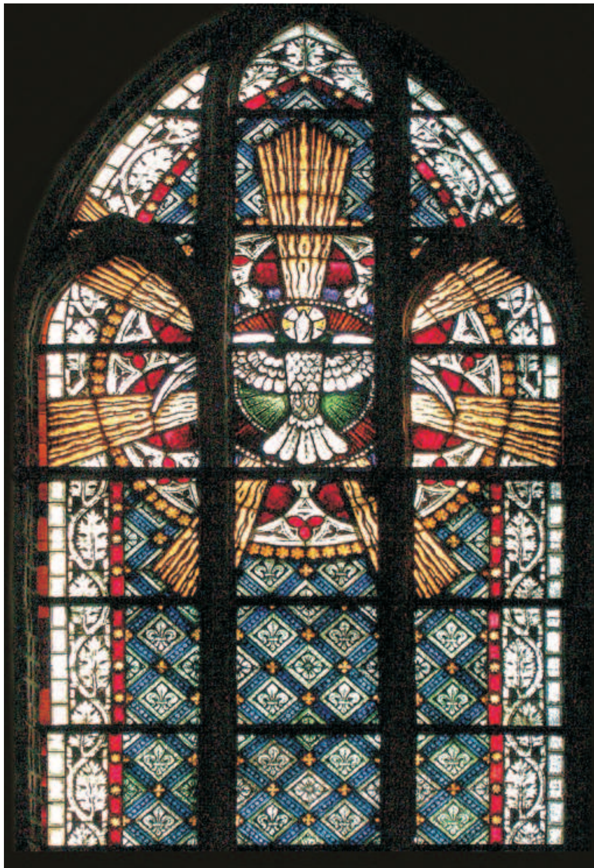
Fot. 13. Witraż z Gołębicą Ducha Świętego w prezbiterium koszalińskiej katedry