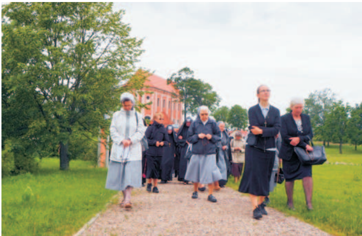
Fot. 25. Pielgrzymka osób konsekrowanych 8.06.2019 r.