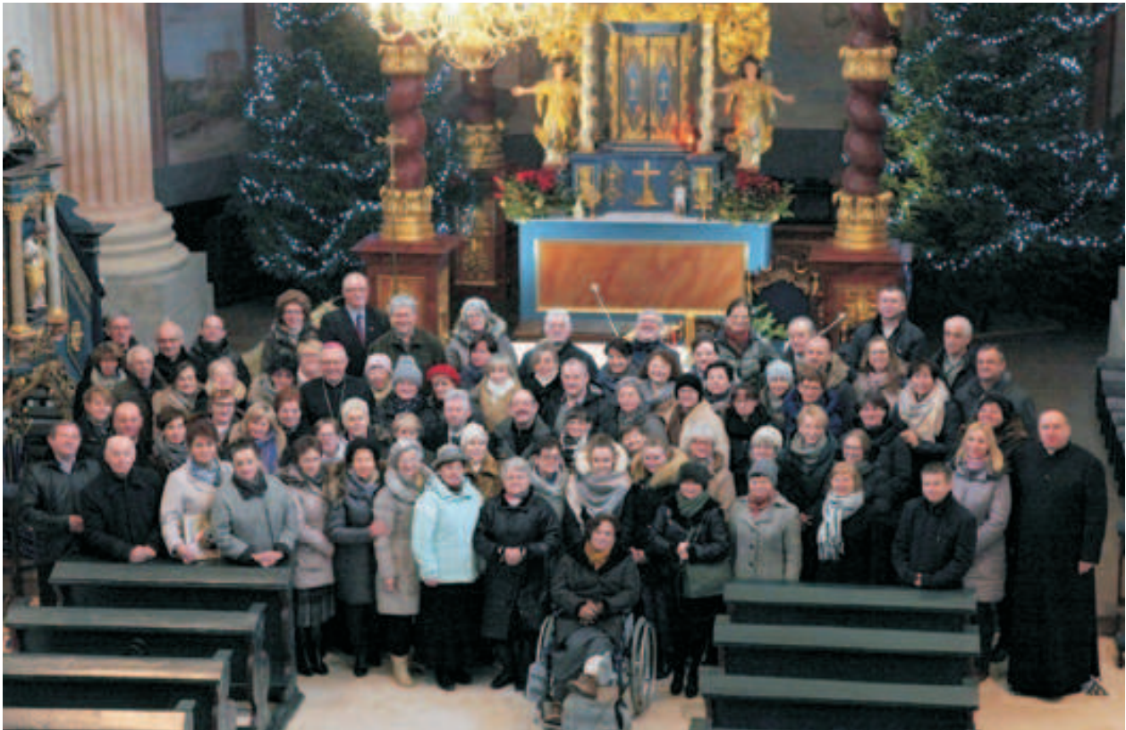
Fot. 19. Drugi turnus rekolekcji synodalnych w Skrzatuszu 25–27.01.2019 r.