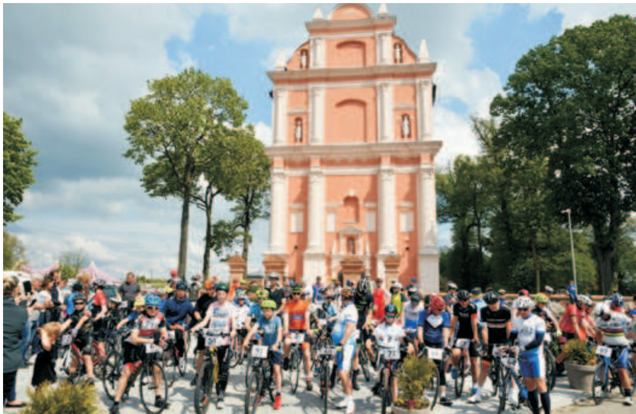
Fot. 22. V Mistrzostwa Polski w Kolarstwie Szosowym Duchowieństwa i Ministrantów i II Mistrzostwa Księży i Ministrantów Diecezji Koszalińsko-Kołobrzeskiej w Kolarstwie Szosowym 18.05.2019 r.