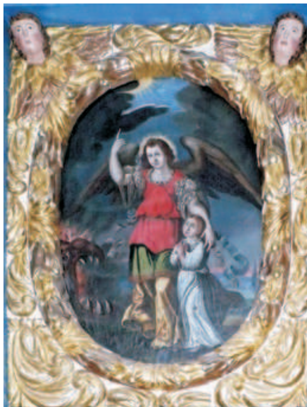
Fot. 15. Tobiasz z archaniołem Rafałem , obraz w predelli ołtarza Anioła Stróża