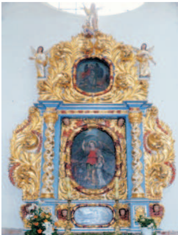
Fot. 14. Ołtarz Świętego Anioła Stróża w kościele pielgrzymkowym w Skrzatuszu