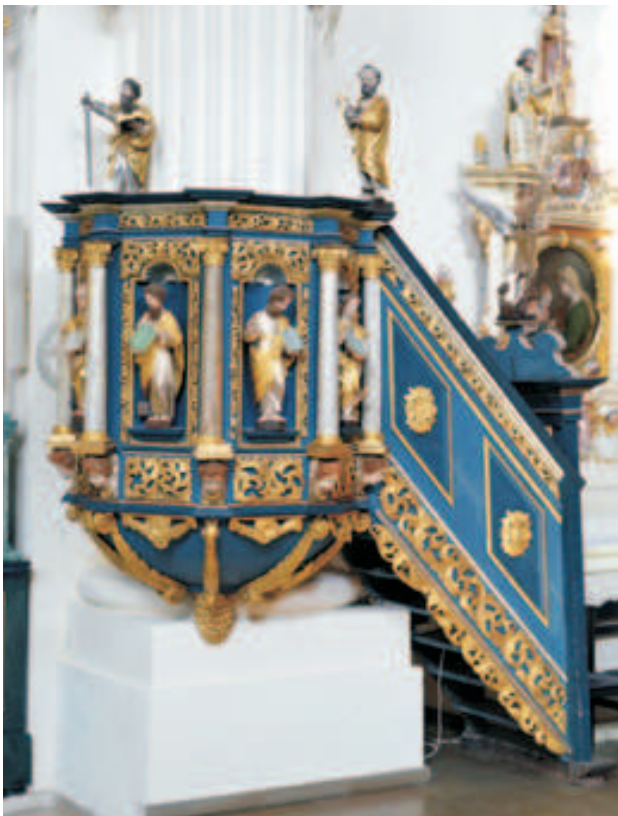
Fot. 5. Kosz ambony skrzatuskiej po renowacji w 1999 r.