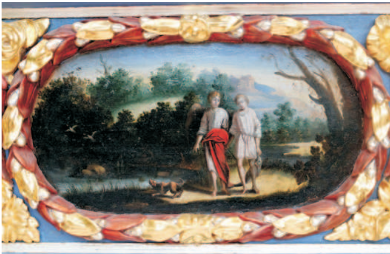
Fot. 16. Anioł Stróż z podopiecznym , obraz w centrum nastawy ołtarza