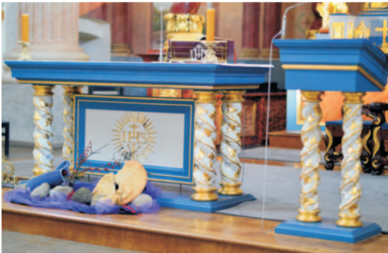
Fot. 7. Ołtarz i ambona w sanktuarium skrzatuskim wykonane w 2013 r. [fot. K. Zadarko]