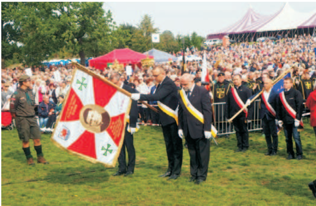
Fot. 29. Diecezjalna Pielgrzymka do Matki Bożej Bolesnej w Skrzatuszu 15.09.2019 r.