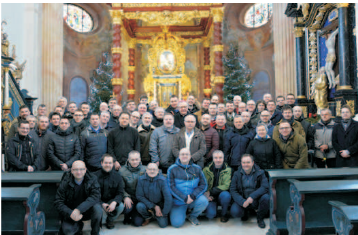
Fot. 18. Spotkanie dla mężczyzn „Boga nie spotkasz w centrum handlowym – możesz Go spotkać na pustyni Skrzatusza” 18–20.01.2019 r.