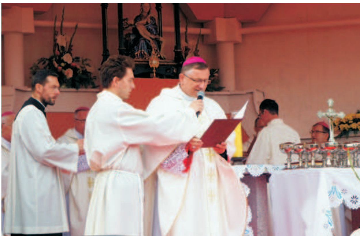
Fot. 30. Diecezjalna Pielgrzymka do Matki Bożej Bolesnej w Skrzatuszu 15.09.2019 r. – odczytanie dekretu o nadaniu tytułu bazyliki mniejszej kościołowi skrzatuskiemu