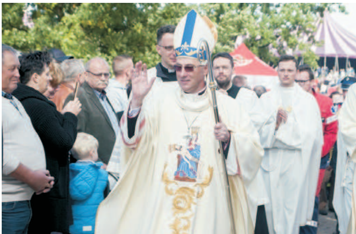
Fot. 28. Diecezjalna Pielgrzymka do Matki Bożej Bolesnej w Skrzatuszu 15.09.2019 r.