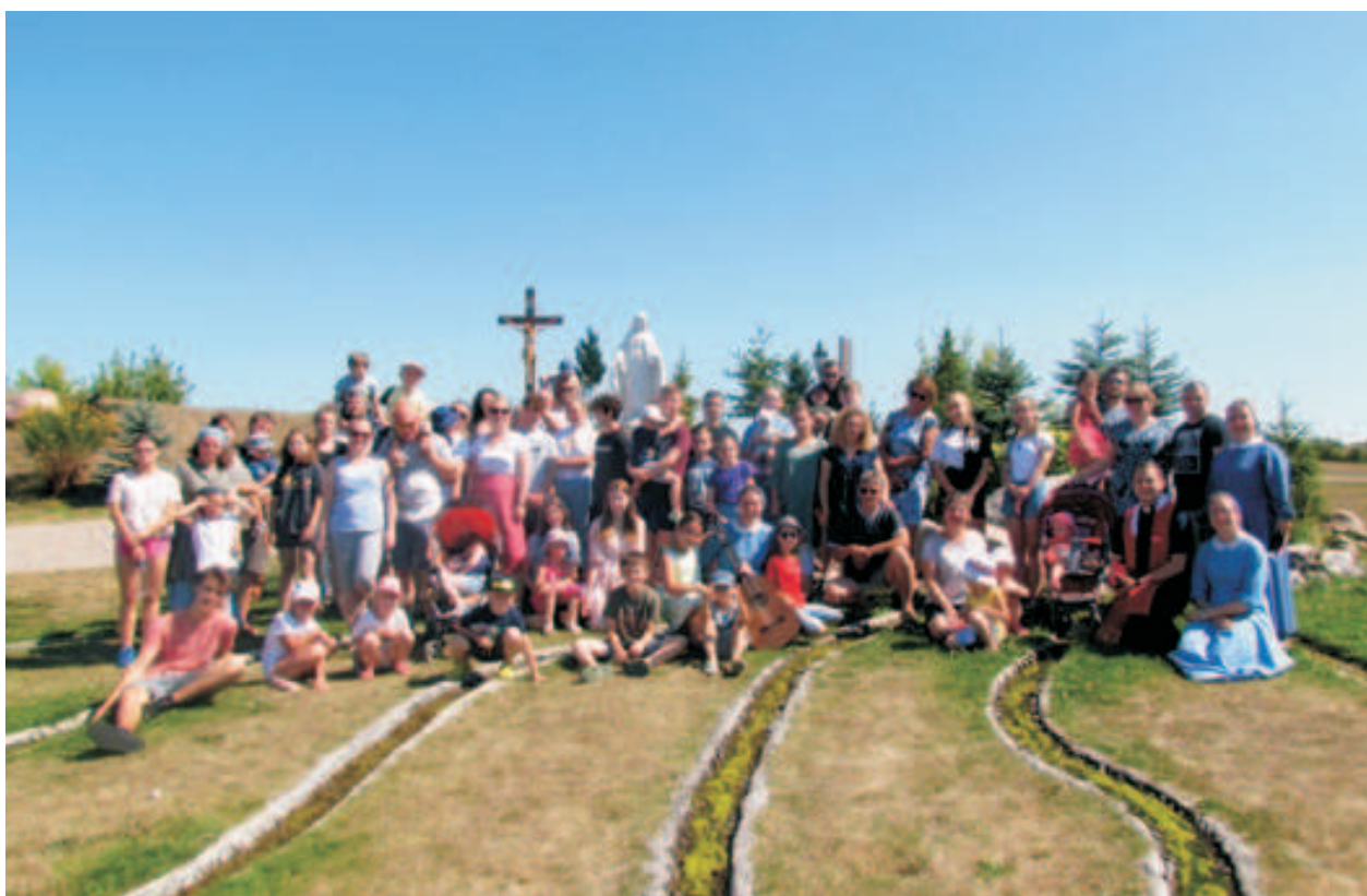
Fot. 26. Rekolekcje dla rodzin 20–28.07.2019 r.