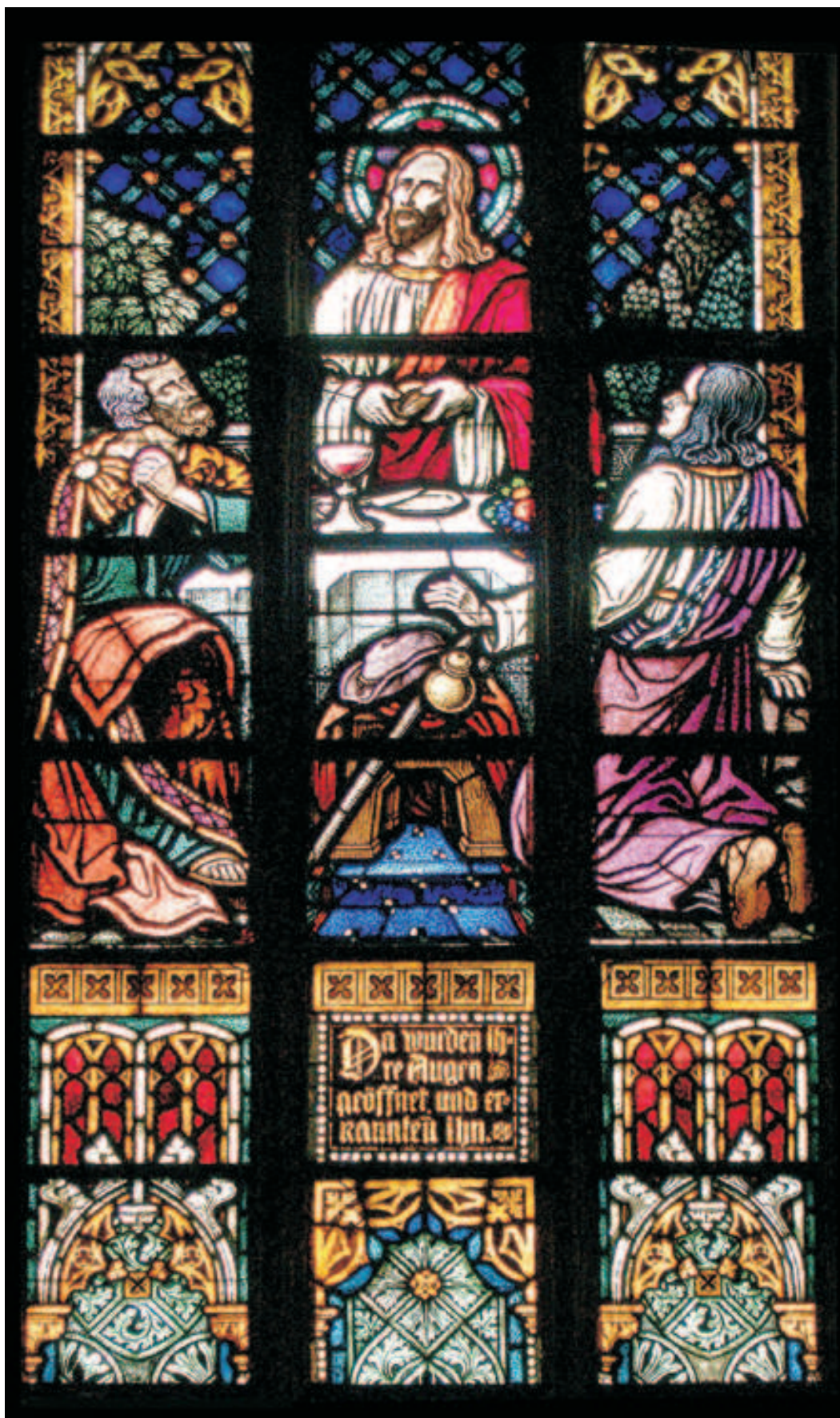
Fot. 12. Witraż ze sceną „Chrystus w Emaus” w prezbiterium koszalińskiej katedry