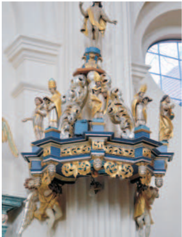
Fot. 6. Baldachim ambony skrzatuskiej po renowacji w 1999 r.