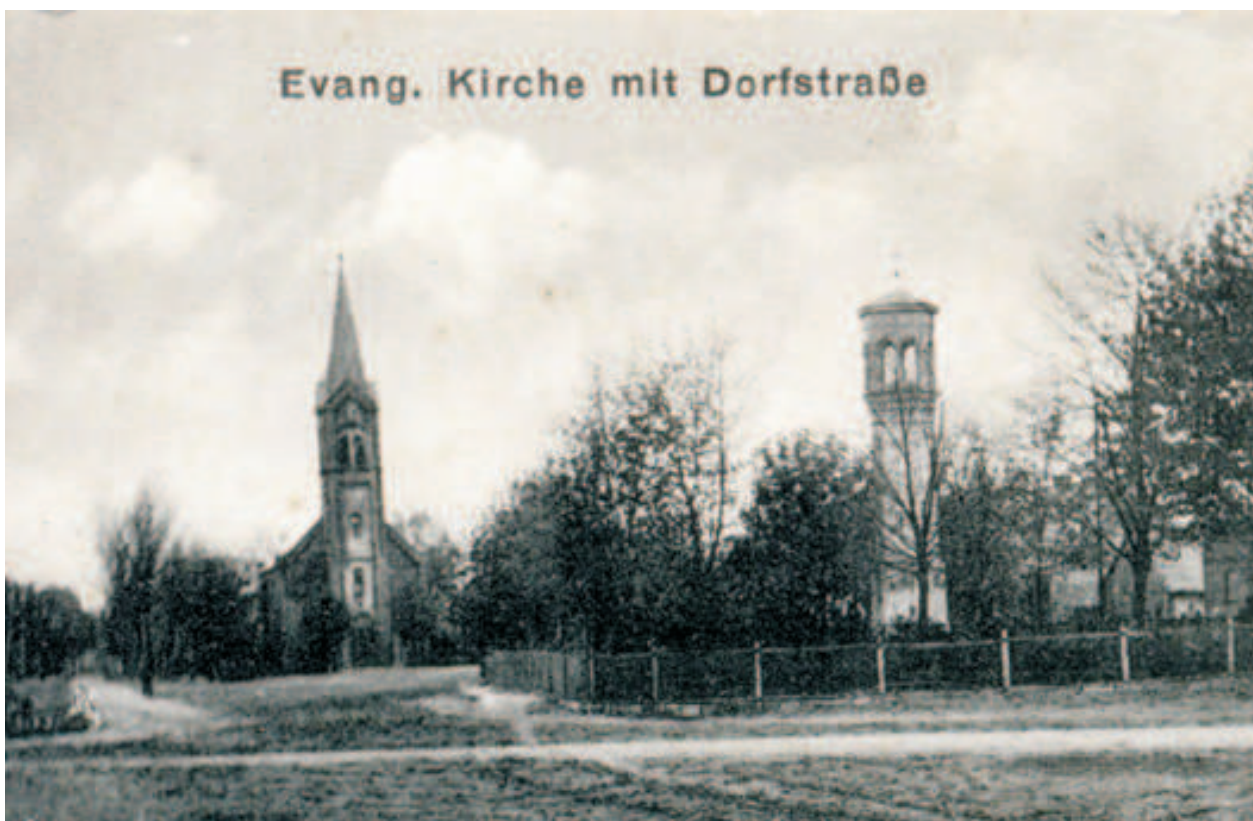
Fot. 11. Karta pocztowa Skrzatusza sprzed 1918 r.