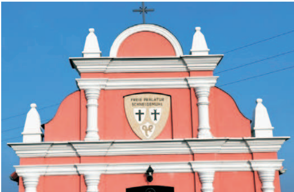
Fot. 8. Herb Wolnej Prałatury Pilskiej