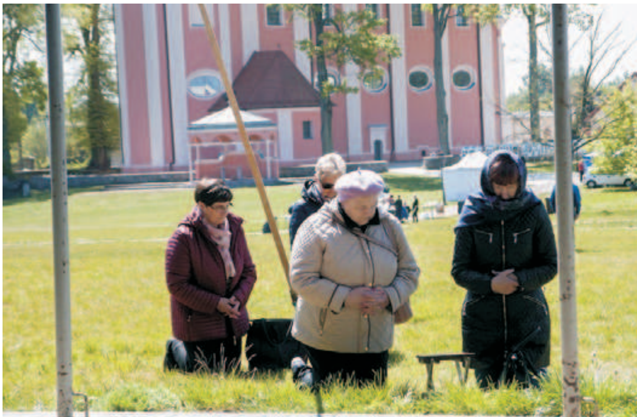
Fot. 21. VII Diecezjalna Pielgrzymka Żywego Różańca „Maryja wskazująca drogę Kościołowi” 11.05.2019 r.