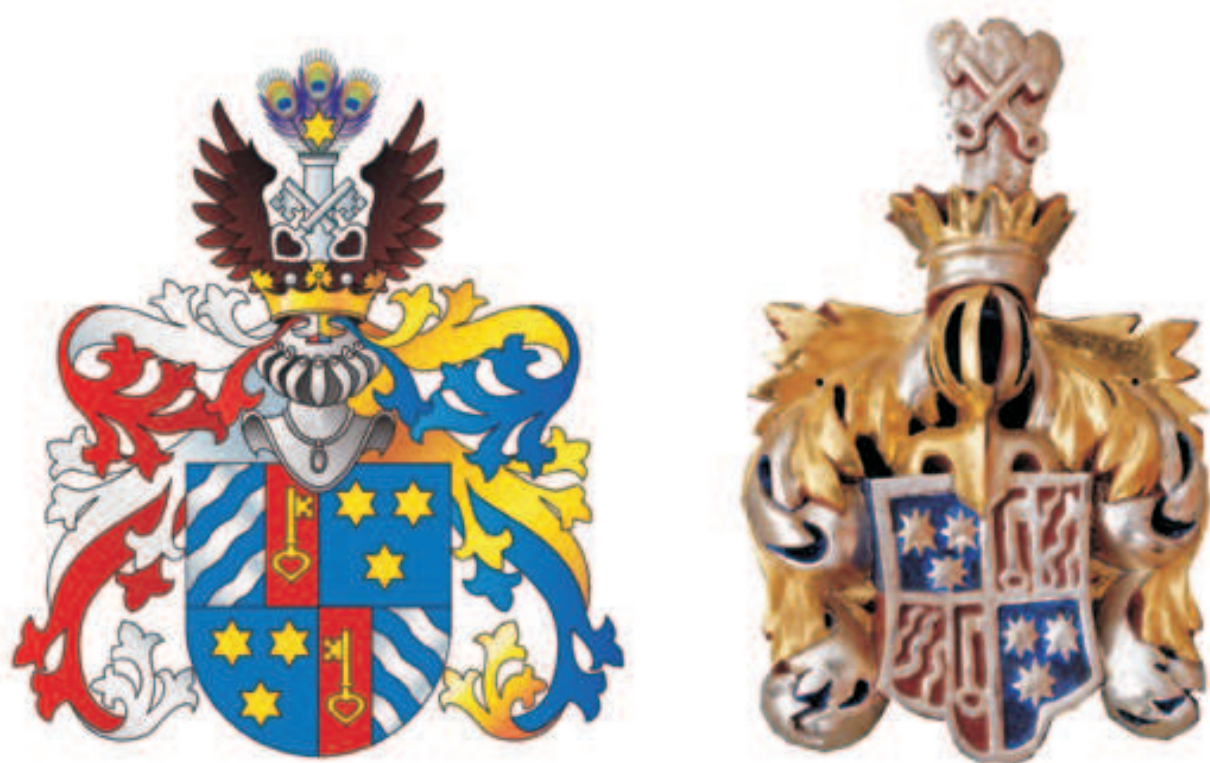
Fot. 17. Herb de Osten-Sacken, z lewej w wersji klasycznej, z prawej w zwieńczeniu ołtarza