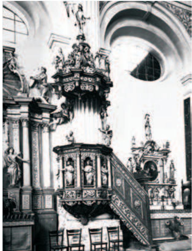
Fot. 4. Ambona skrzatuska 1953 r.