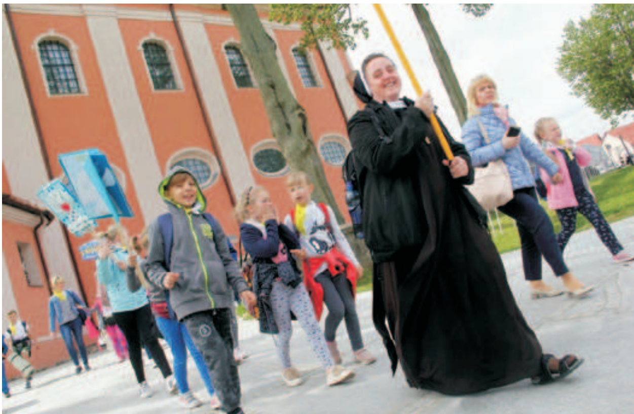
Fot. 23. VII Diecezjalny Dzień Dziecka pod hasłem „Królowa Aniołów” 25.05.2019 r.