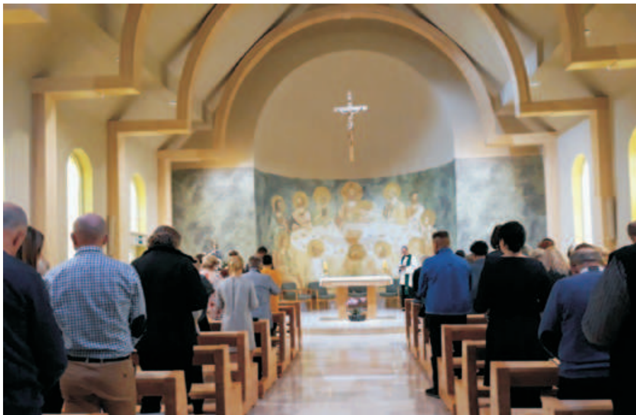
Fot. 31. Rekolekcje dla Niewolników Maryi 4–6.10.2019 r.