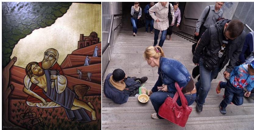
Рисунок 1 – Иллюстративный материал урока

восприятия христианского вероучения (рис. 1); фотографией нашего времени для создания контраста и демонстрации актуальности данной темы в наши дни (рис. 1); раздаточный материал для организации интерактивной работы.