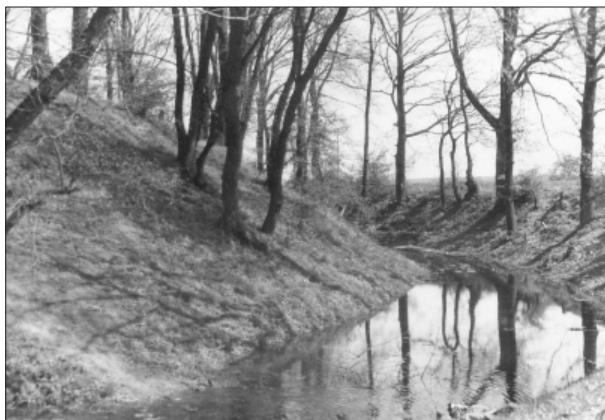
Golenice. Pozostałości grodziska, 1961