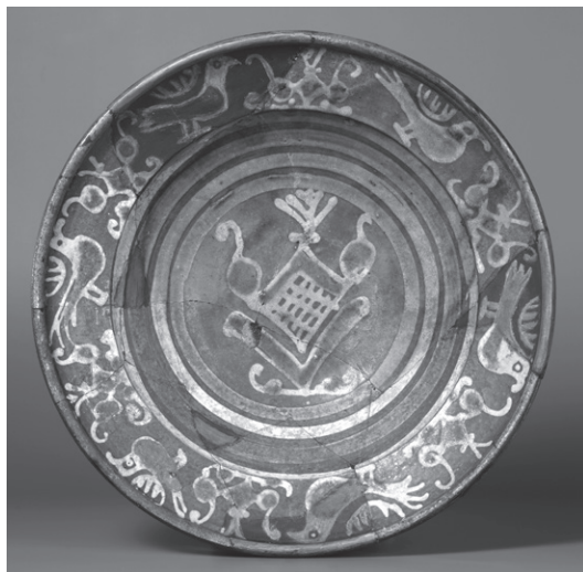
OBR. 7: Pražský hrad, odpadní jímka S, mělká mísa, tzv. berounské malované zboží — inv. č. 472.