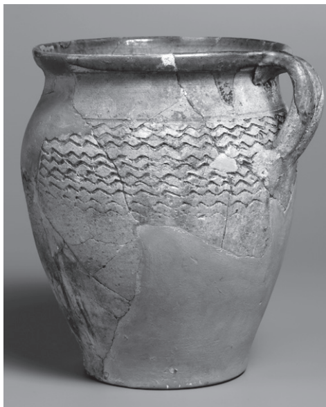
OBR. 3: Pražský hrad, jímka B, hrnec — inv. č. 194.

lezů lze charakterizovat jako průměrný, neobsahující žádný luxusní předmět, a tudíž odpovídající vlastníkovi, kterého lze označit za málo významného člena hradní komunity poslední čtvrtiny 15. až první třetiny 16. století.