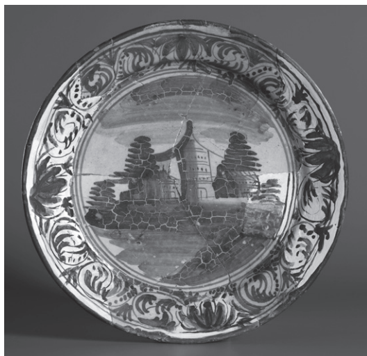
OBR. 8: Pražský hrad, odpadní jímka C, talíř, fajáns — inv. č. 316.

Nálezy skla z valné části náleží k průměrnému renesančnímu sortimentu, ale i zde se vyskytly jednotlivosti patrně zahraniční proveniencie. Jedná se především o nález fragmentu tzv. chalcedonového skla, které se vyrábělo poprvé kolem roku 1500. 26 S ohledem na datování nálezového celku je pravděpodobné, že by se mohlo jednat o výrobek benátských dílen. Mezi vzácně dochovávané tvary náleží hygienické sklo, v tomto případě reprezentované urinalem.