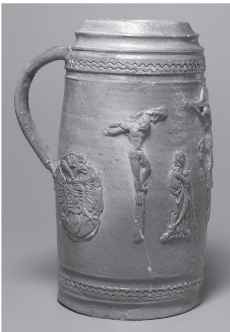
OBR. 5: Pražský hrad, Vikářská ulice čp. 37/IV, kameninová holba — inv. č. 41 (© Jan Gloc).

Datování nálezů z odpadní jímky ve Vikářské ulici čp. 37/IV se opírá o přesně datovaný předmět — pohár s letopočtem 1595 a rozbor keramiky, která pochází z přelomu 16. a 17. století.