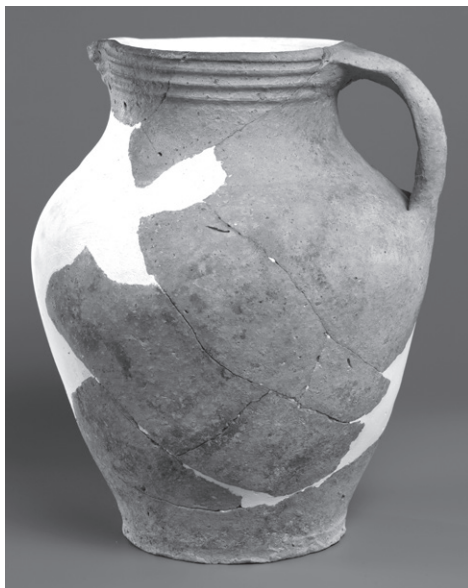
OBR. 2: Pražský hrad, jímka čp. 34/IV, džbán — inv. č. 8.