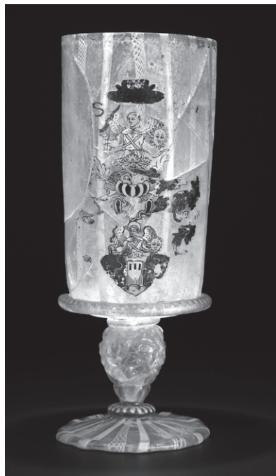
OBR. 6: Pražský hrad, Vikářská ulice čp. 37/IV, skleněný pohár — inv. č. PHV-ds-P-02 (© Jan Gloc).