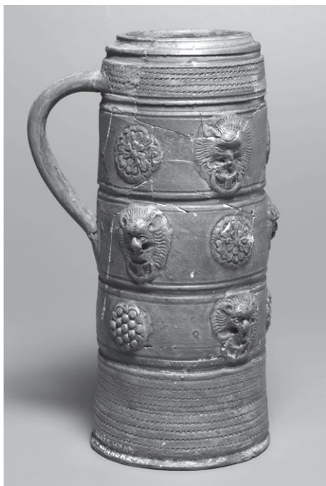
OBR. 4: Pražský hrad, Vikářská ulice čp. 37/IV, kameninová holba — inv. č. 43.