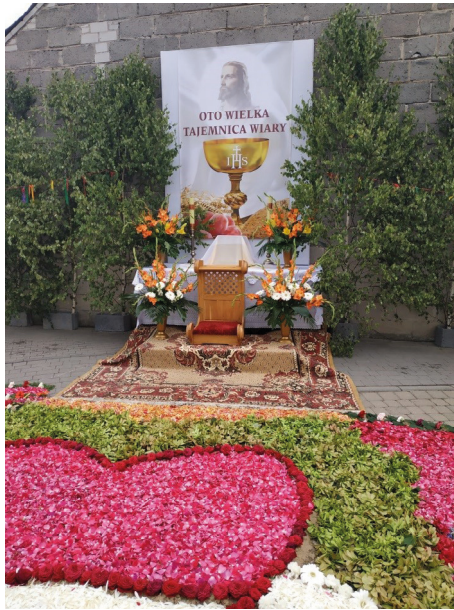
Ryc. 4. Jeden z ołtarzy wraz z dywanem, gotowy na procesję eucharystyczną

Inne przedmioty, które są istotne w kulminacyjnym czasie święta, to atrybuty procesji: krzyż, feretrony chorągwie, poduszki, baldachim, szarfy (Brdów AK) (ryc. 5), jak też ozdoby domów, gdyż na balkonach, w oknach też powywieszane Matkę Boską, Pana Jezusa (Spycimierz SP). Zaliczą się tu również stroje asysty, jak na przykład haftowane, piękne bluzki ze spódnicami są we wzorach czerwonych, spódniczki – białych i zielonych (Brdów AK), kobiece, męskie, dziecięce i alby, krojone, szyte, haftowane przez parafianki (ryc. 5) bądź – w przypadku elementów wełnianych – zamawiane u krawców z zewnątrz (Spycimierz MP). Te stroje są w kościele, uszyte specjalnie dla asyst, żeby było pięknie (Człopy ŁŁ). Do listy przedmiotów dodać należy stroje komunijne dziewczynek sypiących kwiaty lub odświętne sukienki dziewczynek będących przed Pierwszą Komunią, mundury orkiestry i instrumenty, staranne ubrania parafian i gości itp. Zaliczyć je trzeba do SEMIOFORÓW, i wraz z analizowanymi wyżej atrybutami święta – do podtypu WYOBRAZEŃ w typologii K. Pomiana, czyli malowanych, haftowanych, tkanych, wycinanych, rytých, układanych z różnych materiałów, komponowanych z ludzi i przedmiotów, jak w widowiskach [...], komponowanych też z roślin, jak w ogrodach 35 . Użyte przez K. Pomiana słowa haft, układanie z różnych materiałów, kompozycje z roślin zdają się wprost odnosić do strojów asysty i scenografii spycimierskiego święta.