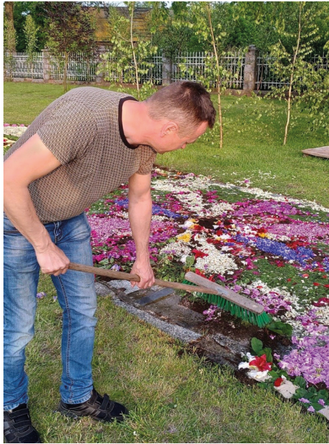
Ryc. 6. Sprzątanie dywanu przez mieszkańców Spycimierza-Kolonii. Boże Ciało po procesji

produkowane podczas przebierania kwiatów, podczas wycinania szablonów itd. Sprzątanie drogi i podwórek przed świętem oraz po święcie to również pozbywanie się ODPADÓW. Jednakże można te działania nazwać oddzielaniem ziarna od plew – oddzielaniem RZECZY od ODPADÓW, by w pierwszej części procesu, doprowadzającego do kulminacji święta, ozdoby wsi składały się z najdoskonalszych przedmiotów, które z pewnością nie mają cech ODPADÓW. Druga część obrzędowego procesu to z kolei segregacja przedmiotów: coś staje się ODPADEM, jak rośliny, a jednak coś zostanie przechowane, jak stroje, drut, drągi, stając się RZECZAMI. Na poziomie analizowanego kodu zaznacza się więc swego rodzaju kontinuum: co było RZECZĄ, podczas święta staje się SEMIOFOREM, a po święcie – znów RZECZĄ. Inna kłammera: coś, co pochodzi z natury i było ODPADEM w procesie gospodarki (kwiaty, drzewka, piasek), stało się CIAŁEM w momencie zainteresowania spycimierzan tymi przedmiotami, by zyskać rangę maksymalnie świętego SEMIFORU w trakcie ozdabiania wsi i przejścia procesji, i w końcu – stać się ODPADEM po zakończeniu święta.