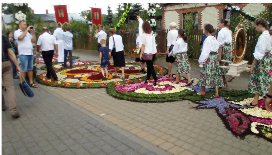
Ryc. 5. Procesja Bożego Ciała idąca po kwiatnych dywanach