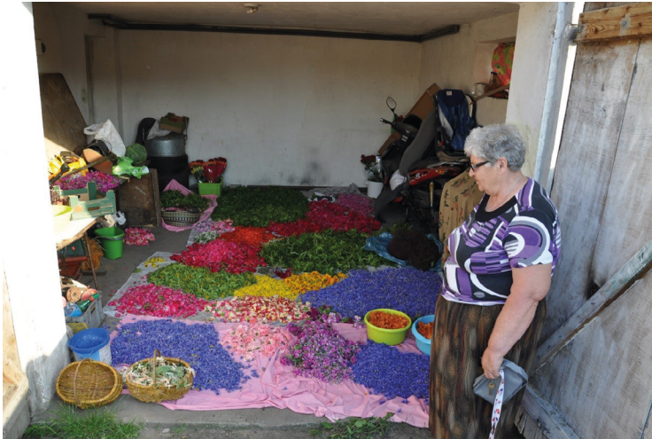
Ryc. 1. Przechowywanie kwiatów zebranych na dywany. Przeddzień Bożego Ciała 26

duże znaczenie, do ich analizy proponuję zastosować teorię K. Pomiana 22 , który ujęcie semiotyczne przeniósł do badań historii, uwzględniające znakowy charakter przedmiotów jako zjawisk posiadających stronę rzeczową i znaczenie. K. Pomian w swojej słynnej i cenionej teorii wyznaczył pięć jednorodnych funkcjonalnie klas przedmiotów, nazwając je CIAŁAMI, ODPADAMI, RZECZAMI, SEMIOFORAMI oraz MEDIAMI 23 . RZECZY według niego „są to maszyny, narzędzia, przyrządy, środki transportu, pomieszczenia, ubiory, uzbrojenie, pożywienie, leki” 24 , a więc stosowane przez spycimierzan narzędzia i środki transportu mieszczą się w tej kategorii. Jak pisze K. Pomian, pierwotną funkcją RZECZY jest to, że ich „przeznaczeniem jest zmienianie wyglądu lub obserwowalnych właściwości bądź też lokalizacji innych przedmiotów” 25 . I również stwierdzimy, że grabki, miotły, szczotki będą służyły do zmiany wyglądu i właściwości drogi, poboczy, podwórek spycimierskich, zaś rower, traktorek, ciągnik – do zmiany lokalizacji obiektów i ludzi.