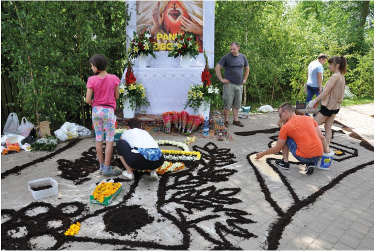
Ryc. 3. Przygotowanie ołtarza i dywanu przez mieszkańców wsi Zieleń. Ranek w Boże Ciało

rębną klasę funkcjonalną, do której należy wszystko, co ludzie znajdują w swoim otoczeniu” 28 – jak spycimierzanie starają się to, co da im natura, przetworzyć w swoje dzieła. „Surowce, dzikie rośliny i zwierzęta, żywioly, takie jak woda, ziemia, powietrze i ogień [...], nim zostaną przetworzone przez człowieka, nie mają żadnego pierwotnego przeznaczenia” 29 . Wyliczenie to, po pominięciu zwierząt i ognia, w pełni odpowiada dziełu spycimierskiemu.