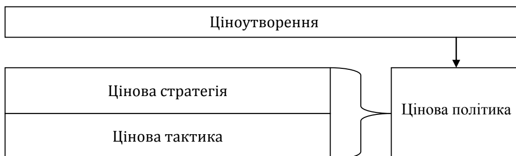
Рисунок 2 – Місце цінової стратегії у процесі встановлення ціни

Цінова стратегія – система довгострокових рішень щодо курсу цінової політики у напрямку встановлення базової ціни. Під курсом розуміється певна послідовність дій: підприємство на основі аналізу факторів ціноутворення вибирає найбільш прийнятний підхід до розрахунку базової ціни товару. Отже, місце цінової стратегії у процесі визначення ціни представлене на рис. 2.