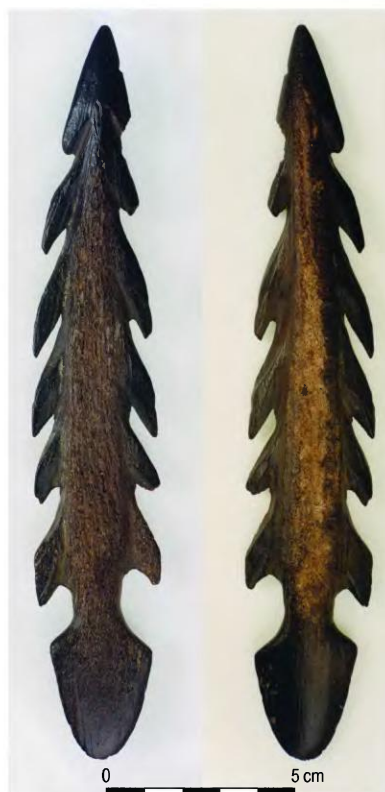
Ryc. 2. Trzcianka, pow. Garwolin. Harpun rogowy. Fig. 2. Trzcianka, distr. Garwolin. Antler harpoon.