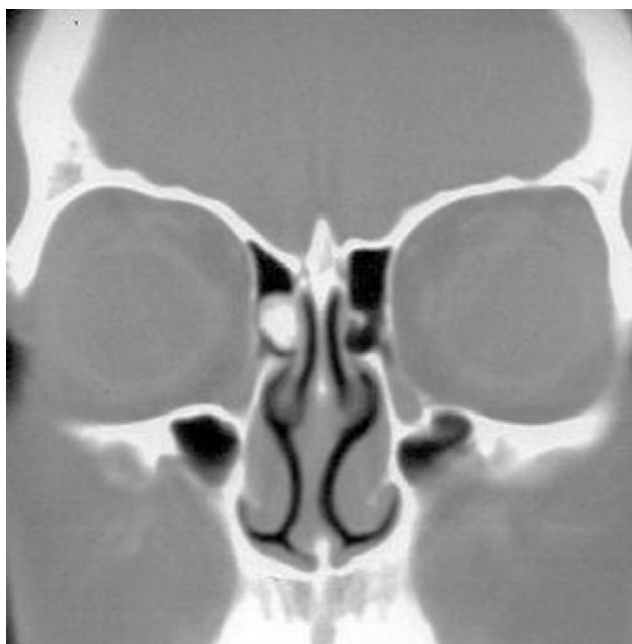
Ryc. 3. Tomografia komputerowa – płaszczyzna czołowa. Kostniak komórek sitowych – strona lewa (chora 3)

tetu Jagiellońskiego w Krakowie, w okresie od maja 2003 do października 2006 roku. W grupie były 4 kobiety i 2 mężczyzn, w wieku od 15 do 52 lat (średnia 36 lat) (tab. I). U wszystkich chorych wykonano przed zabiegiem badanie endoskopowe nosa oraz TK zatok przynosowych (ryc. 1–4). U chorej z kostniakiem zatoki klinowej wykonano dodatkowo badanie MRI. U 3 badanych zmiana była zlokalizowana po stronie prawej, a u pozostałych 3 po stronie lewej. Analizowano objawy, odchylenia od normy w badaniu fizykalnym, wyniki badań obrazowych, obserwacje śródoperacyjne oraz wyniki leczenia. U chorych z kostniakami komórek sitowych wykonywano częściową resekcję małżowiny środkowej,