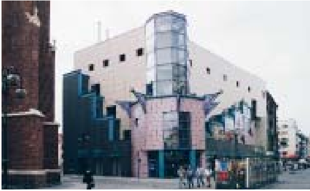
Il. 4. Świdnicka 21 – 23 – Dom towarowy Solpol – (Po lewej kościół pw. św. Św. Doroty, Stanisława i Waclawa)