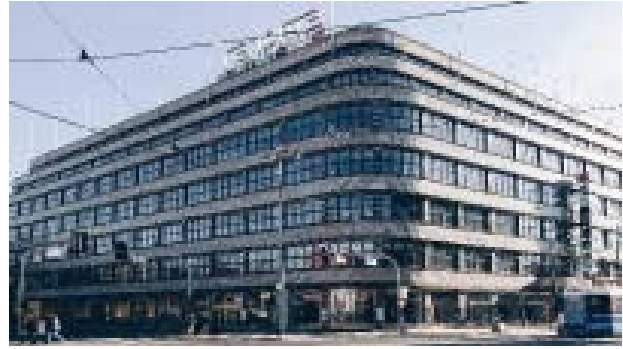
Il. 7. Świdnicka 40, Dom handlowy Renoma.