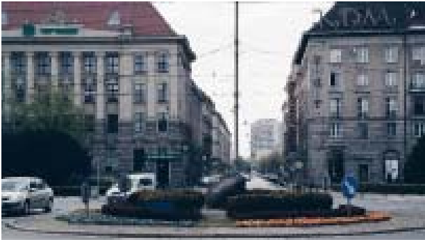
Il. 6. Plac Kościuszki 1 – 13, Kościuszkowska Dzielnica Mieszkaniowa