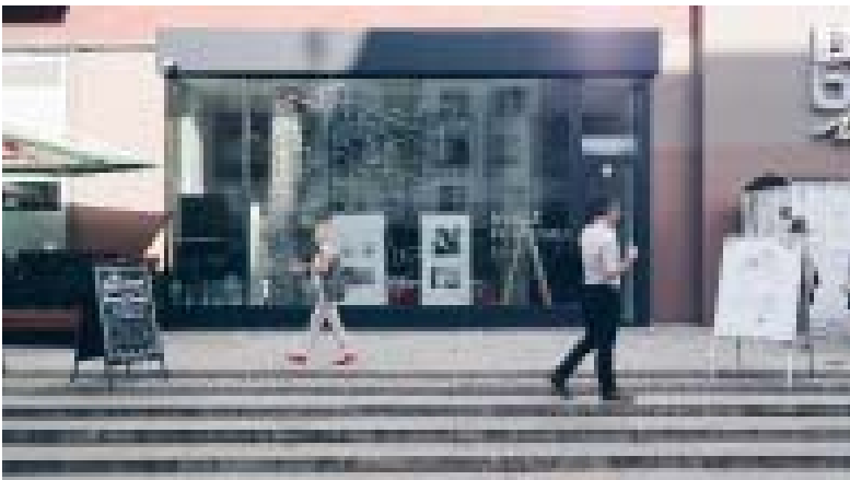
Il. 1. Ulica Świdnicka 8b (Bar Barbara).

Wschodnia pierzeja pomiędzy ulicą Oławską a Kazimierza Wielkiego jest fragmentem kompleksu z lat 1957-1962 zaprojektowanego przez A. i J. Tarnawskich. Jest to architektura nawiązująca do historycznej. Układ budynku nie powtarza historycznego układu zabudowy blokowej. Kompleks ma kształt