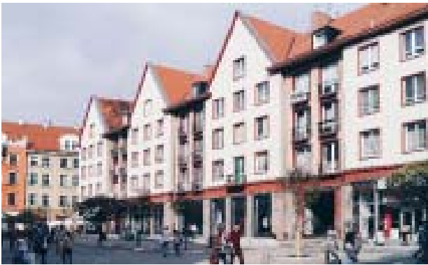
Il. 2. Świdnicka 2 – Zespół mieszkalno-usługowy

Ill. 2. Świdnicka 2 – Apartment and service building.