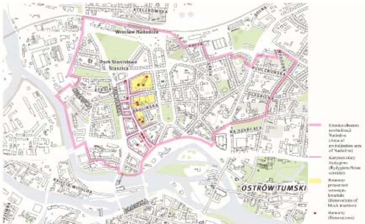
Il. 9. Ulica Rydygiera na Nadodrze. Opracowanie: autor.