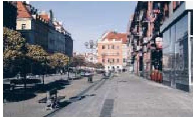
Il. 3. Ulica Świdnicka, widok w stronę rynku.

Ill. 1. Świdnicka 8b (Bar Barbara)