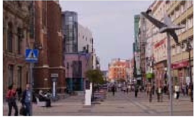
Il. 5. Ulica Świdnicka – Odcinek 2 – Widok w stronę Rynku. Zamknięcie perspektywiczne ulicy stanowi wschodnia pierzeja rynku.

Odcinek trzeci od północy wyznaczają ulice – Heleny Modrzejewskiej oraz Plac Teatralny, a od południa – Podwale. Ma on ok. 190 m długości. Jest to odcinek, na którym są 2 pasy ruchu kołowego raz torowisko tramwajowe. Po obydwu stronach znajduje się chodnik. Architektura tego fragmentu ulicy jest bardzo zróżnicowana, nie tworzy pierzei. Po stronie zachodniej znajduje się gmach Opery Wrocławskiej z XIX wieku, wzniesionej w stylu klasycystycznym. W tle opery znajduje się Narodowe Forum Muzyki, obiekt wybudowany w latach 2012-2015 – jest to monumentalny gmach, w którym znajdują się sale