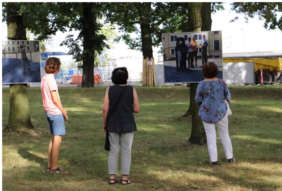
Rys. 15. Grupa widzów oglądająca wystawę pt. Turyści w Ptasim Parku w Mosinie