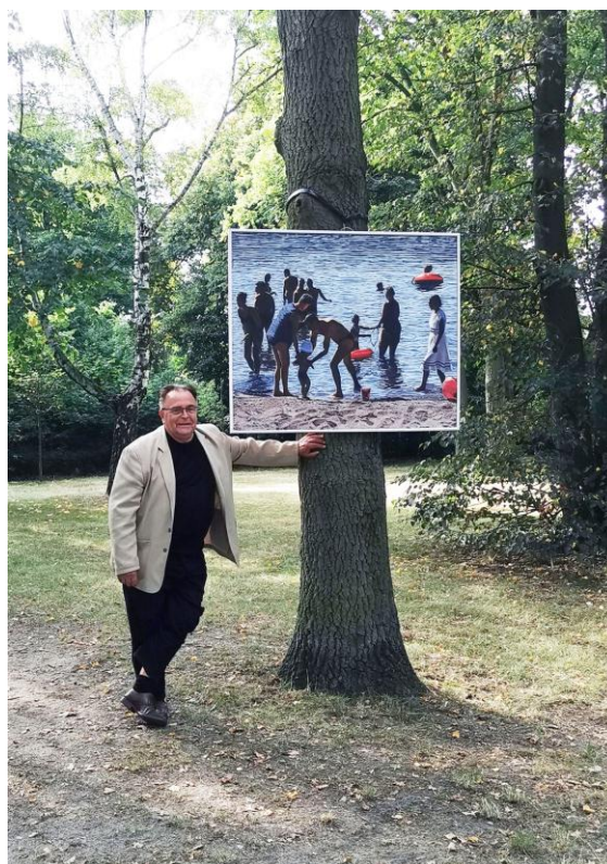
Rys. 11. Andrzej Maciej Łubowski, Plaża II , 100 × 120 cm, olej, płótno, 2020 r., ekspozycja na wystawie w Ptasi Parku w Mosinie k. Poznania, 2021 r.

sytuacją zauważoną na drzewach. Otwarcie wystawy odbyło się przy współudziale zaproszonych gości i przypadkowo przechodzących osób. Był pogodny sierpniowy dzień, ludzie pojawili się z dziećmi, były też starsze osoby oraz rowerzyści, którzy przejeżdżając, zatrzymywali się lub zawracali, by przyjrzeć się umocowanym na drzewach obrazom. Byli także seniorzy z chodzikiemami rehabilitacyjnymi. Prezentowane obrazy namalowane w konwencji realizmu fotograficznego są wyraziste i z tego powodu czytelne również z większej odległości. Dwa z nich pokazują grupę ludzi na plaży. Obrazy Plaża I i Plaża II są namalowane w zimie 2020 r., były reakcją na potrzebę normalnych kontaktów międzyludzkich odebranych przez lockdown. Stąd pojawiło się wiele postaci namalowanych pod światło na tle nasłonecznionej plaży i wody. Można powiedzieć, że traktowały o tęsknocie za tym, czego wtedy nie było. Obrazy Promenada I i Promenada II , Turyści I i Turyści II zostały namalowane w 2021 r., przedstawiają grupy ludzi w pejzażu miejskim, powstały z materiałów przygotowanych podczas wakacji w 2020 r. po zelżeniu restrykcji pandemicznych. Pozostałe małe obrazy z cyklu Przy Oknie są zaprezentowaniem prac, które po wprowadzeniu lockdownu zostały interpretowane jako traktujące o zamknięciu.