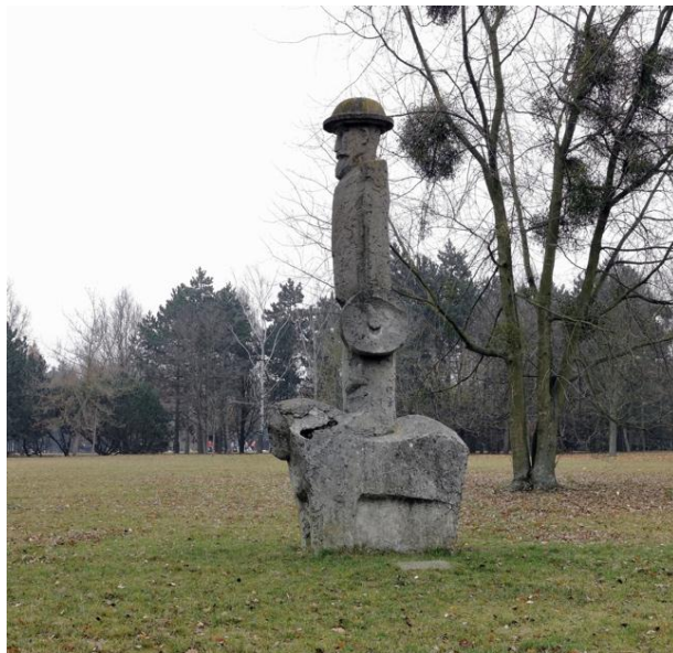
Rys. 8. Tadeusz Dobosz, Don Kichot , beton, rzeźba niekompletna, przez ubytki widać zbrojenie, 1969 r., fot. z 2021 r.