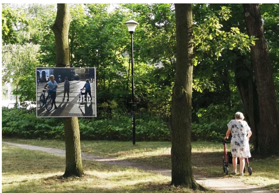
Rys. 17. Relacja postaci z obrazu z osobą przechodzącą ścieżką spacerową w Ptasim Parku w Mosinie

Drugie podejście do eksponowania dzieł sztuki to wykorzystanie przestrzeni terenu zieleni miejskiej w Ptasim Parku w Mosinie k. Poznania do prezentowania w ramach Nowych form ekspozycji malarstwa. Jest to stworzenie galerii bez ścian,