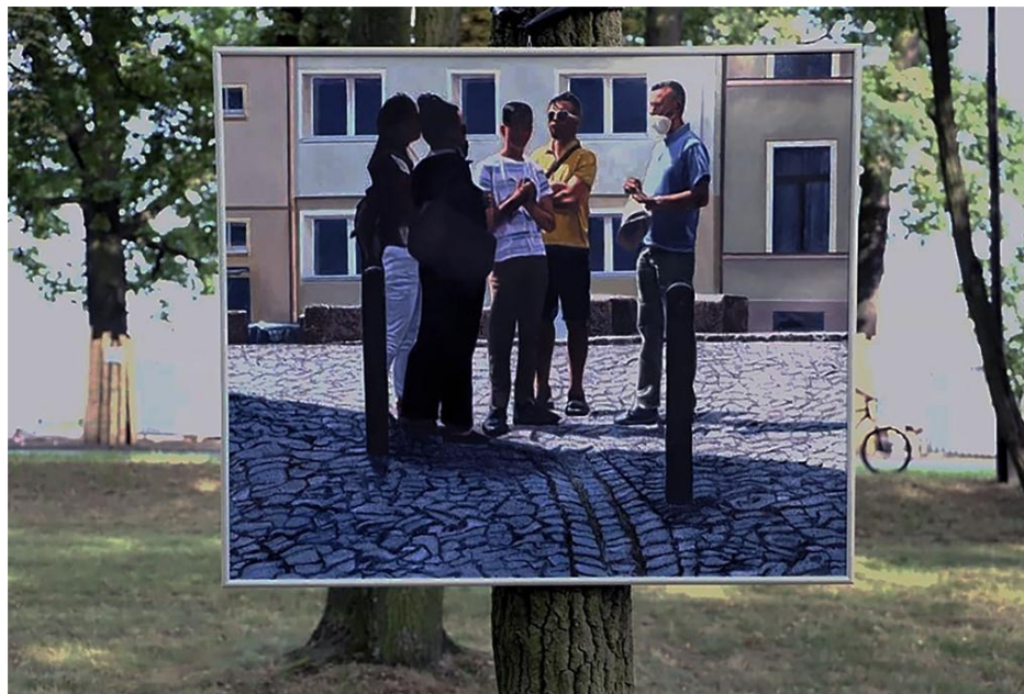
Rys. 14. Andrzej Maciej Łubowski, Turyści I , 100 × 120 cm, olej, płótno, 2021 r.