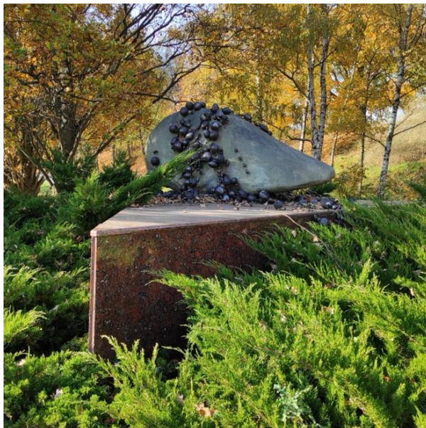
Rys. 4. Andrzej Banachowicz, Ziarno. Epitafium życia , granit, piaskowiec, ceramika, 2009 r., fot. z 2021 r.