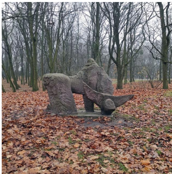
Rys. 3. Anna Rodzińska-Iwańska, Zwierzę , beton kolorowy, 1969 r., fot. z 2021 r.