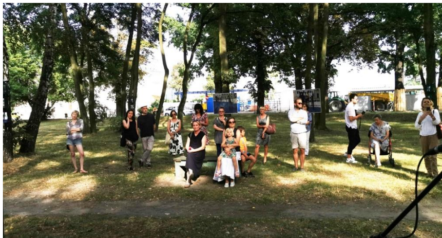
Rys. 16. Publiczność na wystawie pt. Turyści w Ptasim Parku w Mosinie