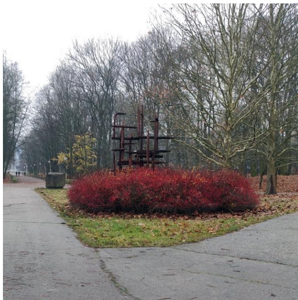
Rys. 5. Andrzej Pukacki, Kompozycja , metal, rzeźba niekompletna, obsadzona krzewami, 1970, fot. z 2021 r.