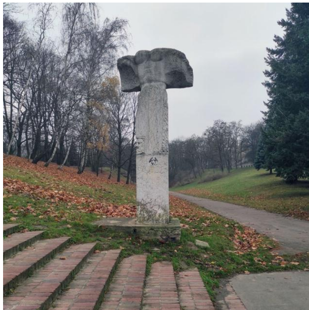
Rys. 6. Józef Kaliszan, Zryw , trawertyn, 1969 r., fot. z 2021 r.