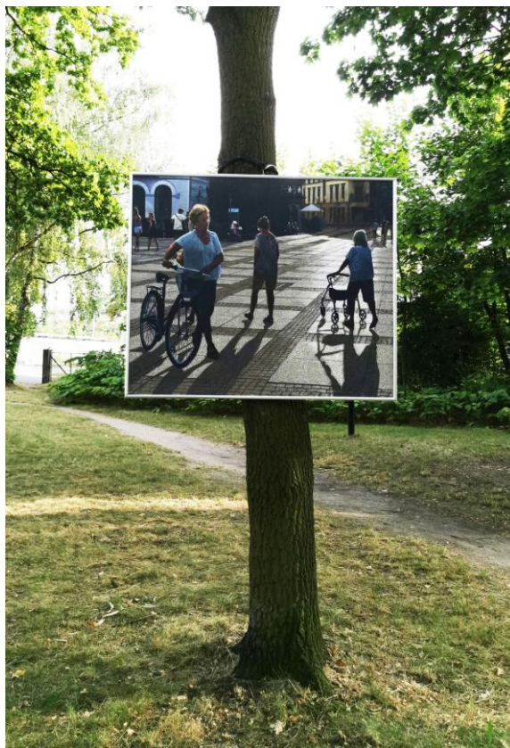
Rys. 12. Andrzej Maciej Łubowski, Promenada I , 100 × 120 cm, olej, płótno, 2021 r.

Właśnie ludzie zgromadzeni przy obrazach weszli w relację z tymi na obrazach. Można było prześledzić, jak postacie z obrazów przypominają niekiedy ich odbiorców w parku, także stanowiących grupę różnorodnych ludzi w tym miejscu rekreacji i spacerów. Nastąpiło przemieszczenie tego, co wydarzało się w iluzyjnej przestrzeni obrazów, z realną przestrzenią parku. Najbardziej sprawdziły się obrazy przedstawiające ludzi w pejzażu miejskim, ponieważ park jest terenem zieleni miejskiej i ludzie, którzy przyszli na wystawę, weszli do parku właśnie z miejskiego terenu zabudowanego. To wciągnięcie widoków miejskich wraz z ludźmi namalowanymi na obrazach w teren parku koresponduje z przybyłą do niego publicznością oglądającą wystawę. Nastąpiło sprzężenie pokazujące, że wystawa jest w pewnym sensie o nich i dla nich. Jest jeszcze jeden istotny problem związany z tą ekspozycją: jest to wyjście naprzeciw odbiorcy, co ma duże znaczenie w przybliżeniu sztuki do mniej wyrobionego odbiorcy, a także umożliwienie swobodniejszego obcowania ze sztuką osób niepełnosprawnych i seniorów.