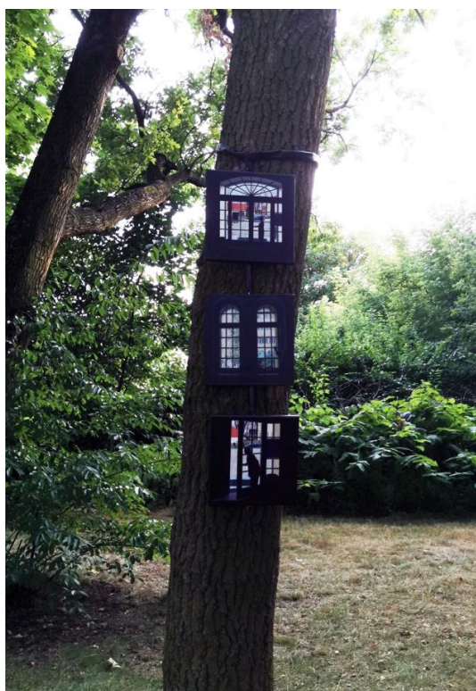
Rys. 13. Andrzej Maciej Łubowski, Z cyklu Przy oknie , trzy prace, 30 × 30 cm, olej, płótno, 2018 r.

Przedstawione zostały dwa różne podejścia do eksponowania sztuki na terenach zieleni miejskiej. Jedno z nich dotyczy eksponowania rzeźby plenerowej w dużym, 100-hektarowym Parku Cytadela w Poznaniu, mającym bogatą tradycję historyczną związaną z losami państwa polskiego i przemianami politycznymi wpływającymi na jego genezę i kształt. Z tych przyczyn wynikają perturbacje, które komplikują długotrwałe eksponowanie dzieł, ponieważ zmieniają się uwarunkowania ideologiczno-polityczne mające wpływ na ich formę i wymowę. Także zmieniające się prawie co dekadę tendencje we współczesnej sztuce wpływają negatywnie na odbiór tych dzieł nawet w aspekcie muzealnym. Jeżeli w danym czasie panują jakieś tendencje w sztuce, to często tylko powierzchowne przyjęcie ich postulatów jest miarą pozytywnych ocen. Okazuje się, że czas je weryfikuje i ostają się tylko autentyczne wartości. Doniosłym elementem trwałości dzieła rzeźbiarskiego jest materiał, z którego zostało ono wykonane, dotyczy to zwłaszcza czasów komunistycznych, które cechowały się brakiem środków na takie przedsięwzięcia.