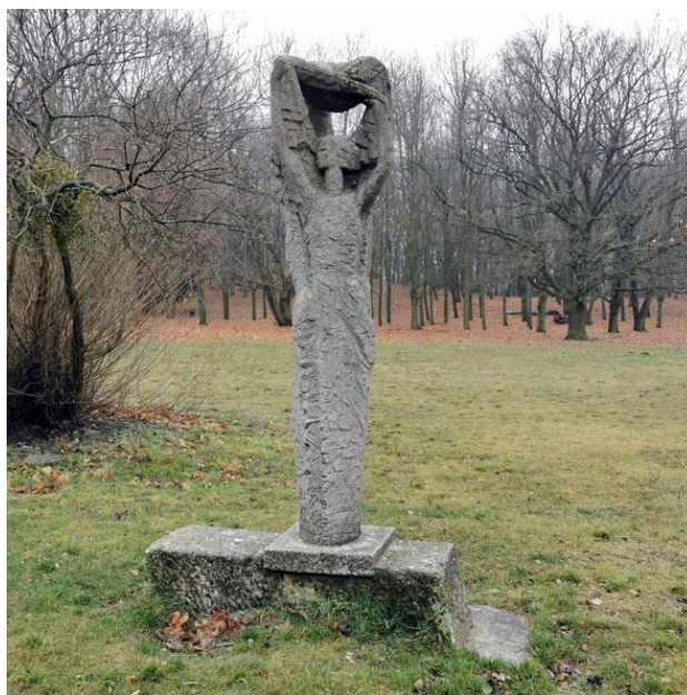
Rys. 7. Antoni Szulc, Kompozycja , beton, 1969 r., fot. z 2021 r.