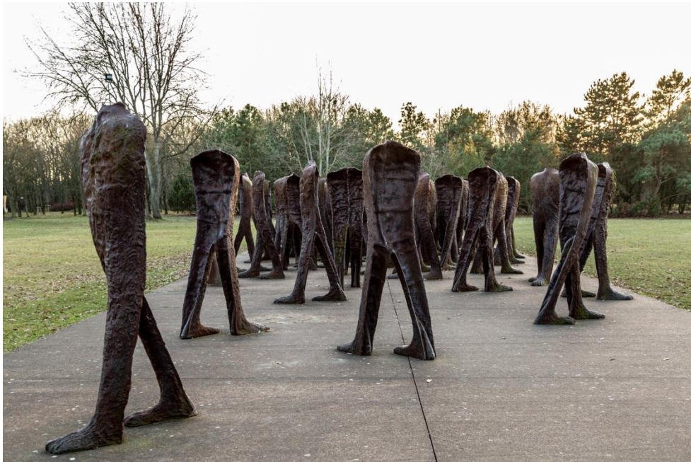
Rys. 9. Magdalena Abakanowicz, Nierozpoznani, instalacja z odlewów żeliwnych, betonowa płyta, 2002 r., fot. z 2021 r.