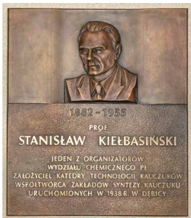
Fot. 1. Tablica pamiątkowa, której autorem jest łódzki rzeźbiarz prof. Kazimierz Karpiński

Ministerstwa Finansów za najlepszy projekt wykorzystania etanolu. Projekt uruchomienia wytwarzania syntetycznego kauczuku butadienowego nie doczekał się jednak realizacji w warunkach wojennych. W okresie I wojny światowej dr S. Kiełbasiński pracował w Zakładach „RUSSKO-KRASKA”, ulepszając syntezę leku Salwarsan, a następnie, w wyniku wprowadzenia udoskonaleń, oryginalną, opatentowaną w kilku krajach (USA i Niemcy w 1929 roku, a następnie we Francji, Anglii, Polsce i Związku Radzieckim) metodę syntezy nietoksycznego preparatu arsenobenzenowego typu Neosalwarsan, wdrażając ją do produkcji.