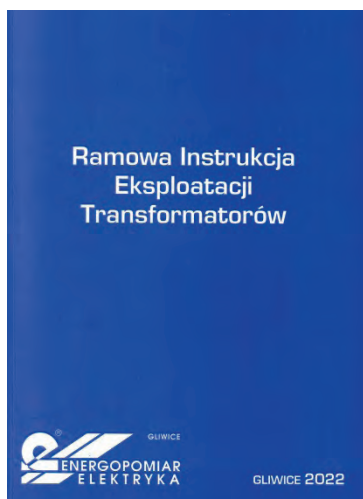
Rys. 1. Okładka RIET 2022

i Działu Transformatorów i Izolacji wszedł w skład tej Spółki i nadal pracuje nad rozwojem i wdrożeniem nowych metod diagnostyki transformatorów. ZPBE Energopomiar-Elektryka rozwinął kompleksową diagnostykę transformatorów opartą na badaniach oleju DGA. Aktualne osiągnięcia w tym temacie wprowadził do zmodernizowanej RIET 2022.