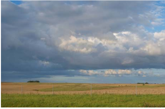
Il. 1. Widok obszaru dla którego wydana została decyzja o warunkach zabudowy oraz mapa analizy.