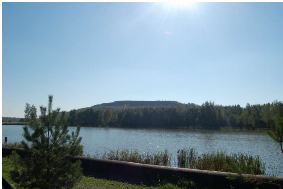
Fot. 1. Zwałowisko przy ul. Oficerskiej w Łędzinach [oprac. aut.] Phot. 1. Waste dump at Oficerska street [auth. study]