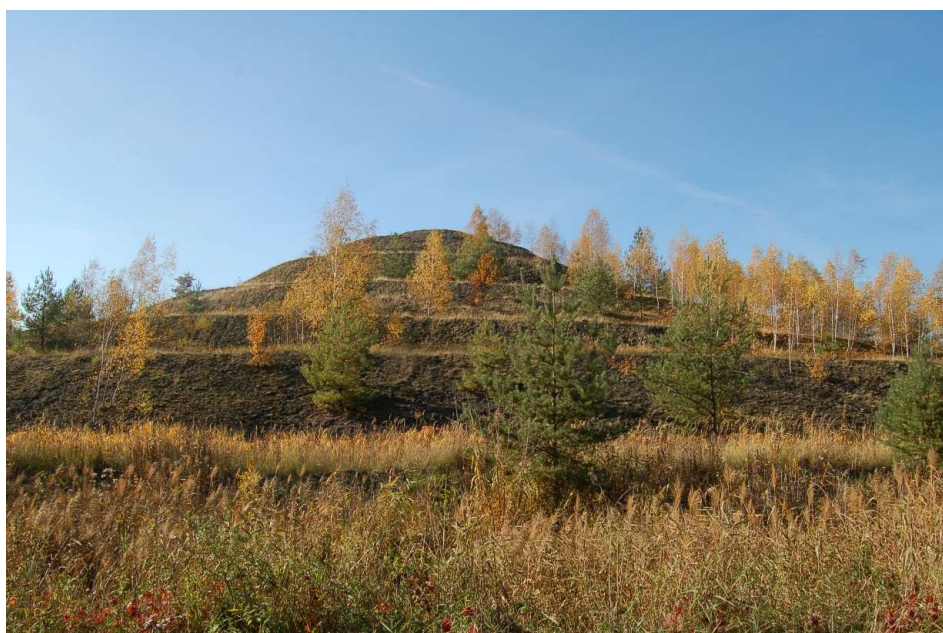
Fot. 2. Zwałowisko „Paciorkowce” w Bieruniu [oprac. aut.] Phot. 2. Waste dump `Paciorkowce` in Bieruń [auth. study]