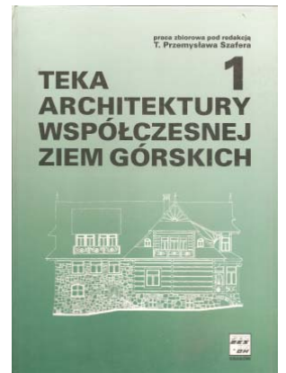
Il. 5. okładki książek T.P. Szafera oraz okładka Teki Ziem Górskich 1. red. T.P. Szafer.