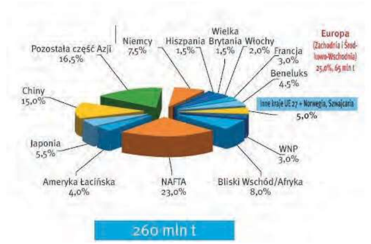
Fig. 1. The volume of plastic production in the world<sup>3)</sup> Rys. 1. Wielkość produkcji tworzyw sztucznych na świecie<sup>3)</sup>

wraz z Norwegią i Szwajcarią wyniosło w 2008 r. 52,5 mln t. Jak widać produkcja ta jest na świecie wciąż rosnąca i proporcjonalna do liczby ludności, chociaż w Europie ten przyrost nie ma takiej zależności. Celowo przytoczono dane z przeszłości, by ukazać tendencję wzrostu tych zależności. W 2021 r. produkcja tworzyw sztucznych wynosiła już ponad 390 mln t i była o 4% wyższa niż rok wcześniej. Globalnym liderem tego rynku są Chiny, z udziałem w produkcji światowej na poziomie prawie 1/3.