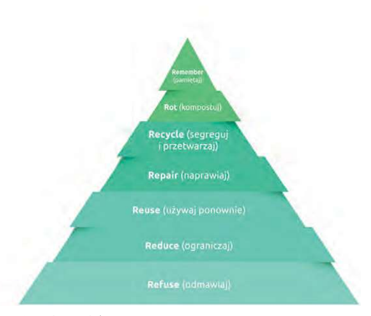
Fig. 3. The 7R rule<sup>8)</sup> Rys. 3. Zasada 7R<sup>8)</sup>

wyrażonych następującymi hasłami: refuse, czyli odmawiać, a więc nie godzić się na zbędne zanieczyszczenia, odmawiać rozpowszechniania papierowych ulotek reklamowych, opakowań jednorazowych, produktów produkowanych ze szkoda dla środowiska i generujących zanieczyszczenia; reduce, czyli ograniczać, co dotyczy ograniczenia liczby posiadanych przedmiotów, a otaczać się jedynie niezbędnymi przedmiotami; reuse oznacza używać ponownie, poprzez niestosowanie jednorazowych rozwiązań, stosowanie opakowań wielokrotnego użytku i takich przedmiotów, jak np. termosy; recycle oznacza segregować i przetwarzać, a więc dbać o to, by rzeczy zbędne zostały ponownie przerobione, a odpady odpowiednio posegregowane; rot, inaczej kompostować, czyli dzięki kompostowaniu organicznych odpadów otrzymywać naturalny nawóz. Z czasem dodano dwie kolejne zasady: repair, co znaczy naprawiać, a dotyczy łatania ubrań, naprawiania butów oraz sprzętów, i remember, czyli pamiętać o codziennych wyborach, które mają wpływ na środowisko naturalne oraz o uprzednio sformułowanych zasadach<sup>7)</sup>. Są one nadal rozwijane, toteż pewnie niebawem przybędą kolejne.