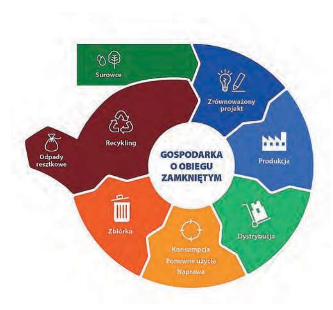
Fig. 4. Circular economy diagram<sup>9)</sup>