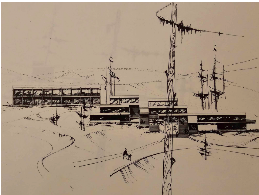
Rys. 7. Projekt elewacji południowej centrum usługowego; źródło: [3]