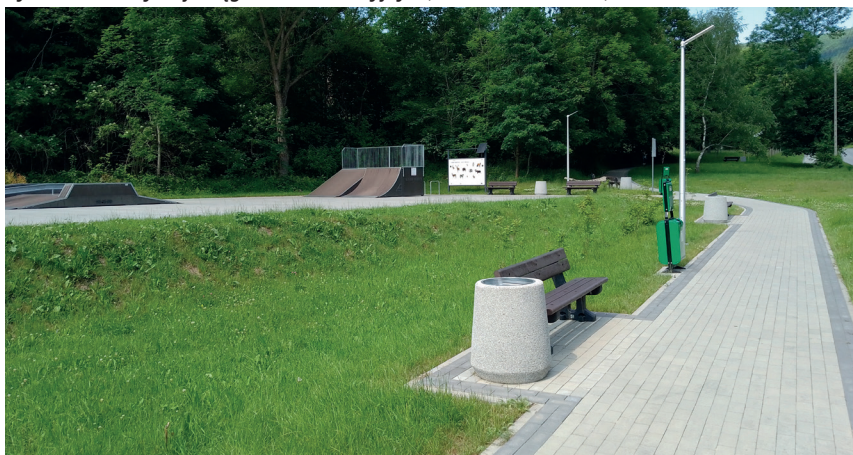
Rys. 6. Skatepark i nowe trakty pieszce przy ul. Wczasowej; źródło: fot. autora, 2022 r.

Do kompleksowych działań modernizacyjnych już w XXI w. należy zaliczyć przykłady obiektów „Dom Nauczyciela” i „Kolejarz”. Modernizacja objęła tu zarówno elewacje, jak i układ funkcjonalny budynków. Oba zachowały swoją pierwotną bryłę, a zmiany pozwoliły dostosować je do współczesnych standardów. Pierwotna modernistyczna forma budynków oraz zastosowanie współczesnych materiałów i rozwiązań technicznych, również w projektowaniu wnętrza, tworzą wrażenie harmonijnej całości. Pomimo drobnych zmian, jak np. likwidacja