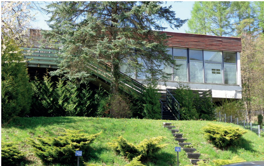
Rys. 10. Budynek poczty – ostatni oryginalny pawilon centrum usługowego; źródło: fot. autora, 2017 r.