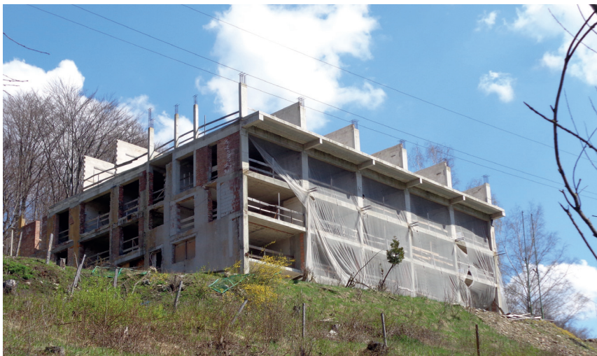
Rys. 4. Dom wczasowy „Juhas” w trakcie modernizacji