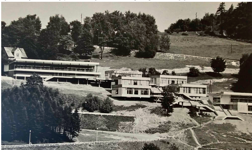
Rys. 8. Centrum usługowe w momencie zakończenia budowy

nie była przypadkowa, gdyż był położony centralnie w osiedlu, a jednocześnie łatwo dostępny dla ruchu turystycznego na trasie Wisła – Równica. Jak głosi uzasadnienie sądu konkursowego SARP, zaletą projektu było „dyskretne umieszczenie zespołu usług komunalnych” [1]. Znajdowały się tam funkcje niezbędne dla działania wczasowego miasteczka, takie jak: restauracja, kawiarnia, poczta, sklepy: ogólnospożywczy oraz z art. ogólnoprzemysłowymi, zakłady: szewski, fotograficzny, fryzjerski, wypożyczalnia sprzętu sportowego, „Klub” (kino, dom kultury, biblioteka) [2, 3]. W latach 90. XX w. centrum handlowo-usługowe zostało sprywatyzowane. Część kulturalna – Klub – została przebudowana na obiekt apartamentowy o „tradycyjnych”, kontrastujących z modernizmem formach architektonicznych (rys. 9.). Reszta założenia stała się obiektem mieszkalnym, który przypadkowo dzielono na części i adaptowano na potrzeby