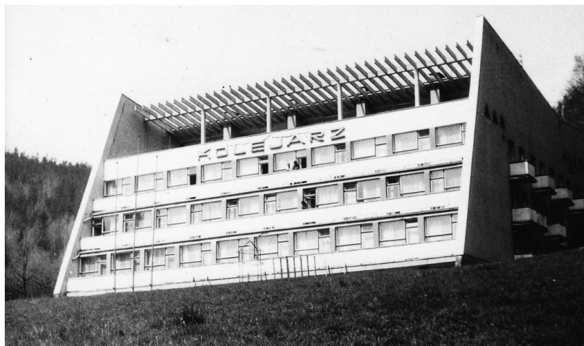
Rys. 2. Dom wczasowy „Kolejarz” w jego pierwotnej formie; źródło: fot. autora, lata 80. XX w.