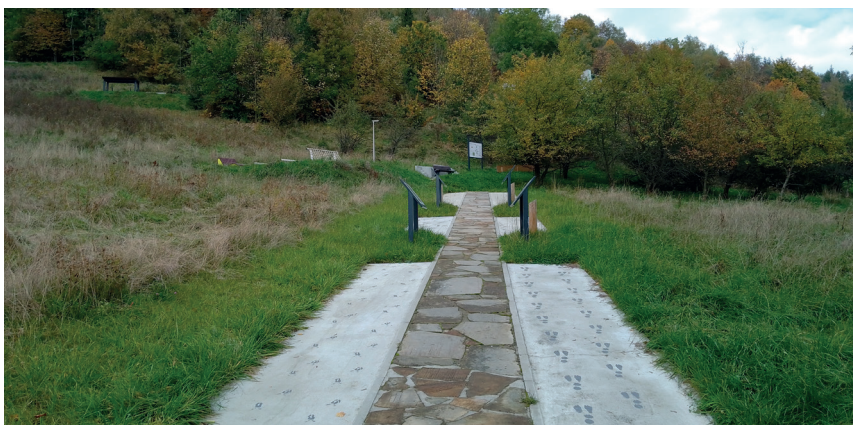
Rys. 5. Rewaloryzacja ciągów komunikacyjnych