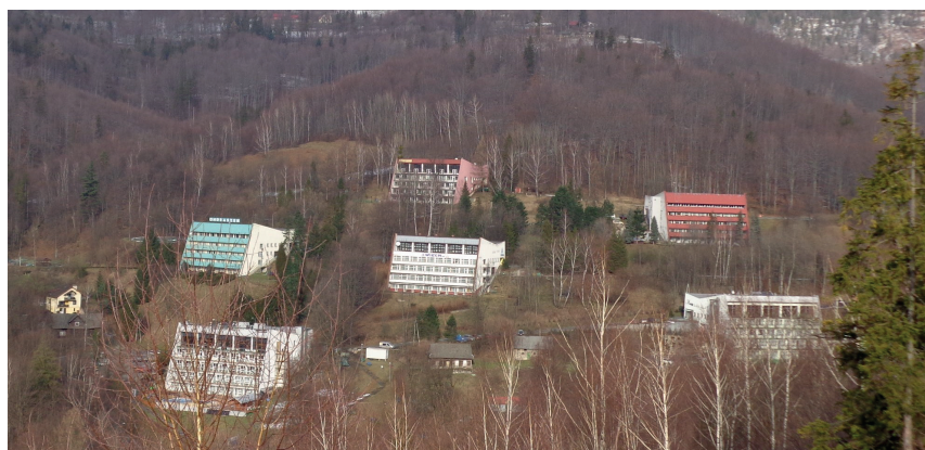
Rys. 3. Zespół 6 obiektów tzw. blokowych, jeszcze w integralnej formie; źródło: fot. autora, 2018 r.

przyczynę problemów osiedla na wszystkich etapach jego funkcjonowania. Zmiany po 1989 roku, tzn. upadku PRL i przejściu Polski do gospodarki rynkowej, spowodowały, że wiele ośrodków wypoczynkowych zmieniło swoją strukturę i funkcjonowanie. Nowa epoka przyniosła dezintegrację zespołu jako funkcjonalnej całości. Przekształcenia własnościowe przybrały charakter żywiołowy. Jako że domy wczasowe należały do różnych przedsiębiorstw państwowych, poszczególne fragmenty całości prywatyzowano oddzielnie i w różnym czasie, tworząc nowe spółki lub oddając w ręce prywatnych inwestorów.