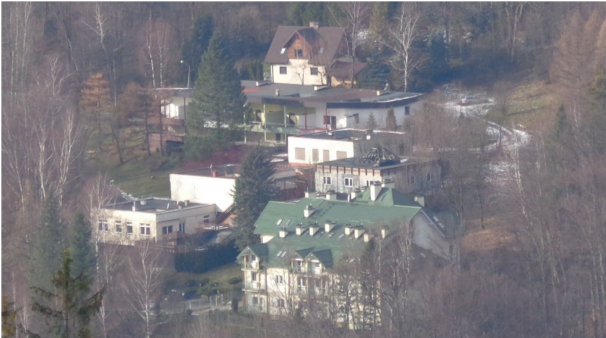
Rys. 9. Centrum usługowe po działaniach prywatyzacyjnych