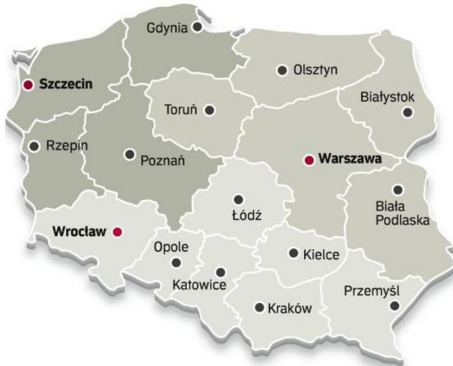
Pict. 2. Reach of action appointed Customs Chambers in Poland