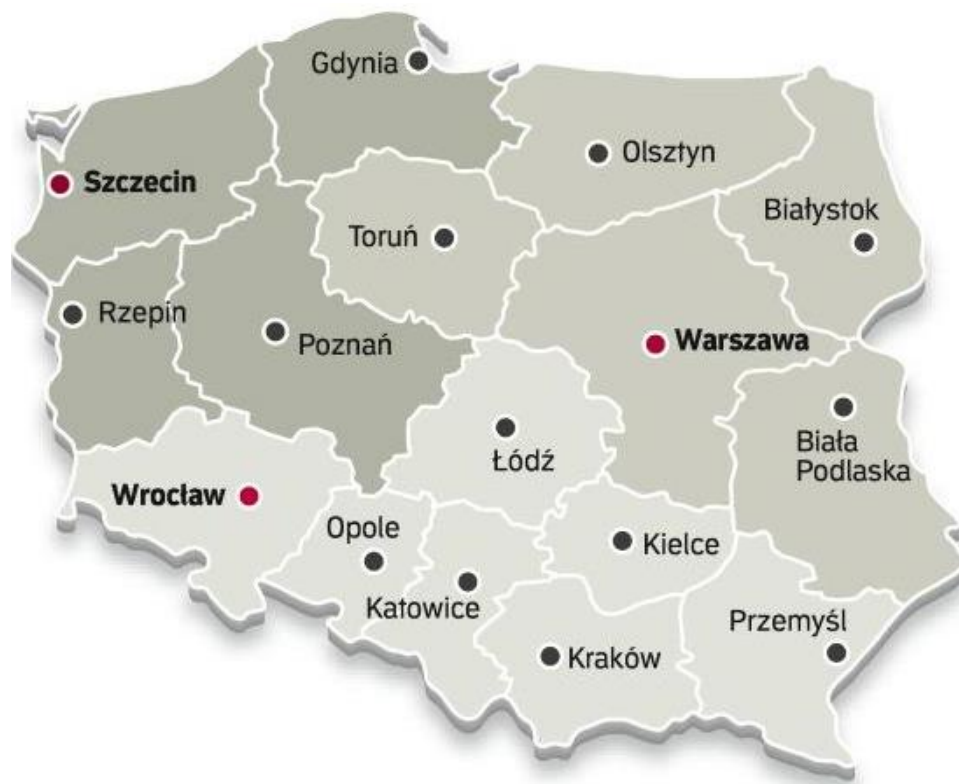
Rys. 2. Zasięg certyfikacji wyznaczonych Izb Celnych w Polsce