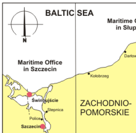
Mapa 1. Usytuowanie Portu w Szczecinie.

Znajduje się w odległości ok. 69 km na południe od Zatoki Pomorskiej i ok. 11 km od Zalewu Szczecińskiego [25,26,27,28,29]. Na mapie nr 1, przedstawiono usytuowanie Portu w Szczecinie.