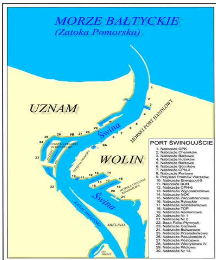
Mapa 2. Rozmieszczenie kanałów i nabrzeży Portu w Świnoujściu [27-28].

Na mapie nr 2 przedstawiono rozmieszczenie kanałów i nabrzeży Portu w Świnoujściu.