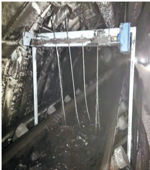
Rys. 3. Czujnik obecności urobku

Czujnik ten pozwala w sposób mechaniczny określić stan obecności lub nieobecności urobku w kluczowych miejscach na trasie odstawy urobku oraz przekazać tę informację do sterownika lokalnego. Dodatkowo w sterownikach lokalnych w celu rozróżnienia innowacyjnego trybu pracy od pozostałych nazwano go trybem „inteligentnym”.