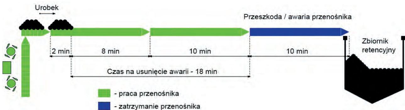
Rys. 2. Idea sterowania odstawą urobku w automatycznym trybie „inteligentnym”

Z poczynionych obserwacji wyciągnięto następujące wnioski: