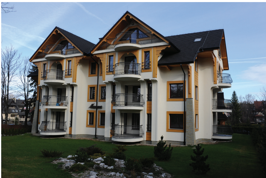
Il. 35. Pensjonat „Manru” przy ul. Grunwaldzkiej (2011–2012, proj. S. Topór).