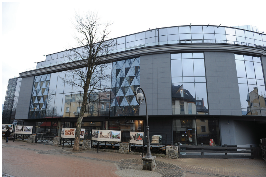
Il. 41. Centrum Handlowe „Krupówki” przy ul. Krupówki (2012–2017, proj. A. i R. Rafaczowie). Fot. Zbigniew Moździerz, 2017. Zbiory prywatne