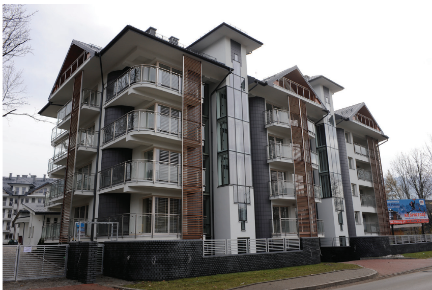
Il. 37. Apartamentowce „Stara Polana” przy ul. Nowotarskiej (2007–2008, proj. S. Topór). Fot. Dawid Możdziej, 2009. Zbiory prywatne