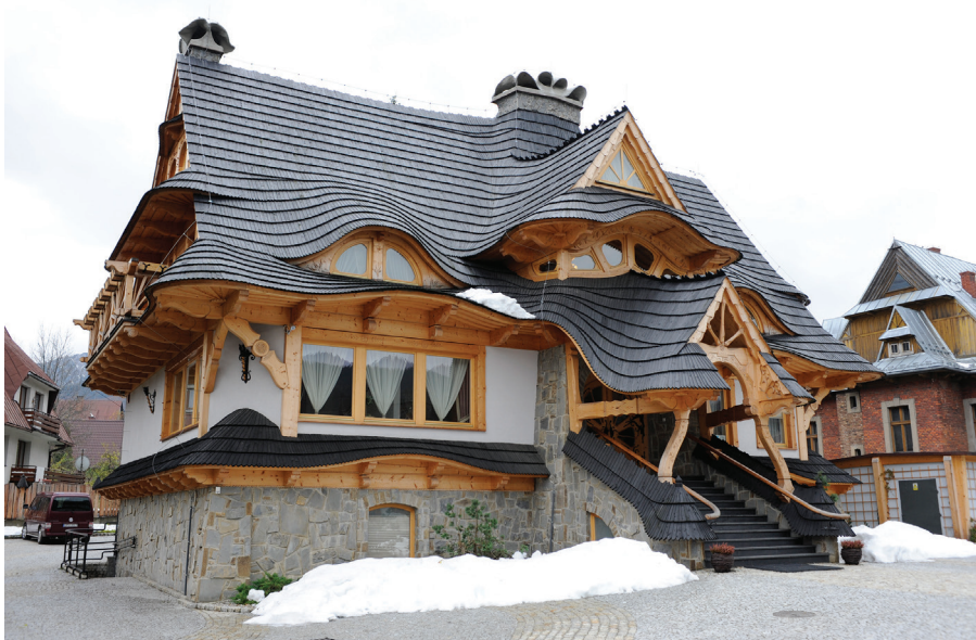
Il. 34. Willa „Kominiarski Wierch” przy ul. Kościeliskiej (2008–2009, proj. S. Pitoń).