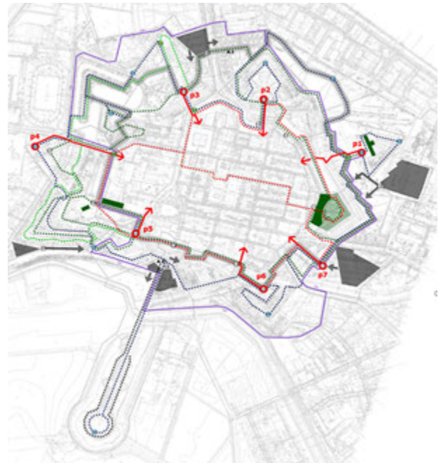
4. Koncepcja przebiegu tras turystycznych opartych na podstawie studium widokowego, oprac. U. Forczek-Brataniec, J Środulska-Wielgus., K. Wielgus