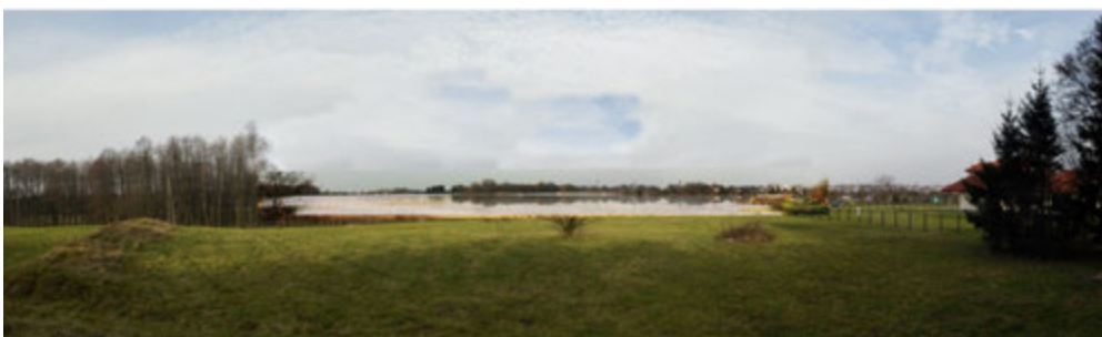
5. Widok z nad Wielkiej Zalewy. Stan istniejący oraz symulacje widoku, jaki będzie dostępny po usunięciu kurtyny drzew i ponownym wypełnieniu zalewy wodą, oprac. U. Forczek-Brataniec