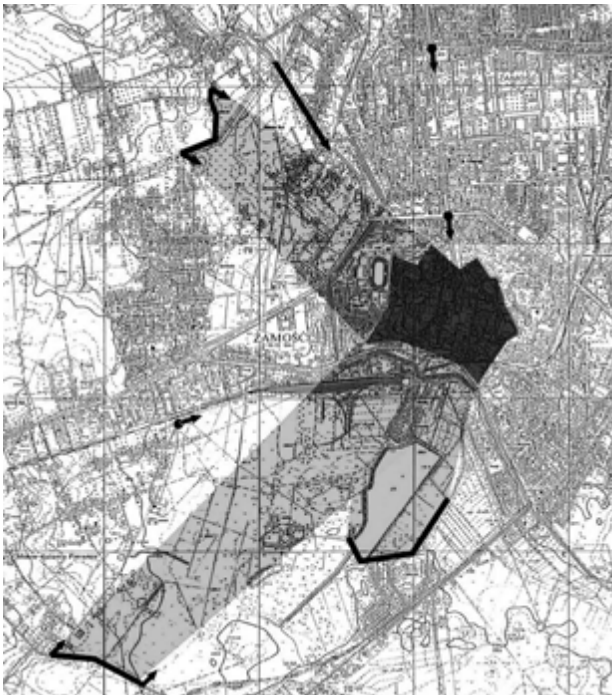
3. Twierdza Zamość w widoku z zewnątrz, zachowane przedpola widokowe wymagające ochrony, oprac. U. Forczek-Brataniec