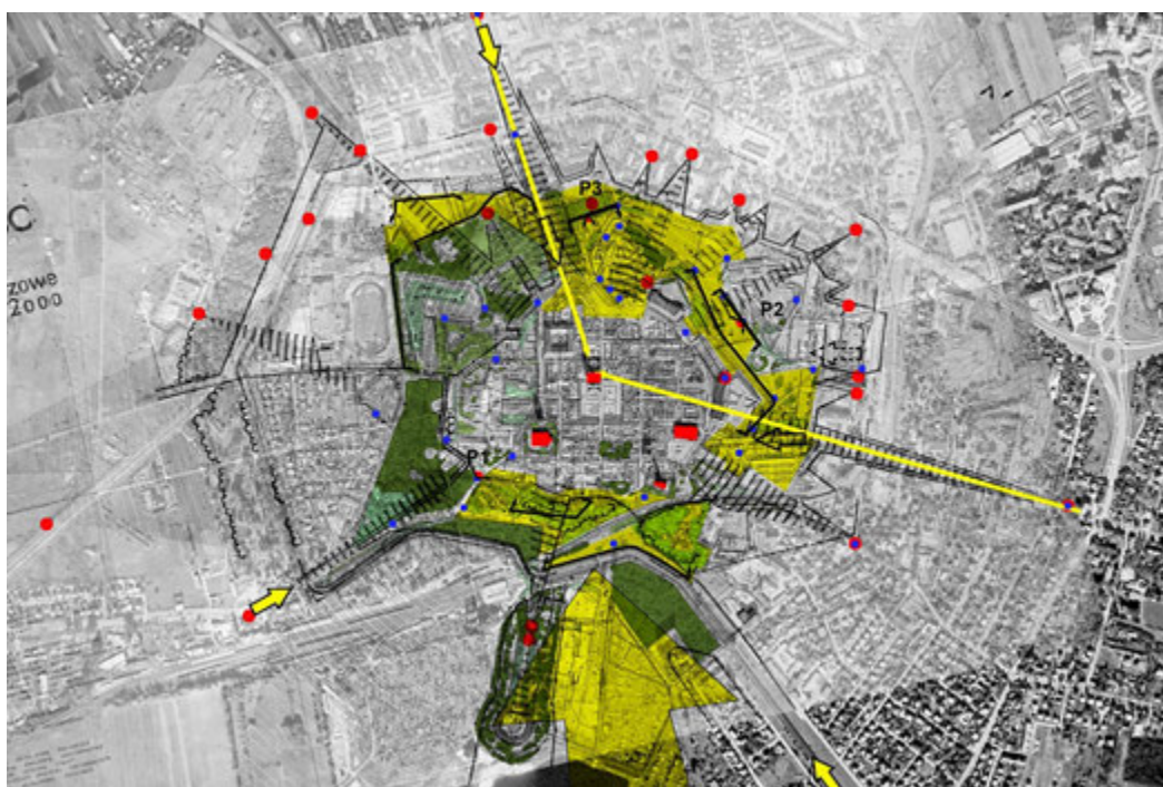
2. Analiza ekspozycji występującej w 2006 r. w zestawieniu ze stanem z lat 70., oprac. U. Forczek-Brataniec

1. A landscape study conducted for spatial planning in Zamość in the 1970s, source: Archives of the City of Zamość