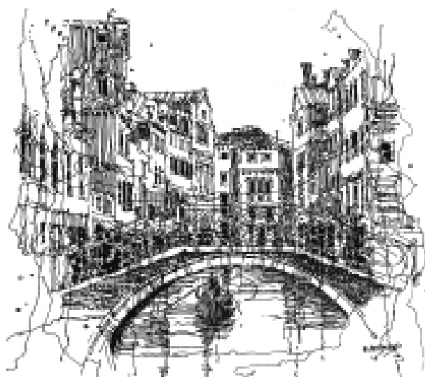
Il. 6. Kanał w rejonie bazyliki, rys. autorki Ang.....

Tradycja ta była okazją do zatracenia się i formą odnowy społecznej, dawała możliwość ucieczki do innego świata i rzeczywistości. Wenecja stawiała się przestrzenią, gdzie dopuszczalne były wszelkie transgresje: miejscem, gdzie mieszała się wysoka kultura z niską, na styku zimy i wiosny, życia i