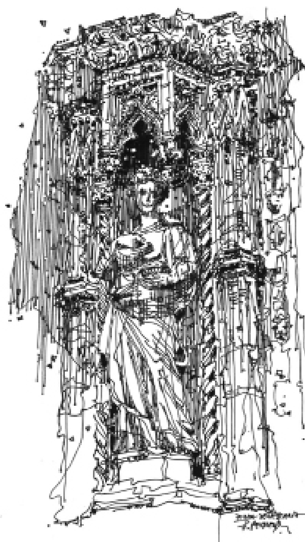
Il. 5. Pałac Dożów, Porta della Carta, rys. autorki Ang.....

Mit Wenecji jako miasta śmierci funkcjonuje w literaturze, filmie, eseistyce i innych tekstach kultury. Jego szczególna trwałość występuje w kulturze europejskiej co najmniej od końca XVIII wieku pod wieloma postaciami i w różnych symbolicznych układach. Doświadczenie piękna i doświadczenie śmierci, romantyczna egzaltacja, topos przemijalności a także dekadentyzm i pesymizm weneckich tekstów wykorzystujących kontekst znaczeń narosłych przez wieki nad tym obszarem, do dziś silnie wpływa na percepcję i wizerunek Wenecji 40 . Duszna, efemeryczna, wilgotna przestrzeń poddana