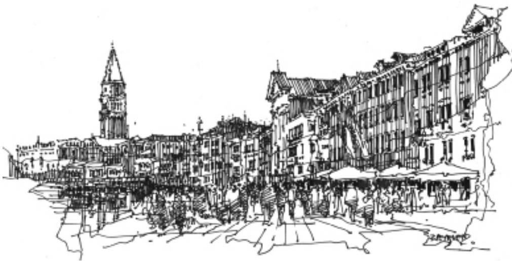
Il. 1. Krawędź południowa miasta od strony Riva degli Schiavoni, rys. autorka