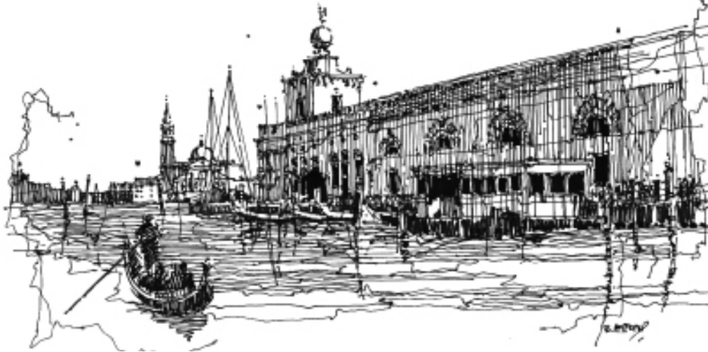
II.2. Canal Grande: Punta della Dogana, w tle San Giorgio Mag- giore, rys. autorki