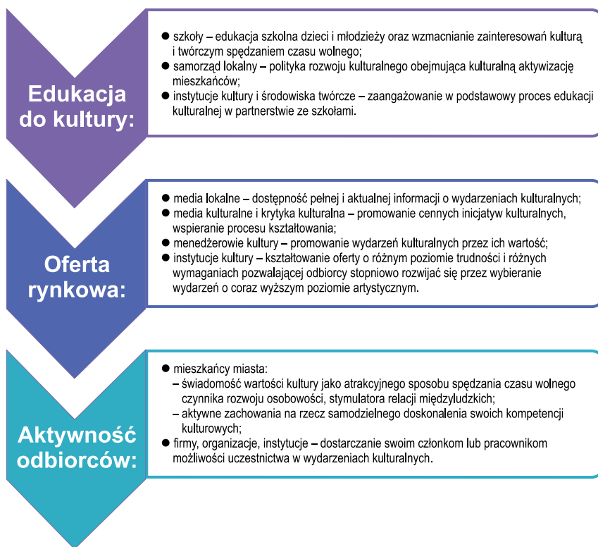
Ryc. 3. Łańcuch kształtowania kompetencji kulturowych odbiorców wydarzeń scenicznych i plenerowych

widualne cechy odbiorcy oraz jego wyedukowanie. Można powiedzieć, że warunkiem, a może nawet nieodzownym elementem efektywnego tworzenia oferty kulturalnej jest stałe doprowadzanie do spotkania – rozumianego raczej metaforycznie niż wprost – twórcy i odbiorcy. Do urzeczywistnienia tego spotkania konieczna jest jednak skłonność obydwu stron do „opuszczenia” swoich pozycji i chęć wzajemnego zrozumienia. Oznacza to, że twórcy powinni uwzględniać, w treści i formie swoich działań artystycznych, oczekiwania i możliwości odbiorców (czego nie należy absolutnie utożsamiać z rezygnacją z ambicji artystycznych i spływaniem przekazu), zaś odbiorcy muszą być gotowi nie tylko do bezkrytycznej i łatwej „konsumpcji” dzieła, lecz także do zmierzenia się z trudnościami, które często charakteryzują obcowanie z ambitnymi przejawami kultury.