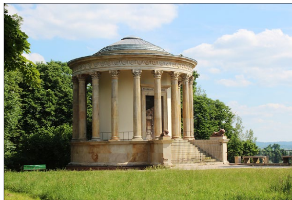
Ryc. 8. Puławy, Świątynia Sybilli, stan obecny

Autorem neogotyckiego Zameczku w Łańcucie był także Ch.P. Aigner. Piętrowy budynek z narożną basztą był miejscem odosobnienia księżnej marszałkowej, a elementem nawiązującym do sztuki antyku była również Glorietta z czasów księżnej Lubomirskiej z rzeźbą