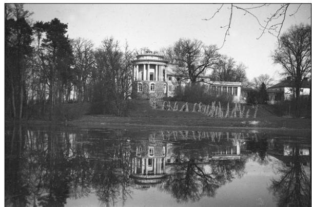
Ryc. 4. Zarzecze, pałac na fotografii z okresu międzywojennego

Fig. 3. Zarzecze, cadastral plan, 1849