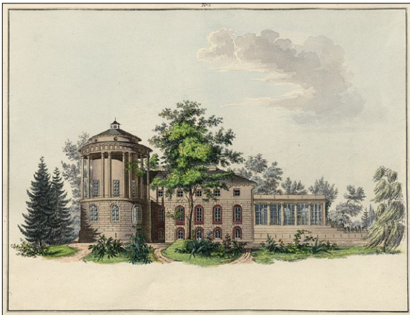
Ryc. 1. Zarzecze, widok pałacu od strony południowej; rys. Magdalena z Dzieduszyckich Morska, za: Morska 1836, tabl. 2

Fig. 1. Zarzecze, view of the palace from the south; drawing by Magdalena Morska, née Dzieduszycka, from: Morska 1836, tabl. 2