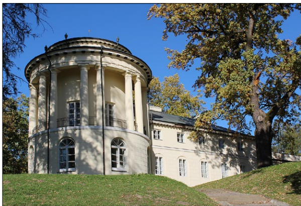
Ryc. 5. Zarzecze, południowa elewacja pałacu, stan obecny; fot. M. Zub

Fig. 4. Zarzecze, the palace in a photograph from the interwar period; source: Narodowe Archiwum Cyfrowe, Koncern Ilustrowany Kurier Codzienny – Archiwum Ilustracji, Zespół Pałacowo-Parkowy Dzieduszyckich w Zarzeczu, sign. 3/1/0/9/8149/1