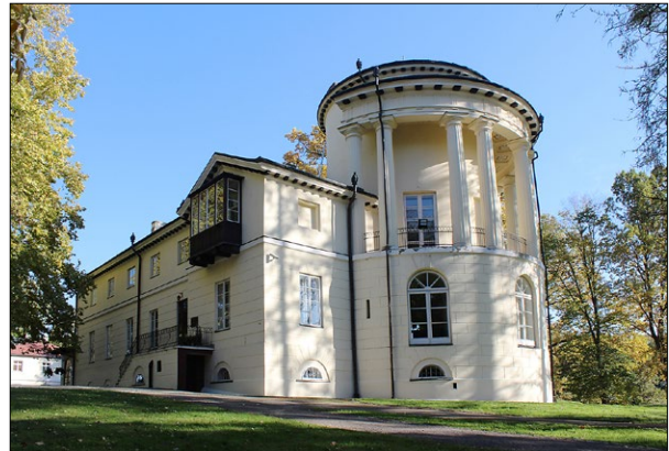
Ryc. 6. Zarzecze, widok pałacu od północnego zachodu, stan obecny

Fig. 5. Zarzecze, south facade of the palace, present state