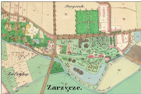
Ryc. 3. Zarzecze, plan katastralny, 1849

Fig. 3. Zarzecze, cadastral plan, 1849