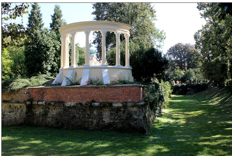
Ryc. 9. Łańcut, Glorietta, elementy antyczne w zabudowie rezydencji łańcuckiej; fot. M. Zub Fig. 9. Łańcut, Glorietta, ancient elements in the buildings of the Łańcut mansion; photo by M. Zub

Diany, otoczona kwiatowymi grządkami, posadowiona na północno-zachodnim bastionie obwodu obronnego głównego budynku zamkowego, zaprojektowana przez Aignera i dekorowana przez Baumaną (ryc. 9).