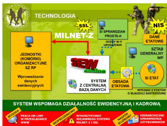
Rysunek 1. Algorytm wdrażania systemu informatycznego SEW on-line

Algorytm wdrażania do eksploatacji użytkowej systemu SEW on-line oraz przepływy informacyjne z dotychczasowych systemów ewidencji zasobów osobowych zostały przedstawione na rysunku 1.