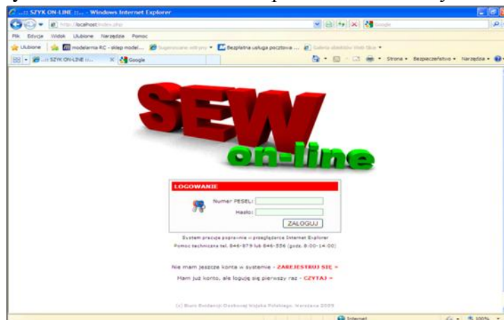
Rysunek 3. Logowanie do systemu informatycznego SEW on-line

Logowanie do systemu SEW on-line zostało przedstawione na rysunku 3.