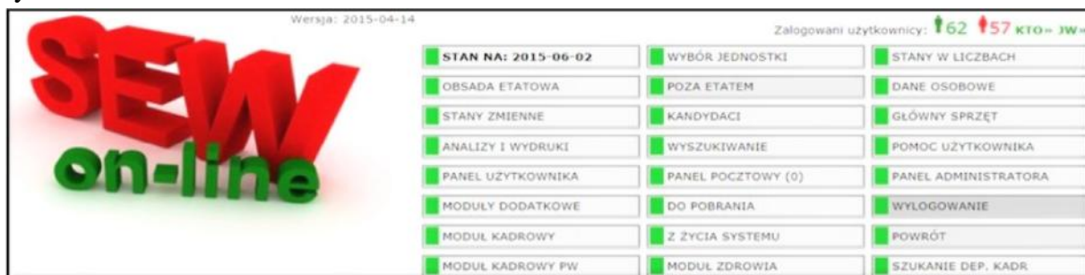
Rysunek 4. Dostęp do modułów systemu informatycznego SEW on-line

Dostęp do poszczególnych modułów odbywa się z okna dialogowego przedstawionego na rysunku 4.