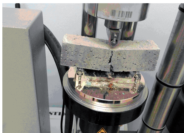
RYSUNEK 3. Próbką zaprawy w momencie badania wytrzymałości na zginanie (opracowanie własne)