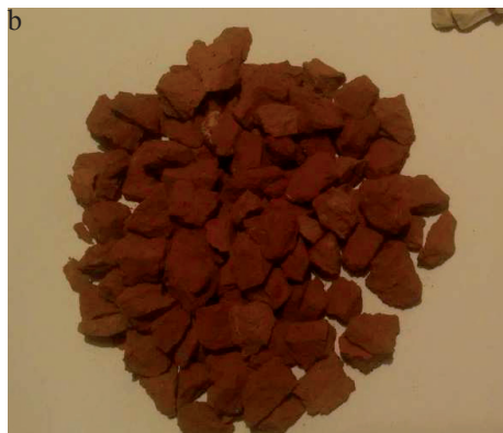
RYSUNEK 1. Odpadowe materiały ceramiczne: a – w formie odpadu; b – w formie kruszywa grubego (opracowanie własne)