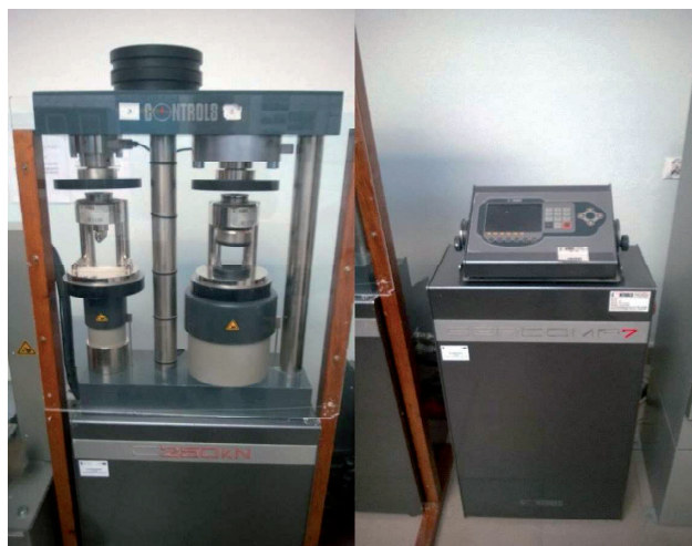
RYSUNEK 2. Stanowisko badawcze oraz zintegrowany elektroniczny układ pomiarowy (opracowanie własne)