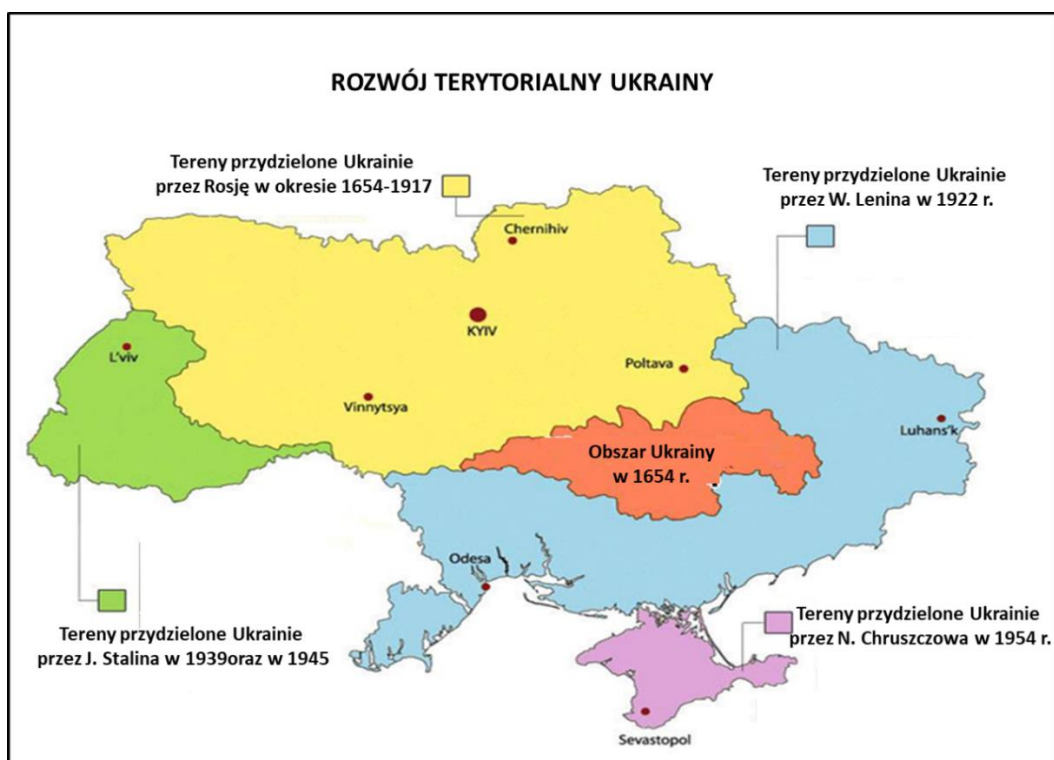
Rys. 1. Rozwój terytorialny Ukrainy

Na przykład w naukach humanistycznych, w opinii historyków źródła konfliktu ukraińskiego ułożone są w przeszłości Ukrainy. Natomiast w przekonaniu kulturoznawców w różnorodności kulturowej, z kolei politolodzy są przekonani, że zasadniczym czynnikiem konfliktu jest krótki okres ukraińskiej państwowości. W ogólnych rozważaniach należy się zgodzić z tezą, że w historii Ukrainy jej ziemie należały do różnych imperiów, które wpływały na kształtowanie się państwowości. Ukraina, jak wiele państw w Europie powstała w efekcie pozyskiwania kolejnych terenów (rysunek 1).